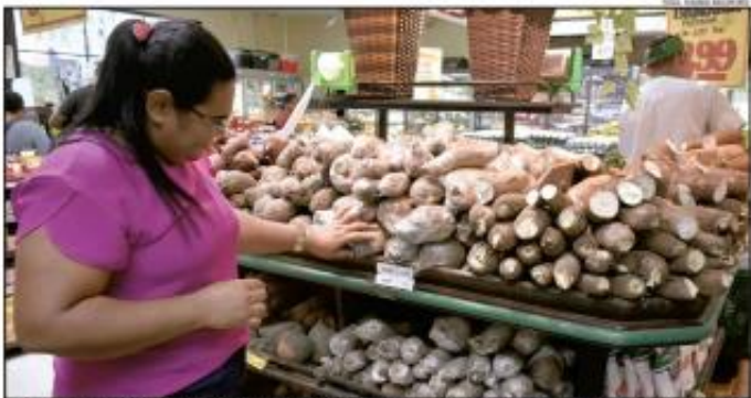
Segundo a pesquisa divulgada pelo IPEA, os preços de produtos que compõem a cesta básica, em supermercados em Natal, aumentaram em dezembro de 2024 em relação a 2023.

Quando se fala em alimentos, carnes, proteínas e legumes, a cesta básica em Natal apresenta um aumento de R$ 1,07, ou 0,2%, em dezembro, de acordo com o levantamento do Instituto de Pesquisas Econômicas da Universidade Federal do Rio Grande (FURG). Os pesquisadores constataram que a cesta básica em Natal teve um aumento de R$ 428,62 em dezembro de 2024, em comparação com o mesmo mês de 2023. Segundo o levantamento, a cesta básica em Natal teve um aumento de R$ 428,62 em dezembro de 2024, em comparação com o mesmo mês de 2023. Segundo o levantamento, a cesta básica em Natal teve um aumento de R$ 428,62 em dezembro de 2024, em comparação com o mesmo mês de 2023.