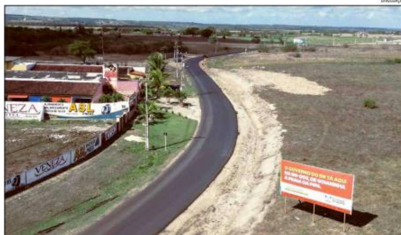
Previstos inicialmente para entrega em dezembro os serviços foram suspensos no mês passado, pouco antes do Natal