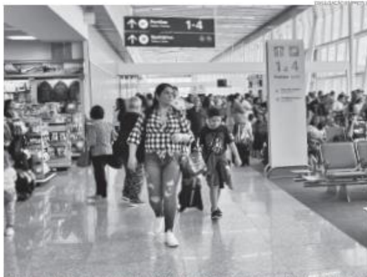
Além do aumento no número de passageiros, o RN também registrou um crescimento de 8% na oferta de assentos.