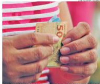
Criação de novos postos de trabalho elevou poder aquisitivo e ajudou a alta do PIB

ficativo em relação aos anos anteriores e superou as expectativas dos especialistas.