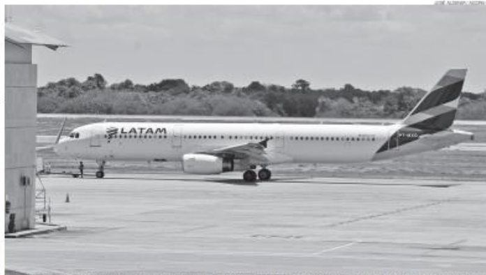
Latam confirmou suspensão da rota direta por "questões comerciais", mas garantiu a continuidade de 52 voos semanais entre Natal a hubs estratégicos no país

para essa rota. "Isso mantém o Estado bem abastecido de conectividade", explicou.