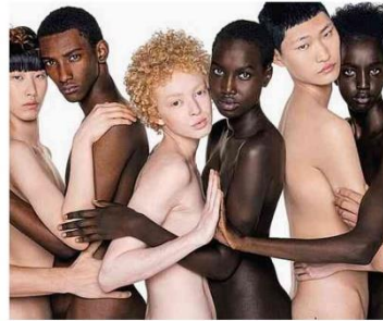
Publicidade com foto de Oliviero Toscani; ele também levou a anúncios condenados à morte e pacientes com Aids

A lei que veta o uso de celular em escolas públicas e privadas de todo o país, da educação infantil ao ensino médio, foi sancionada ontem pelo presidente Lula (PT). O governo pretende implementar a medida neste ano letivo. Para isso, deve fazer ações de conscientização com escolas, famílias e estudantes. Cotidiano A28