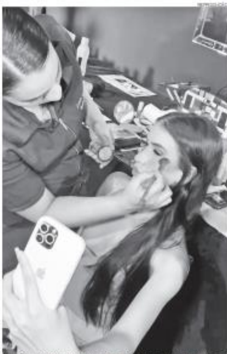
Estado tem 125.053 MEIs em atividade, todos optantes pelo Simples ativo

O número de MEIs cresceu significativamente, atingindo 125.053. As microempresas (MEs) somaram 61.874 registros, enquanto as empresas de pequeno porte (EPPs) totalizaram 8.644. Entre os setores econômicos, os serviços se destacaram com 97 mil empresas, seguidos pelo comércio (68.852), indústria (17.307), construção (11.346) e agropecuária (1.051).