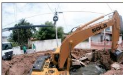
» SUSTO Temporal que caiu em Natal ontem deixou várias regiões da cidade com problemas. Trecho da esplanada que está em obras ficou alagado e máquina foi engolida por tráfego na zona Norte. Pelas ruas, as ruas congestionamento e buracos abertos pela força da água. » PÁGINA 11