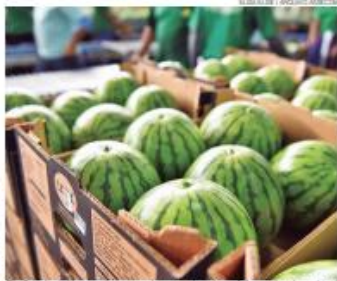
Rio Grande do Norte registrou crescimento acima das médias nacional e regional

O Rio Grande do Norte superou as expectativas ao liderar o crescimento econômico do Nordeste em 2024, com um Produto Interno Bruto (PIB) projetado para crescer 6,1%, conforme dados do relatório Pesquisa Regional do Banco do Brasil. O RN ficou atrás apenas da Paraíba, que registrou crescimento de 6,6%. No Brasil o crescimento projetado é de 3,5% e no Nordeste de 3,8%. O resultado representa um avanço signifi-