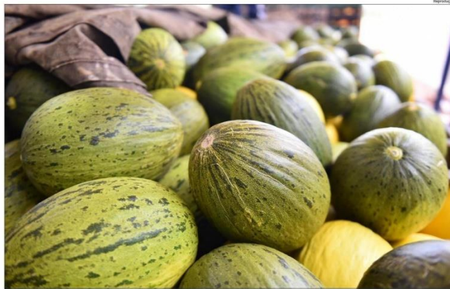
Produção de melão na região de Mossoró é um dos destaques da pauta de exportações

No ano passado, os produtos mais exportados pelo Rio Grande do Norte foram óleo combustível (US$ 558,7 mi), melão (US$ 120,1 mi), óleo die-