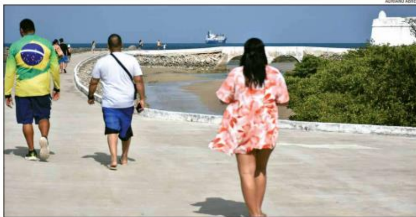
Forte dos Reis Magos registrou um incremento no número de visitantes, alcançando 450 pessoas por dia