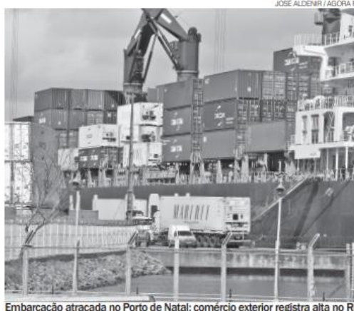
Embarcação atracada no Porto de Natal: comércio exterior registra alta no RN