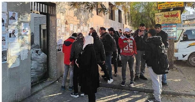
Parentes de detidos sob Assad procuram informações no hospital Al-Mujatahid, em Damasco

Alegando a necessidade de se precaver dos extremistas que integram o novo governo do vizinho, Israel anunciou que irá dobrar a ocupação do território sírio das Colinas de Golã, anexado pelo Estado judeu na guerra de 1967. Mundo A23 e A24