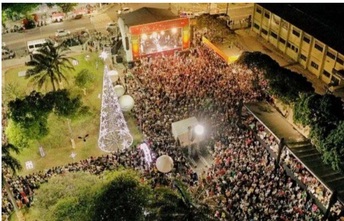
Brilha Natal 2024

A Praça Cívica ficou repleta de brilho e emoção na noite desta sexta-feira (13), com a abertura do Brilha Natal Fecomércio RN 2024 . O evento, promovido pelo Sistema Fecomércio RN, Sesc e Senac, levou 27 mil pessoas ao bairro do Tirol que assistiram a apresentação da Orquestra do Papão e ao show memorável do cantor Alceu Valença, com sucessos marcantes como “Anunciação” e “Tropicana”.