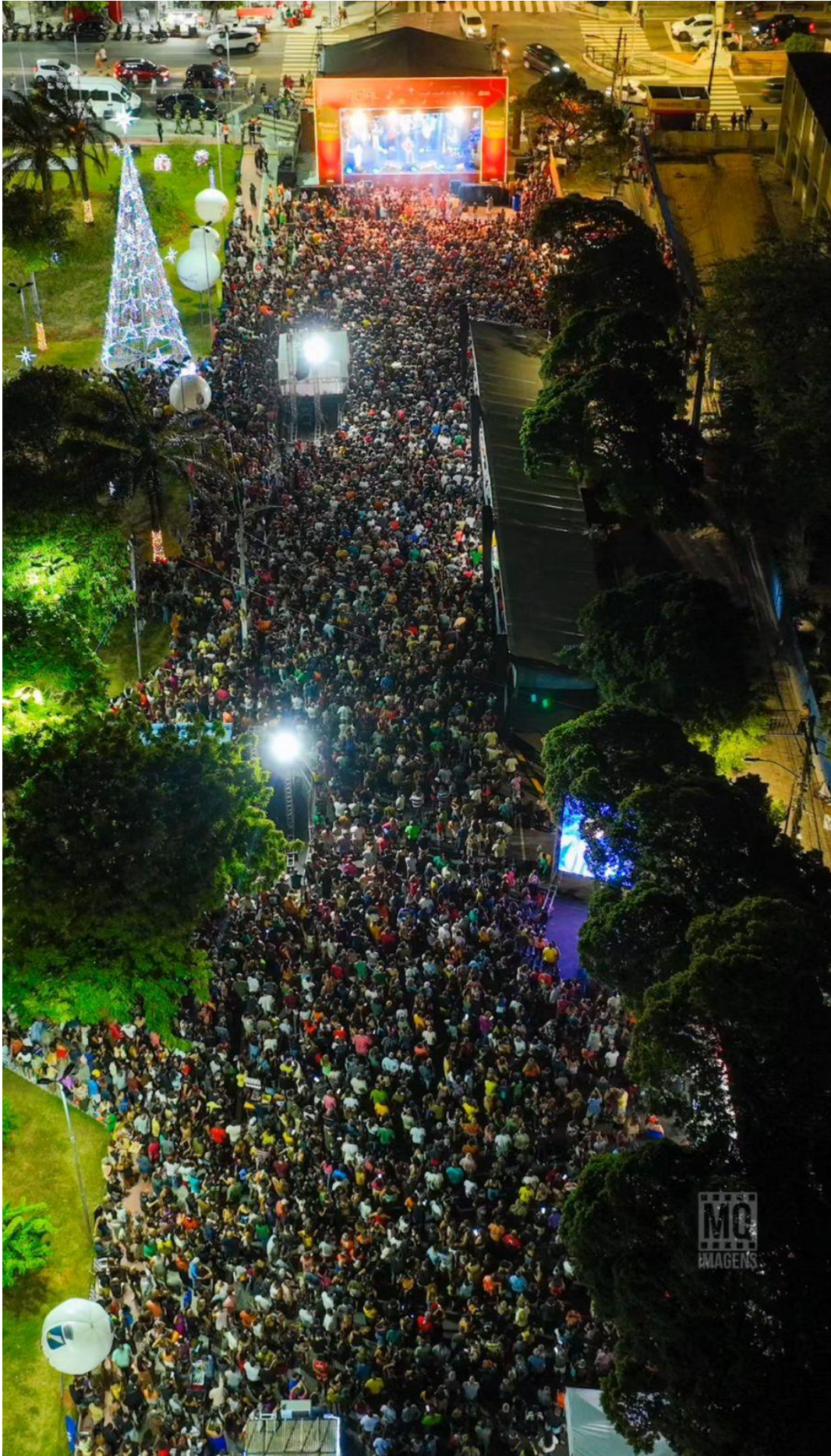
Sesc Senac IFC