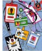
Ilustração de Marília Marz