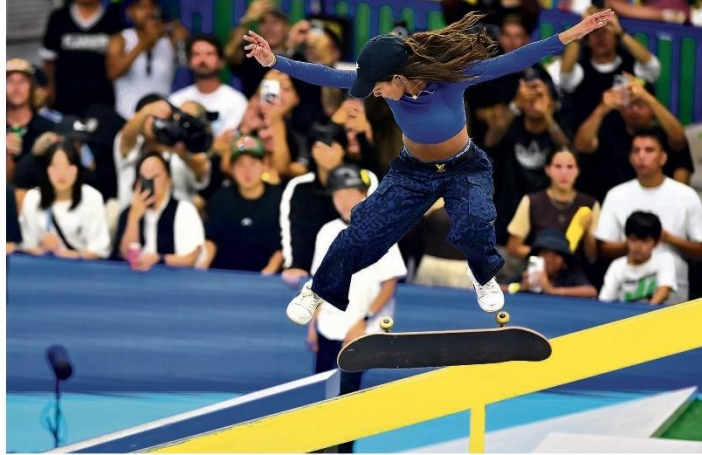
Com emoção. Rayssa virou na reta final da prova

Rayssa Leal deu mais uma prova de seu gigantesco talento precoce. Numa reviravolta na última manobra, ela superou a japonesa campeã olímpica e se tornou a primeira atleta a faturar três edições seguidas da Liga Mundial de Skate Street, para delírio das 16 mil pessoas que lotaram ontem o ginásio do Ibirapuera, em São Paulo. "Estou realizada", resumiu a brasileira. PÁGINA 26