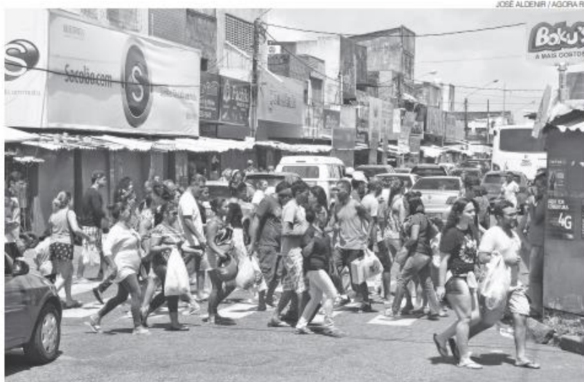
Consumidores que realizarem compras nas lojas participantes podem participar da campanha promocional

Desde o início da campanha, os lojistas desses bairros têm recebido capacitações gratuitas oferecidas pelo SENAC, com foco em marketing estratégico, montagem de vitrines e técnicas de vendas. "Queremos que os comerciantes estejam preparados para atender bem os clien-