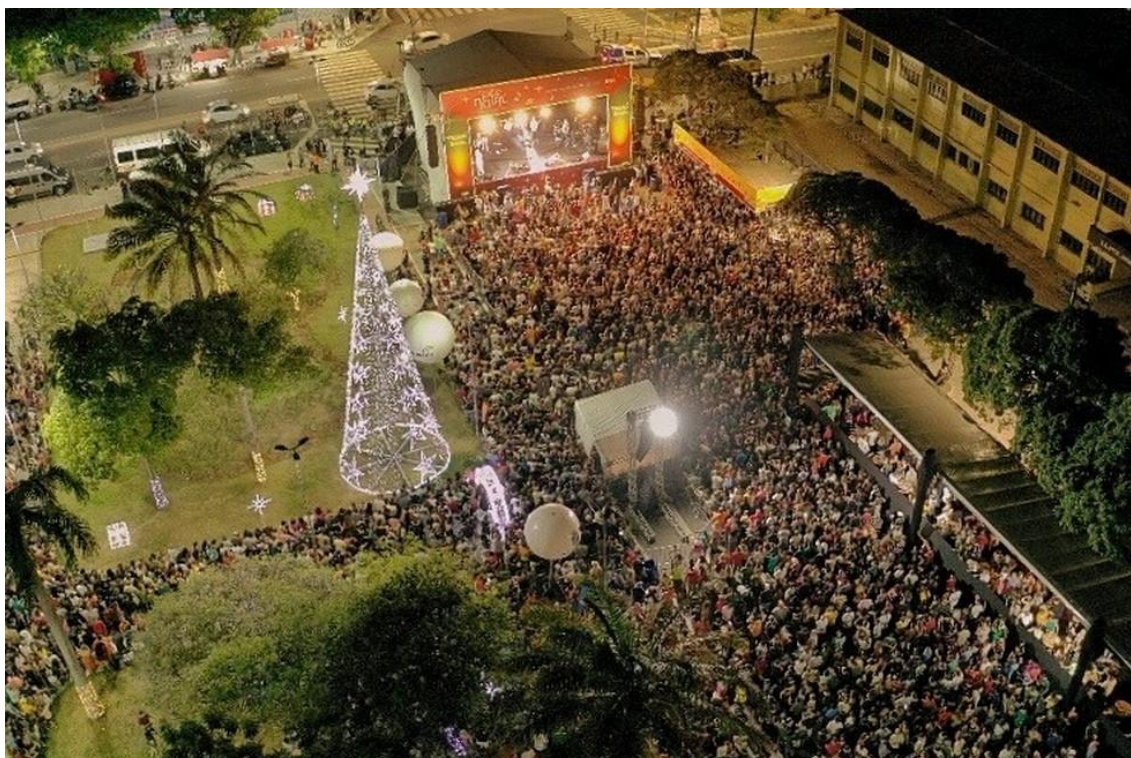
Show de Alceu Valença na Praça Cívica, em Natal

Eventos aconteceram nesta sexta-feira (13) dentro da programação do Brilha Natal e do Natal em Natal.