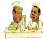
— Vamos voltar a cozinhar...