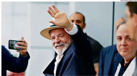
Alta: Lula saiu do Sirio-Libanês neste domingo, usando um chapéu para esconder as cicatrizes da cirurgia para conter sangramento