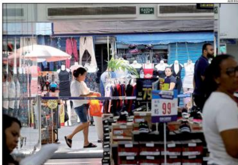
A região da Grande Natal lidera na concentração dos pequenos negócios com 57,21%, seguida pelo Oeste com 12,66%.

Ele destacou que o acumulado de 23.265 empregos gerados somente pelas Micro e Pequenas Empresas (MPE) no estado, nos dez meses de 2024, cresceu 31% em comparação com o mesmo período de 2023, quando somaram 17.787. "Esse crescimento reflete o esforço e a resiliência dos empreendedores locais, que têm superado desafios e impulsionado o desenvolvimento em diversas regiões do estado. Destaca-