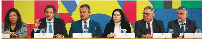
Tropa. Pacote foi detalhado pelos ministros Esther Dweck (Gestão), Haddad (Fazenda), Rui Costa (Casa Civil), Tobet (Planejamento), Padilha (Relações Institucionais) e Pimenta (Secom)

RIO DE JANEIRO, SEXTA-FEIRA, 29 DE NOVEMBRO DE 2024 ANO C - Nº 33.352 - PREÇO DESTE EXEMPLAR NO R$ 6,00