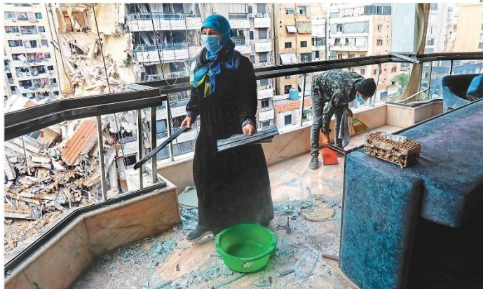
A trégua formalizada entre Israel e o Hezbollah teve como efeito imediato engarrafamentos nas estradas que levam ao sul do Líbano e à capital, Beirute (foto), no retorno em massa de moradores que haviam fugido dos bombardeios. Eles se depararam com um cenário de terra arrasada: segundo o Banco Mundial, mais de 99 mil unidades habitacionais foram destruídas. PÁGINA 27