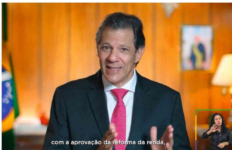
O ministro Fernando Haddad (Fazenda) anuncia medidas do pacote econômico em pronunciamento na TV.