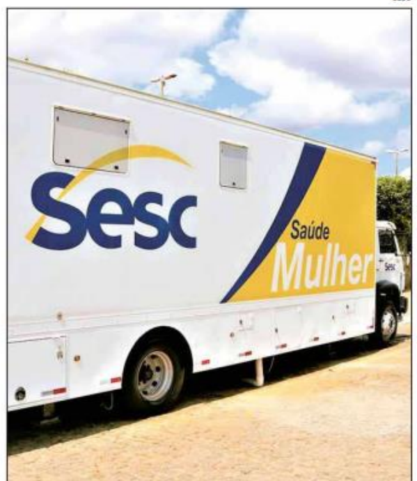
Exames realizados pelo Sesc são gratuitos

Horários de atendimento: De segunda a sexta-feira, das 09h às 12h e das 13h às 16h