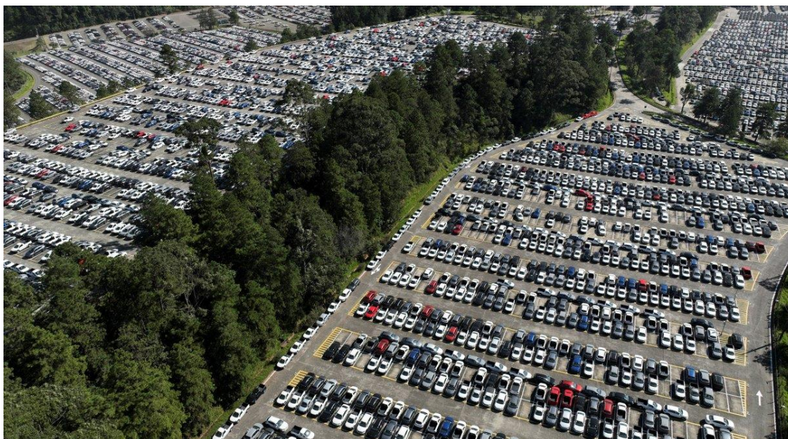
Estacionamento da fábrica da Volkswagen em São Bernardo do Campo

O Índice de Confiança da Indústria (ICI) recuou 1,3 ponto em novembro na comparação com o mês anterior e foi a 98,6 pontos