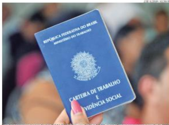
Nos dez primeiros meses, foram 2.117.473 vagas, resultado é 18,6% mais alto que no mesmo período de 2023

DESTAQUES. Nos serviços, a criação de empregos foi puxada pelo segmento de informação, comunicação e atividades finan-