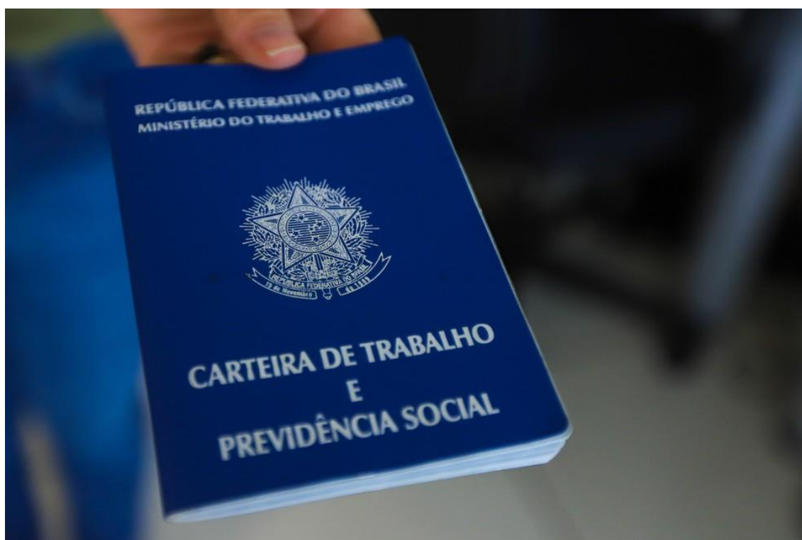
Carteira de trabalho

Esse é o pior resultado para outubro desde o início da série histórica. Nos dez primeiros meses do ano, país criou 2,12 milhões de vagas com carteira assinada, aumento de 18,7% em relação a 2023.