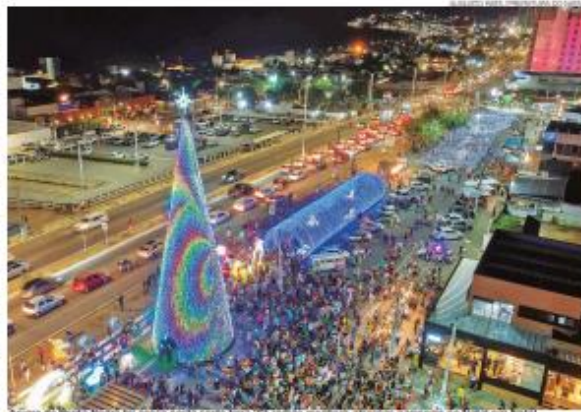
Árvore de Ponta Negra foi acesa nesta sexta-feira 22 e seguirá recebendo atrações nacionais no Natal em Natal

ÁRVORE DE PONTA NEGRA É ACESA. A árvore da Avenida Praia de Ponta Negra tem 20 metros e será decorada com tecnologia de acendimento mapeado, permitindo projeções de figuras e palavras ao longo da árvore. Além disso, o Polo Ponta Negra contará com dois túneis iluminados de 30 metros, também com LEDs RGB, criando uma atmosfera