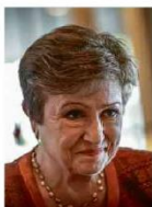
Kristalina Georgieva

Complexidade de pardo não deve pôr em xeque cotas A31