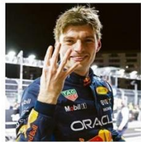
MARK THOMPSON / BETTY JAMES

Com o resultado de Las Vegas, holandês da Red Bull chega a 403 pontos e leva o título com duas provas de antecedência.