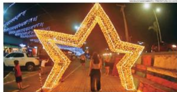
Estrutura de iluminação foi acesa nesta sexta-feira na Avenida Praia de Ponta Negra, na Zona Sul de Natal

A tradicional Caravana de Natal da Coca-Cola também fará parte das festividades, com desfile programado para o dia 21 de dezembro. Este ano, uma novidade marcará o evento: a inclusão da Zona Norte no percurso, abrangendo importantes avenidas, como a Doutor