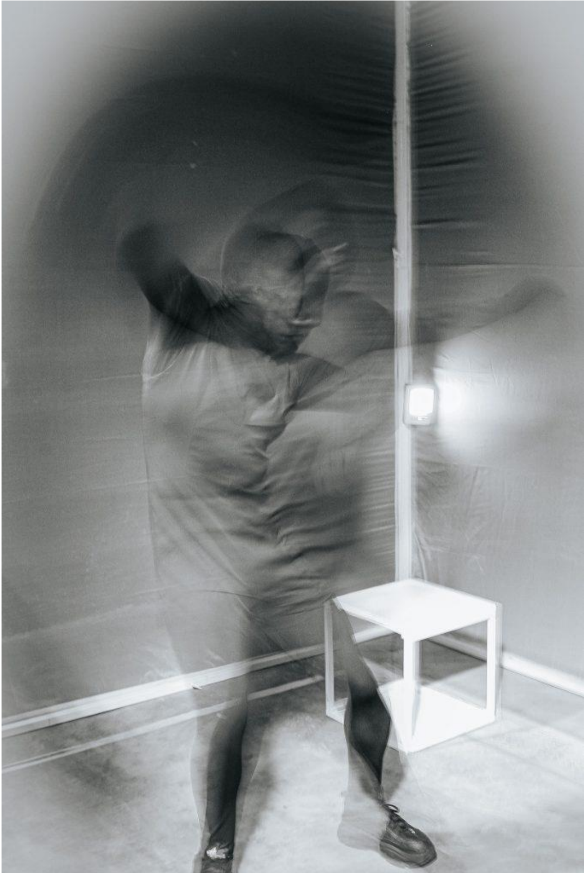
Iuri Alves