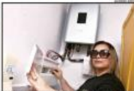
Residência em Natal com sistema fotovoltaico instalado.

Com um acumulado de 62.520 sistemas instalados e 2.942 novos em setembro de 2024, Natal lidera o ranking de conexões fotovoltaicas no Rio Grande do Norte. Natal possui o maior índice de distribuição de energia solar. Segundo dados do Observatório da Energia Solar, Natal possui 13.258 sistemas (21,7% do total) e 2.942 novos em setembro de 2024. Em seguida vem o município de São José do Bonfim, com 10.123 sistemas (17,8%) e 1.234 novos em setembro de 2024. O terceiro colocado é a cidade de São José do Rio Grande, com 8.745 sistemas (15,7%) e 1.012 novos em setembro de 2024.