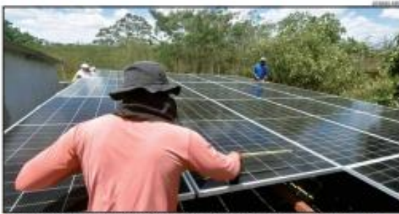
Apot: Instalação de painéis solares em uma residência em Natal.

As conexões fotovoltaicas no Rio Grande do Norte atingiram a marca de 22.078 novos sistemas entre janeiro e setembro de 2024, um recorde histórico que supera a quantidade de unidades contabilizadas anualmente desde 2015. AP, afirma, o maior desempenho foi registrado em setembro de 2024, com 2.942 novos sistemas. Os dados são do Observatório da Energia Solar, produzido pela Associação Potiguar de Energia Fotovoltaica (Apot-EN) em parceria com a Associação Brasileira de Energia Solar Fotovoltaica (ABRATESOL) e indicam que, em setembro deste ano, foram instalados 22.078 novos sistemas, o suficiente para gerar energia suficiente para abastecer 174 mil famílias em todo o Brasil.