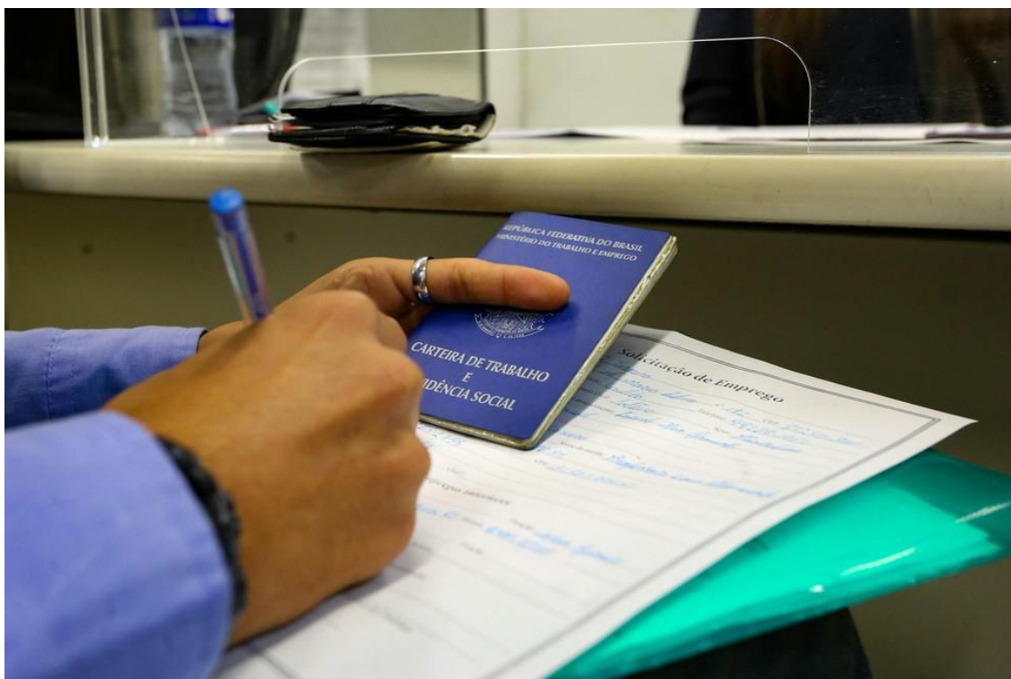
Carteira de trabalho

A população desalentada ficou em 3,1 milhões, o que representa uma estabilidade no trimestre e um recuo de 11,3% no ano. São pessoas que gostariam de trabalhar e estariam disponíveis, mas não procuraram emprego por acharem que não encontrariam, por falta de qualificação, por exemplo.