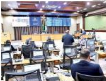
» CRIS: Divida do Estado com o Hospital Infantil Varela Santiago ganhou repercussão no plenário da Assembleia Legislativa. Deputados estaduais cobram pagamento. » PÁGINA 6