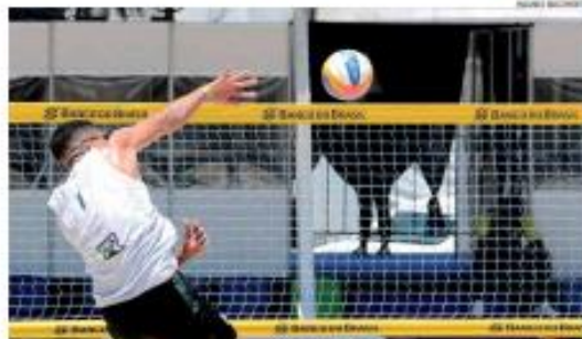
» VOLEIBOL » A arena de vôlei de praia, montada na parte externa da Casa de Apoio à Arena das Dunas, define hoje quem avança para as finais com presença de portugueses. » PÁGINA 12 E 13