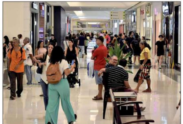
No mês de setembro, a receita do ICMS foi de R$ 710,8 milhões, o que representa queda de 3,46%

A retração, segundo a pasta, afeta não somente as finanças estaduais, mas também as municipais. O volume de repasses do imposto para as prefeituras potigua-