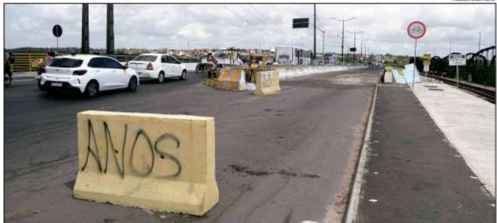
As obras de recuperação da Ponte de Igapó estão acontecendo desde 12 de setembro de 2023 e têm um orçamento de cerca de R$ 20,8 milhões