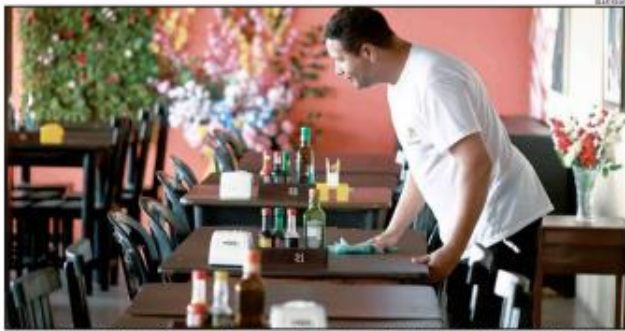
Sector mantém expectativas positivas para o fim do ano no RN, com incremento de 13% salário, férias e festas de final de ano