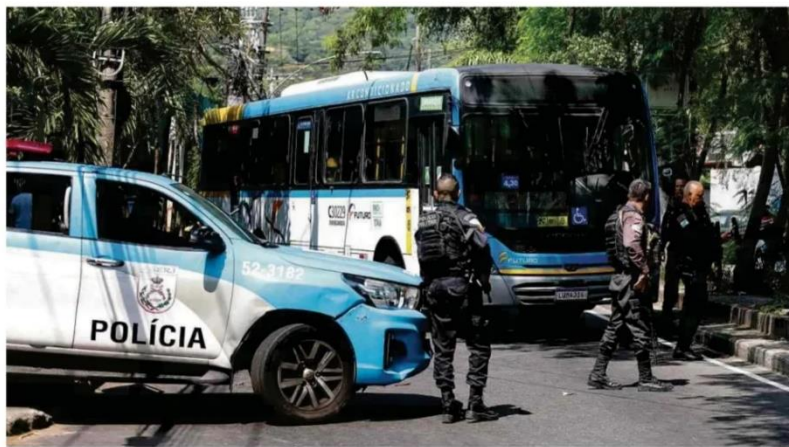
Márcia Fioletto/Agência O Globo