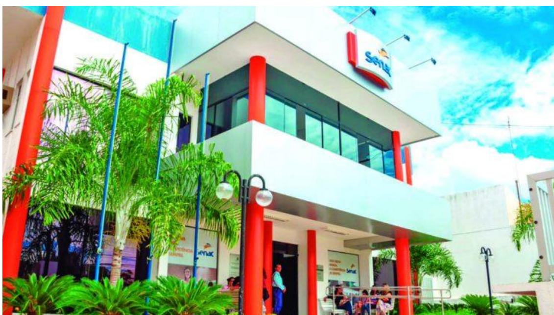
Sede do Senac no bairro do Alecrim, Natal

A unidade do Senac em Mossoró está ofertando 108 vagas gratuitas em cinco cursos de capacitação profissional. As inscrições estão abertas até a sexta-feira (18) e podem ser feitas na sede da unidade, situada no bairro Nova Betânia.