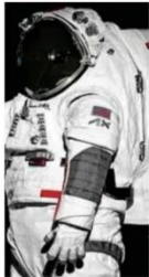
Traje AxEMU está em fase final de testes