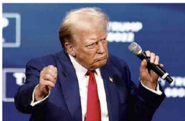
Donald Trump dança por quase 40 minutos em evento na Pensilvânia; vídeo tem sido usado por rivais

O presidente recebe representantes da bancada evangélica no Planalto, em cerimônia que estabeleceu o dia 9 de junho como a data comemorativa; no evento, o deputado bolsonarista Otoni de Paula (MDB-RJ) elogiou o petista e as políticas sociais do governo Política A11