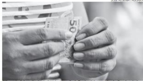
Alimento foi o principal alvo de pressão inflacionária, mostra indicador do Ipea

CLIMA. Os efeitos adversos do clima, especialmente sobre os preços das carnes (3%) e das frutas (2,8%), definem, em grande parte, a contribuição positiva à inflação de setembro. Ao mesmo tempo, como consequência da forte seca sobre os níveis dos reservatórios, a adoção da bandeira vermelha, em setembro, gerou um reajuste de 5,4% das tarifas de energia elétrica. No caso das famílias de renda alta, a inflação ainda foi impactada pelo aumento de 4,6% dos preços