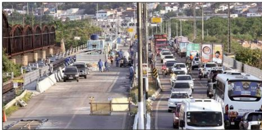
A interdição da ponte foi iniciada em setembro de 2023 e afeta pelo menos 350 mil moradores da zona Norte. Perito disse que interdição poderia ser evitada

O valor pode ser estimado partindo da circulação de 70 mil veículos/dia, o que permite estabelecer no mínimo 280 mil pessoas"