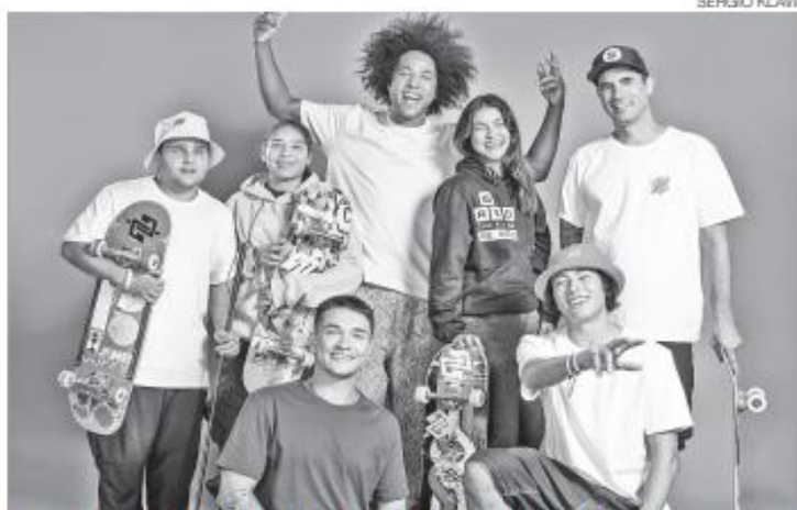
Festival Tamo Junto BB tem ingresso solidário: a entrada será 100% gratuita

O Festival Tamo Junto BB tem ingresso solidário: a entrada é 100% gratuita mediante a doação de 1 kg de alimento não perecível para ajudar os projetos sociais apoiados pelo Mesa Brasil Sesc .