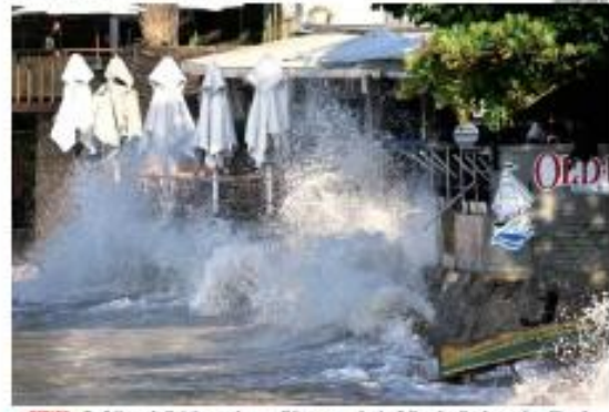
« PERIGO » Prefeitura de Natal anunciou medidas para reduzir efeitos da alta da maré no litoral. Instalação de barreiras com sacos de areia será intensificada para conter força do mar. » PÁGINA 7 »