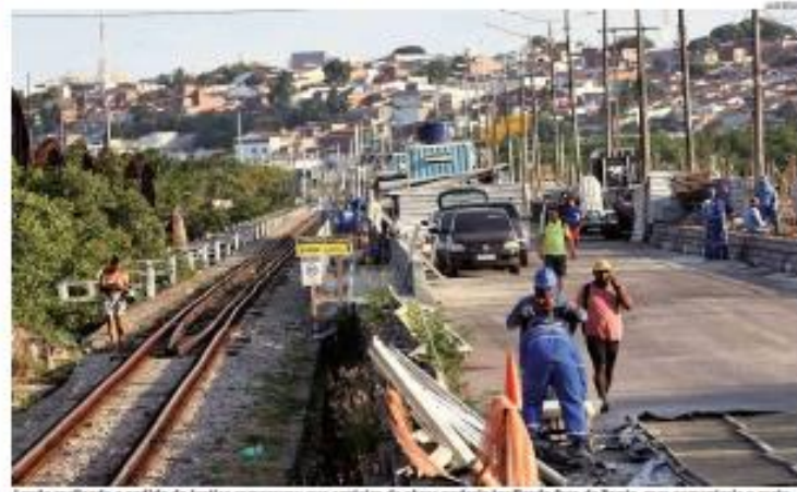
Lado realizado a pedido da Justiça comprovou que canteiro de obras poderia ter ficado fora da Ponte, mas aumentaria o custo

« ATRASO » A interdição de um dos lados da Ponte de Igapó gerou um prejuízo de R$ 17,9 milhões por mês aos natalenses, o que dá mais de R$ 233 milhões de impacto social para a população em 13 meses de bloqueio. O cálculo é da Prefeitura e foi apresentado à Justiça. A interdição da ponte afeta pelo menos 350 mil moradores da zona Norte de Natal. » PÁGINA 9 »