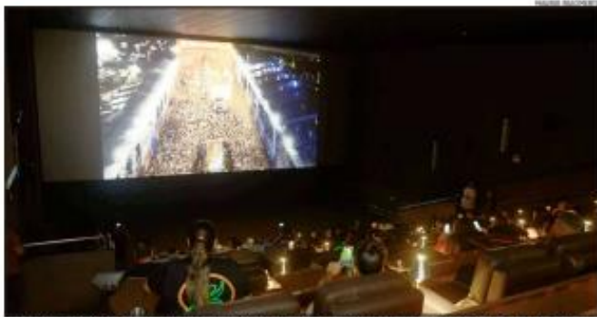
Primeira temporada de documentário especial sobre o Carnatal foi apresentada ontem à imprensa pela diretoria da micareta