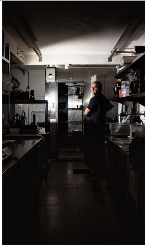
Perdas. A La Maddalena Osteria, em Pinheiros, é um dos restaurantes que tiveram prejuízos com a falta de energia

Agências reguladoras vêm sendo esvaziadas e politizadas PÁGINA 2