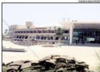
Investimento para recuperar o resort é de cerca de R$ 100 milhões

O hotel está localizado na Via Costeira, com área de terreno de 25.612,10 m², área construída de 13.972,27 m². O antigo Parque da Costeira tinha estrutura de lazer, sete piscinas, cinco salas de eventos e uma área localizada de 351 apartamentos. A distância entre o equipamento e o Oceano Palace é de 6,2 km. Desde 2019, a Justiça tentava vender o bem por meio de um processo para resolver o problema, o que só acabou ocorrendo em 2023.