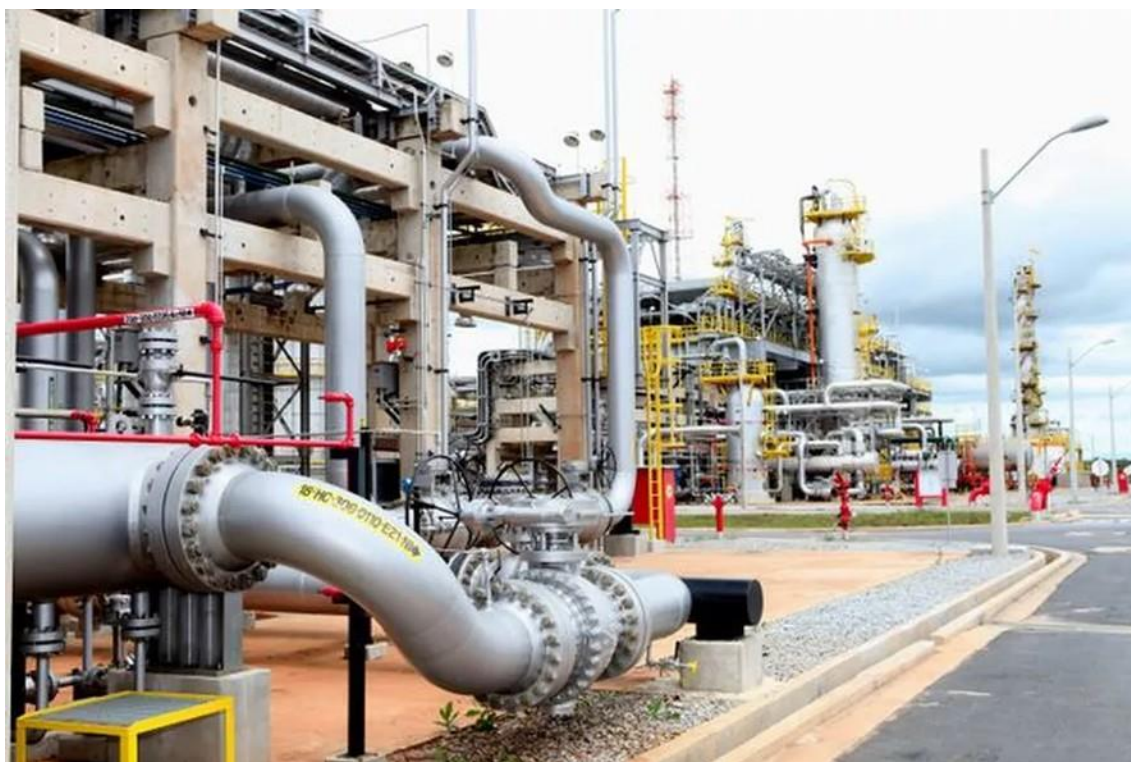
Unidade de terminal de gás da Petrobras

Queda ocorre por conta da variação cambial