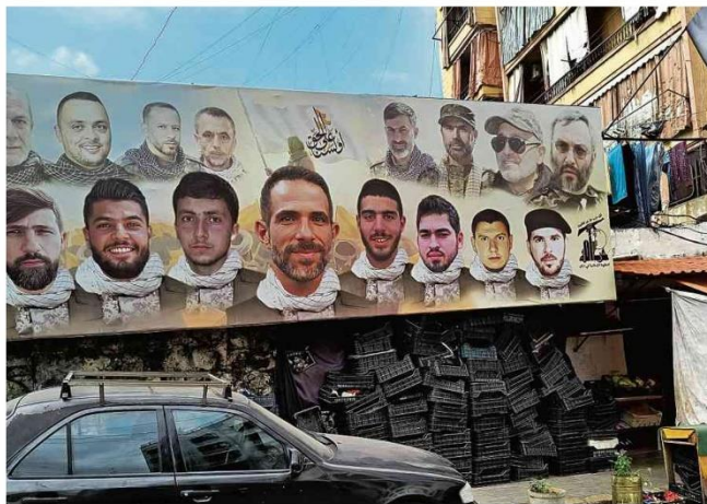
Integrantes do Hezbollah mortos em combate em pôster em Basta, bairro de Beirute

Diário de Navalni mostra diferença entre ter convicções ou só ideias B12