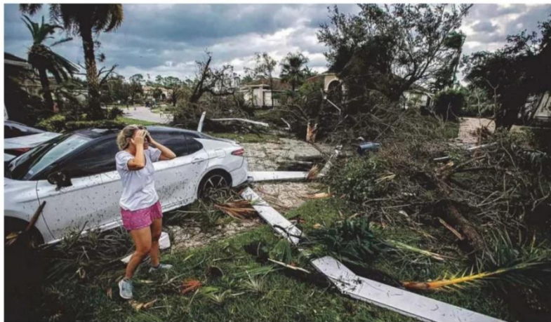
Mulher observa destroços de sua casa, destruída pelo furacão Milton em Wellington, na Flórida

Boulos tem algo a aprender com tiktoker eleito vereador no Rio pelo mesmo PSOL A9