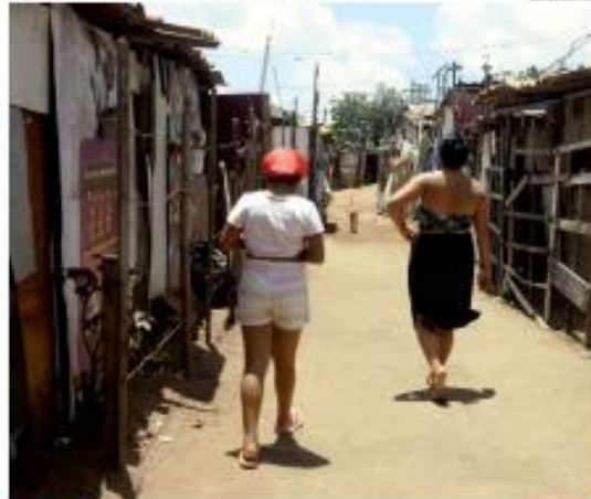
• DIGNIDADE • O RN • Heráclio, proposto por Sinduscon-RN e Fiern, promete enfrentar problema da falta de habitação no litoral. Meta é construir 16 mil casas populares em 2 anos. • PÁGINA 17 •