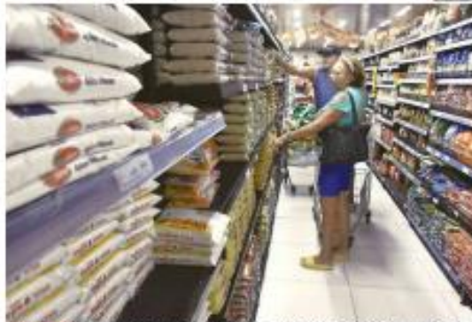
ALIMENTOS O consumo nos laros brasileiros cresceu 1,54% nas primeiras oito meses de 2024, segundo dados da Abimac. No RN, Assaré não observa esse crescimento e aponta queda. PÁGINA 6