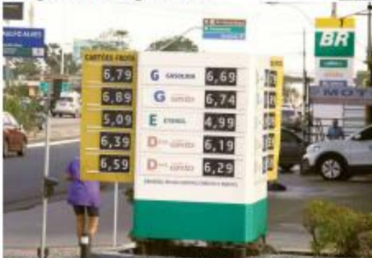
MAIS CARO Motoristas se surpreenderam com os preços dos combustíveis nas últimas semanas em Natal. A gasolina comum apresentou aumento e chegou a R$ 6,69 por litro. PÁGINA 7