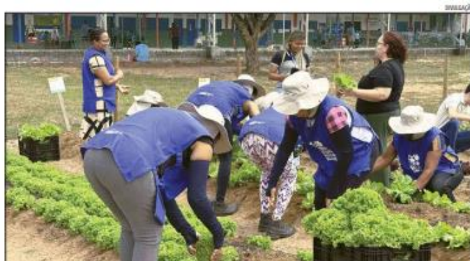
Mulheres, mães de educandos do Instituto Dom Bosco, cultivam hortaliças e estão aprendendo o valor nutritivo dos alimentos