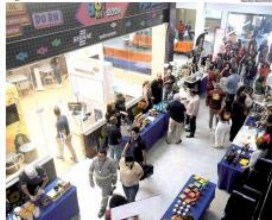
« REGIÕES » A Agência Sebrae teve uma participação estratégica na Festa do Boi deste ano, com uma série de atividades voltadas para o empreendedorismo e a inovação no agronegócio. » PÁGINA 6 »