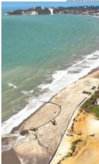
« REACÇÃO » Entidades do setor produtivo saíram em defesa da exigência de Ponta Negra e criticaram a recomendação da Procuradoria do Estado contra a obra. » PÁGINA 9 »

Inscrição - Número 116 - Quarta-Feira, 02 de outubro de 2024