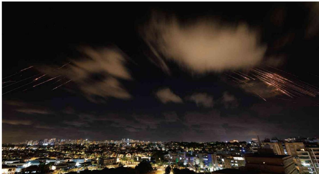
Mísseis iranianos são interceptados pelo sistema de defesa israelense na cidade de Ascalão; uma pessoa morreu na Cisjordânia

Brasileiras no Líbano fogem; avião decola para repatriação A34