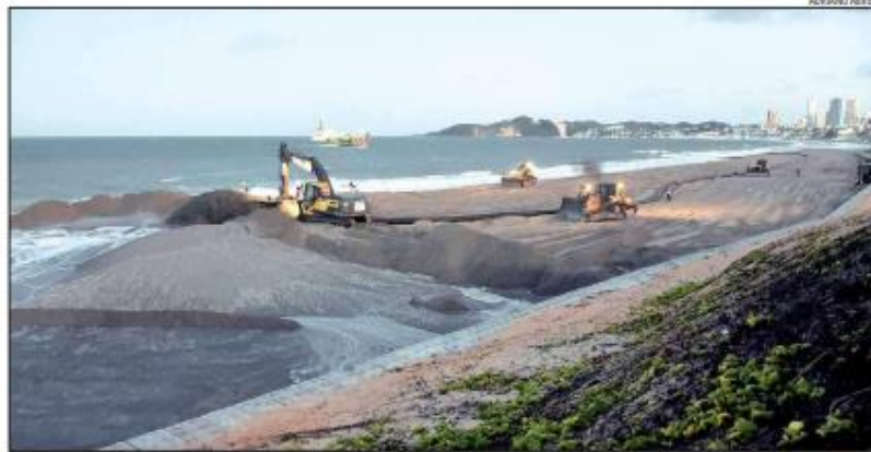
Documento da Procuradoria do Estado recomenda o embargo das obras da engorda. Setor produtivo criticou entendimento

“A referida Procuradora, não obstante o respeito pessoal que a ela todos devemos, faz, a partir de seu exercício profissional, uma aparente militância contra