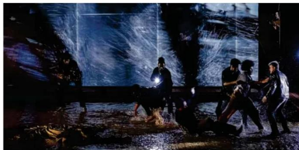
Cena da montagem da obra de Giuseppe Verdi no Theatro Municipal paulistano

Roteiro nos Bálcãs tem Croácia além de baladas e história na Sérvia B12 a B16