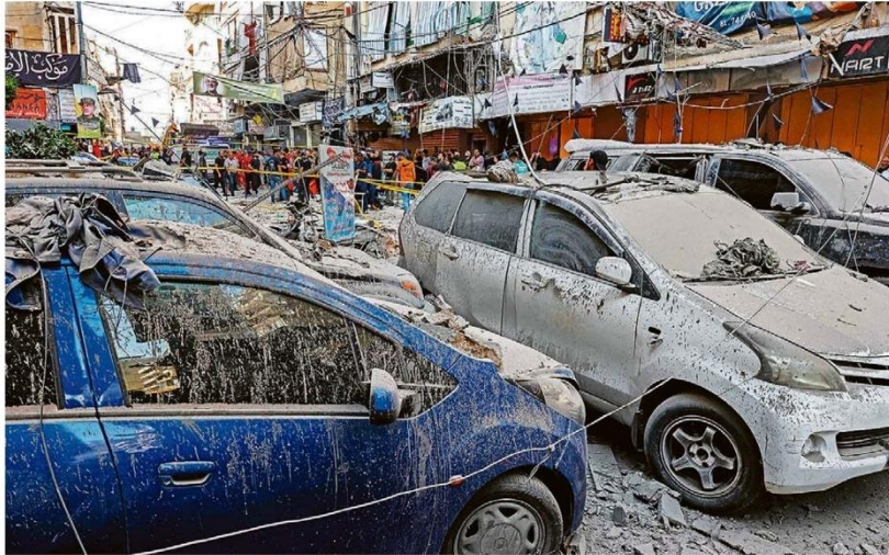
Bombardeio israelense em Ghobeiri, subúrbio no sul de Beirute, atingiu um prédio e arrasou veículos; mithares fugiram do sul do país

Quarta-feira 25 de SETEMBRO de 2024 • R$ 7,00 • Ano 145 • Nº 47825 estadão.com.br