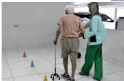
► PERIGO - Estimativa é que cerca de 60% das idosas com 80 anos ou mais sofrem quedas todos os anos. Especialistas alertam para cuidados. ► PÁGINA 10