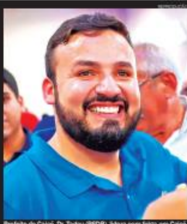
Prefeito de Caicó, Dr. Tadeu (PSDB), lidera com folga em Caicó

NATAL, SÁBADO DE DOMINGO, 21 e 22 DE SETEMBRO DE 2024 | EDIÇÃO Nº 1.921 | ANO 8 | 17.500 EXEMPLARES