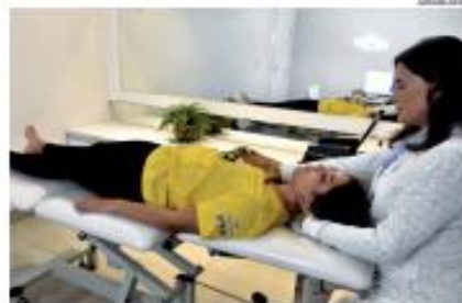
► SABER - A dor pode envolver uma experiência complexa entre mente e corpo. Emoções positivas, como a alegria, podem atuar como analgésico. ► PÁGINA 11