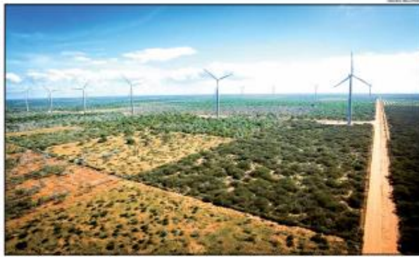
O impacto positivo registrado para o setor industrial deve ser impulsionado pelo PIB e pelo aquecimento da indústria e, principalmente, das energias renováveis.

Representantes do setor produtivo participaram de uma reunião com o governador Raulson Coutinho em Natal para discutir as perspectivas econômicas para o Estado. Com a presença de líderes empresariais e políticos, o encontro abordou os desafios e oportunidades do mercado interno e externo, além de discutir as prioridades para o desenvolvimento econômico do Rio Grande do Norte.