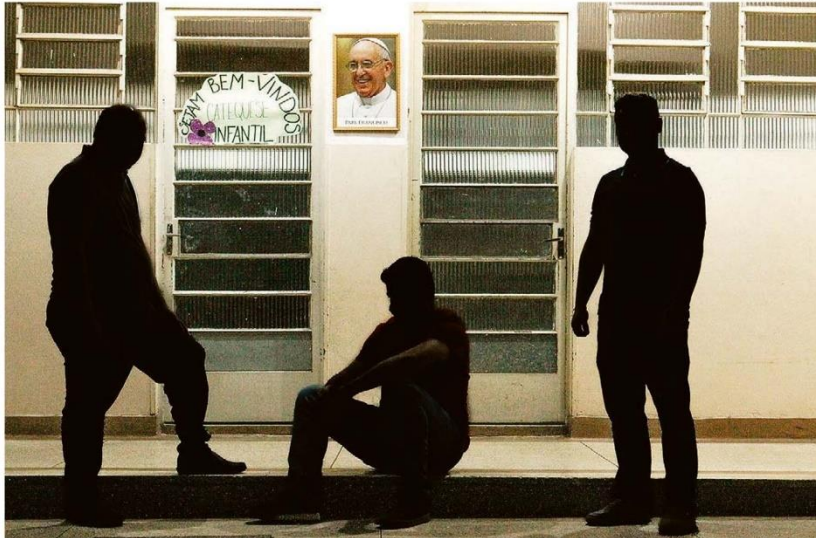
DANIEL FEDIERA / ESTADÃO