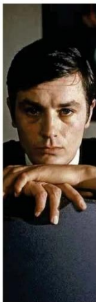
O ator Alain Delon em cena de "O Samurai", filme de 1967 de Jean-Pierre Melville A17

Parque Nacional do Cabo Orange, no AP, durante a maré baixa, onde começa o litoral brasileiro; Petrobras estuda explorar na Foz do Amazonas Ambiente B4 e B5