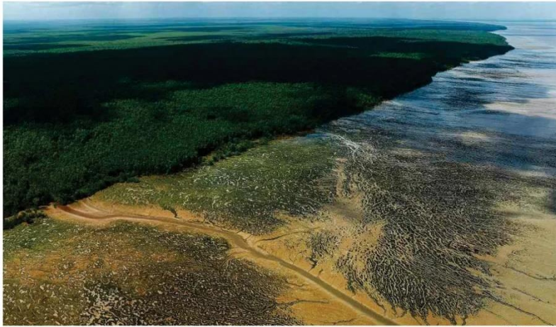
Lula de Almeida/Folhapress