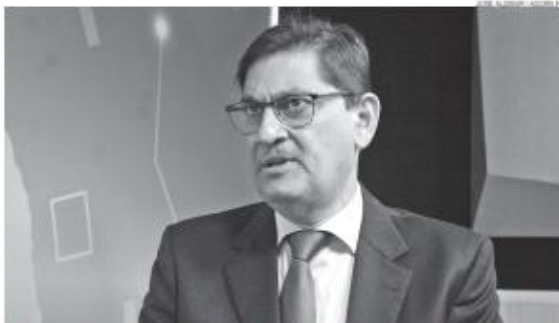
Secretário de Administração do Estado, Pedro Lopes, afirma que reduzir alíquota do imposto foi um erro, agora comprovado