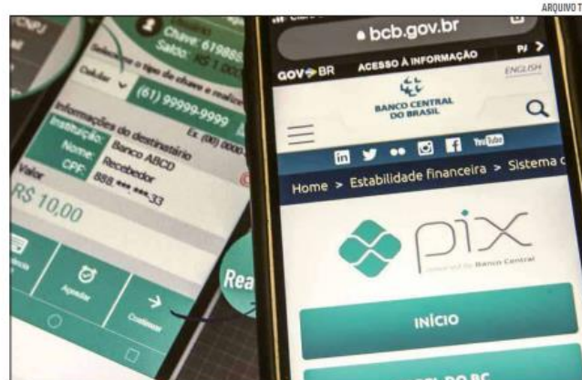
Em junho deste ano, o Pix movimentou R$ 2,2 trilhões, com um crescimento de 57% em um ano

Estudado pelo BC, o chamado Pix garantido ainda não tem prazo de lançamento, o que não impediu que bancos e fintechs começassem a oferecer produtos similares.