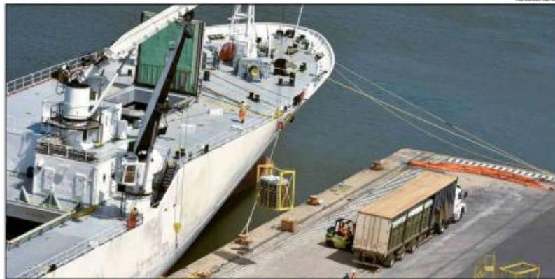
Frutas e nozes não oleaginosas somaram 14% das exportações e registraram alta de 1,17% com aumento nominal de US$ 888 mil

Também contribuíram para o saldo positivo das exportações potigüares: os açúcares e melações, que somaram 3,5% e tiveram um crescimento de 392% nos envios ao mercado externo, com US$ 15,5 milhões a mais; e as frutas e nozes não oleaginosas, que alcançaram 14% das exportações e registraram alta de 1,17%, representando aumento de US$ 888 mil. "Vejo isso [o crescimento das exportações] como positivo porque toda vez que se tem aumento da demanda pelos produtos que a