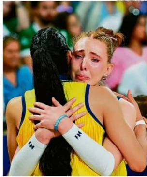
NATALY KATY ENRIQUETA/STREPTON