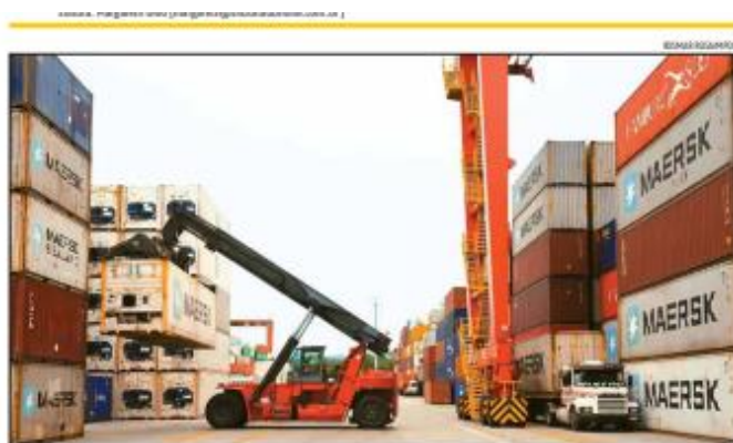
Exportações foram impulsionadas por itens do agronegócio - soja e café -, açúcares e carne bovina; e ainda minério de ferro e aço