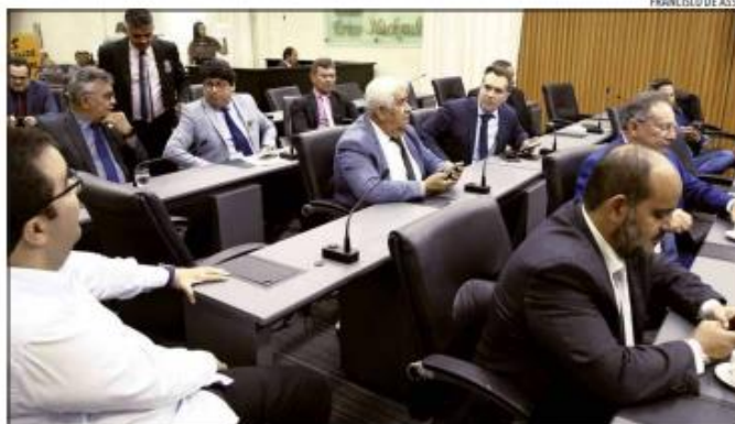
Vereadores debateram regime de urgência e a importância do projeto da prefeitura para a cidade

O PL 465/2024 dispõe sobre a autorização para a outorga de concessão do Complexo Turístico da Redinha por 25 anos, compreendendo uma área total de 16.580,60m 2 , que inclui o mercado público, deck do mercado, estacionamentos, estação de tratamento de esgotos (ETE), prédio anexo e áreas de circulação, excluindo a faixa de praia, igreja e ruas, ou seja, não se