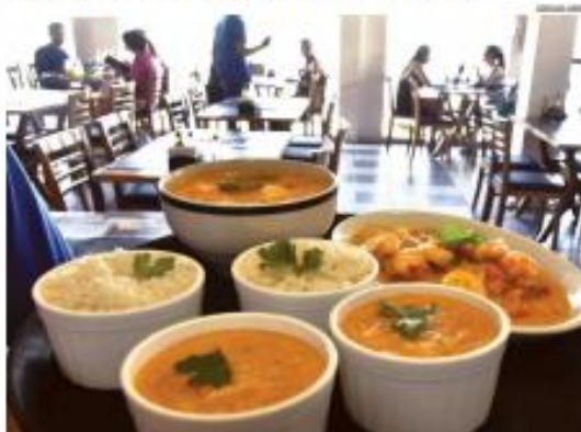
« MELÓCIOS » À véspera do Dia dos Pais, 81% dos restaurantes de RN vivem a expectativa de um aumento de faturamento para este domingo, quando será comemorado a data. « PÁGINA 6 »