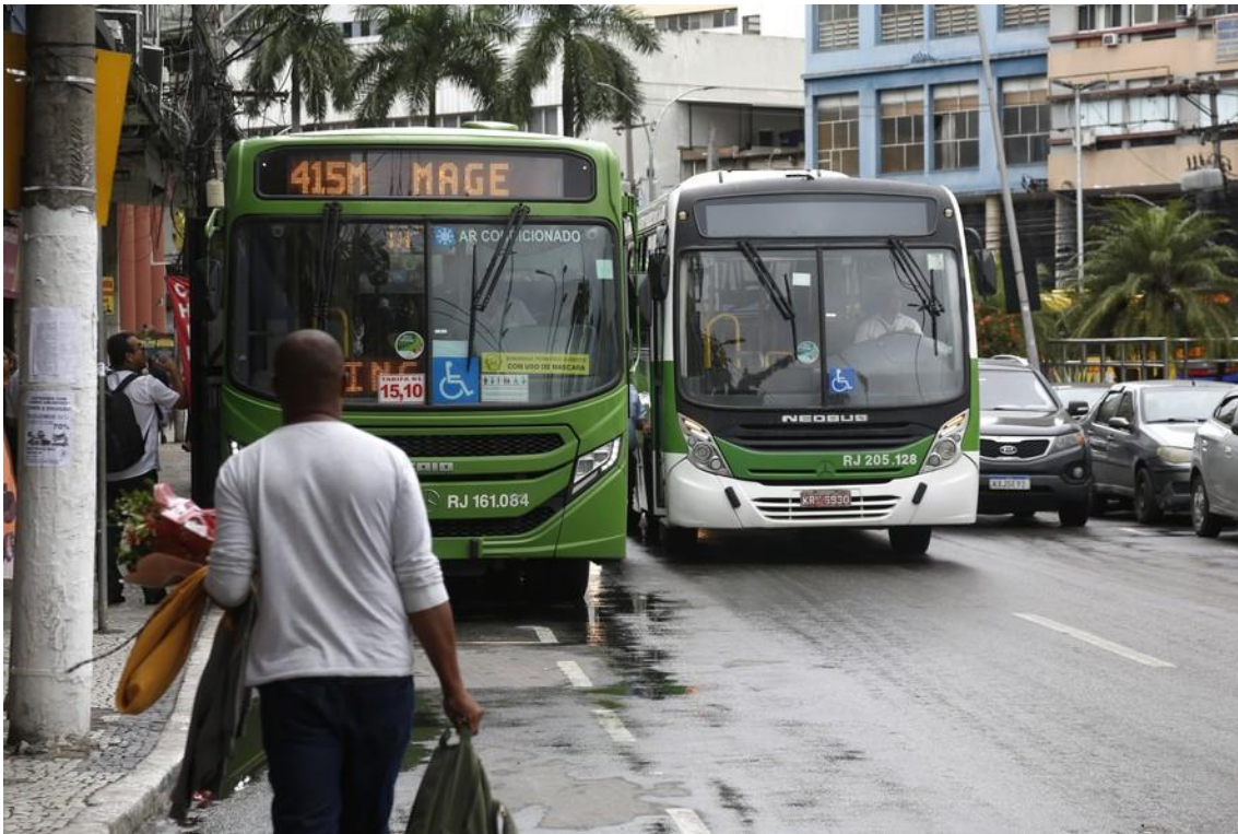
Ônibus perdeu espaço

O uso de transporte público no país perdeu espaço para a locomoção com veículo próprio ou por aplicativos, mostra a Pesquisa CNT de Mobilidade da População Urbana 2024, realizada pela Confederação Nacional de Transportes (CNT) com o apoio da Associação Nacional das Empresas de Transportes Urbanos (NTU). Os resultados revelam uma redução no uso do transporte coletivo e um aumento de preferência pelas viagens intermediadas por empresas como Uber e 99 em todas as classes sociais.