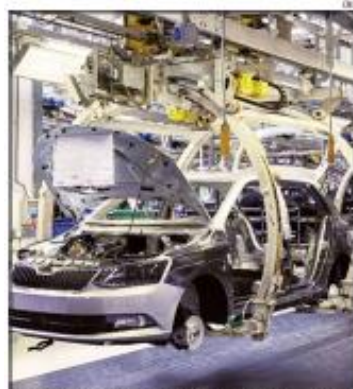
Montadoras acumulam aumento de 5,3% na produção em 2024

O balanço da Anfaavea mostra ainda que 545 vagas de trabalho foram criadas no mês passado nas montadoras, que empregam agora um total de 104.566 pessoas.