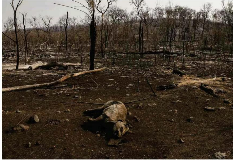
Anta carbonizada em mata da fazenda Santa Tereza, em Mato Grosso do Sul, que já havia sido devastada pelos incêndios de 2020 no pantanal.

VÔLEI DE PRAIA 16h Ana Patrícia/Duda x Mariafe/Cancy (AUS) semifinal