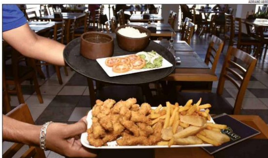
Próximo do Dia dos Pais, 81% dos restaurantes do RN vivem a expectativa de um aumento de faturamento para este domingo (11)