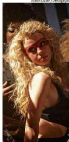
A atriz Mia Goth interpreta a protagonista Maxine

Júri da Folha testa buscadores de passagens e elege os melhores serviços