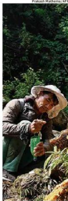
Coletor de mel no Nepal, onde trabalhadores relatam haver menos colmeias

Seleção colombiana venceu o Uruguai por 1 a 0. Na Eurocopa, a Inglaterra bateu a Holanda e vai disputar o título com a Espanha.