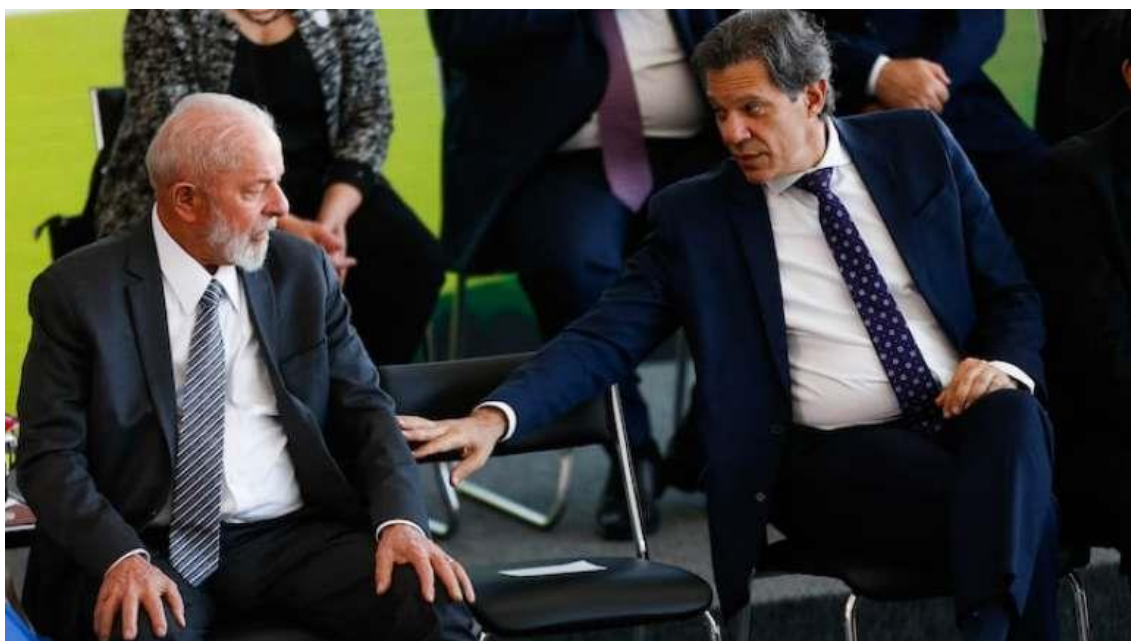
Lula e o ministro da Fazenda, Fernando Haddad

O instituto fez 2.000 entrevistas presenciais com eleitores de 16 anos ou mais entre os dias 5 e 8 de julho. A margem de erro é de dois pontos percentuais e o índice de confiança é de 95%.