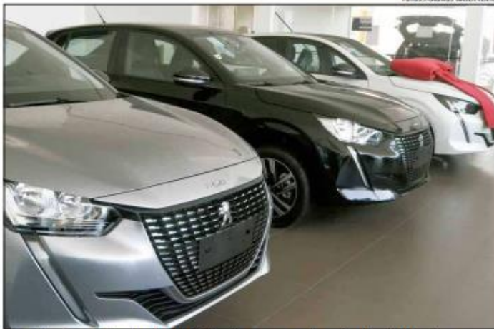
Venda de veículos deve ter alta de 16,7% este ano, segundo a estimativa da Fenabrave

venda de veículos de 16,7% para este ano. O índice estava previsto em 13,5% no início de 2024, mas foi revisto em junho passado. Esse dado se refere à soma, no Brasil, de emplacamentos de carros de passeio, utilitários leves, caminhões, ônibus, motocicletas e implementos rodoviários.