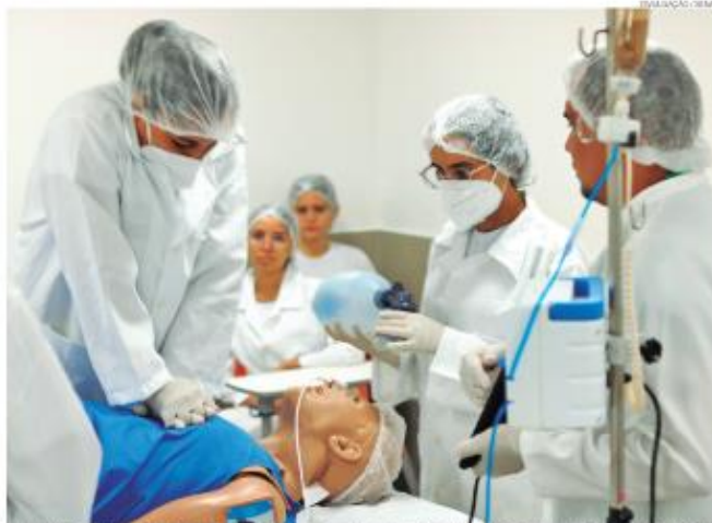
Senac RN é a única instituição de educação do estado dotada com manequim de alta tecnologia; curso oferta laboratório moderno

● Senac Centro Início das aulas: 15 de julho Carga horária: 1.600 horas ●