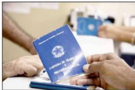
Saldo positivo de vagas formais no 5º mês de 2024 decorreu de 71,62% admissões e 16,80% demissões.