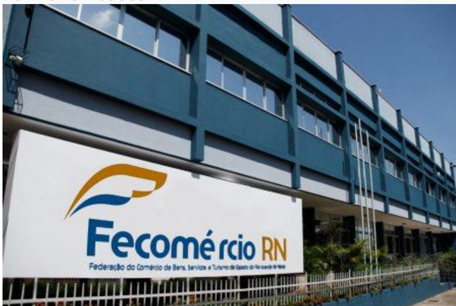
Fecomércio RN –