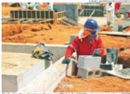
Redução da extrema pobreza no RN foi de 50,6% em comparação a 2021.

Programas sociais do governo federal combinados com ações do governo estadual tiraram mais de 300 mil pessoas do estágio mais grave de pobreza em apenas dois anos ...PÁGS. 8 e 9