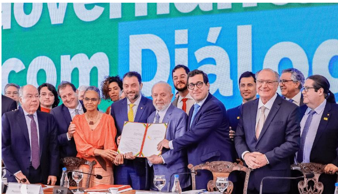
Lula sanciona taxação de compras internacionais de até US$ 50 e incentivo a veículos sustentáveis.(Imagem:

A medida foi incluída no Mover - Programa de Mobilidade Verde e Inovação que visa incentivar práticas sustentáveis no comércio de veículos no Brasil. O projeto também foi sancionado pelo presidente.