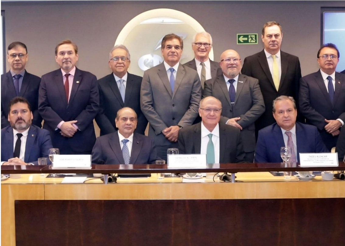
Geraldo Alckmin, José Roberto Tadros, Nadim Donato e outros representantes do setor de serviços no Brasil

Os ministérios do Desenvolvimento, Indústria, Comércio e Serviços (MDIC) e do Empreendedorismo da Microempresa e da Empresa de Pequeno Porte (MEMPP) assinaram um acordo de cooperação técnica com a Confederação de Comércio de Bens, Serviços e Turismo (CNC), nesta quarta-feira (26), em Brasília. O texto traz 23 ações para melhorar a competitividade das empresas do setor, com ações em áreas como fortalecimento do comércio eletrônico nacional, apoio a novas tecnologias e acesso a crédito.