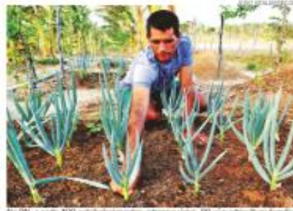
No RN, a cada 100 estabelecimentos agropecuários, 80 são agricultura familiar