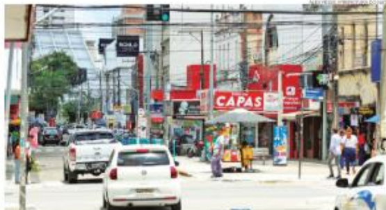
Melhorias de iluminação, limpeza e segurança, além da reformulação de espaços urbanos reforçam o papel de Cidade Alta

Ele acrescenta: "Vamos continuar trabalhando para que esse ciclo seja intensificado, possa ser per-