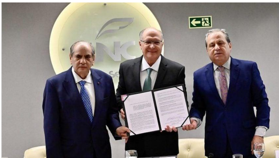
Na foto, o presidente da CNC, José Tadros (à dir.), o vice-governador e ministro do do Desenvolvimento, Indústria e Comércio, Geraldo Alckmin (centro), e o secretário executivo do MEMP, Francisco Tadeu de Alencar (à esq) durante a assinatura do acordo

Termo inclui os ministérios do Desenvolvimento, Indústria, Comércio e Serviços e do Empreendedorismo; estima ações ao longo de 3 anos