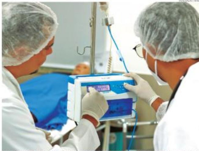
Alunos são capacitados para atuar em diferentes níveis de atenção à saúde, incluindo último certificado reconhecido em todo o Brasil