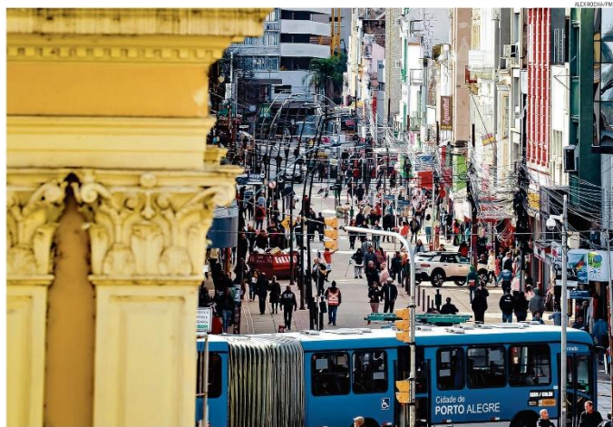
Volta à normalidade. Aos poucos, o Centro Histórico de Porto Alegre recupera seu movimento, depois de ter diversas ruas inundadas pela cheia do Guaíba