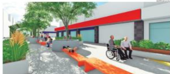
Rua João Pessoa recebe projeto de requalificação: setor do comércio recorde no faturamento das águas

O presidente do Viva o Centro informou ainda que as projeções para a sequência do ano são bem positivas, com a chegada de um shopping center onde antes funcionava as Lojas Americanas na avenida Rio Branco, bem como a instalação de uma unidade de ensino na parte superior do mesmo pr-