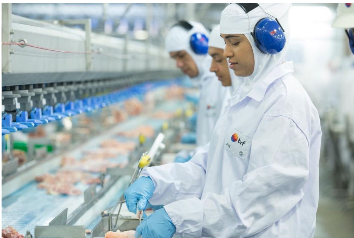
Trabalhadores em fábrica da BRF

Segmento de produtos alimentícios gerou 22,5% da receita de vendas e 22,8% dos empregos no ano; indústria perdeu 745,5 mil empregos em uma década