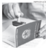
Empregos gerados no mercado formal

O número acumulado, porém, é menor do que o de 2022, quando foram gerados 1,18 milhão de empregos e do que em 2021, quando o montante foi de 1,162 milhão de novos postos.