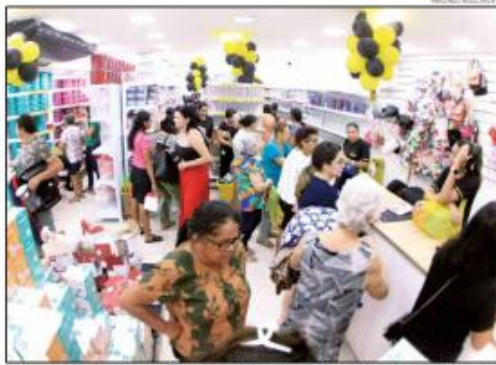
Consumo em Natal será responsável por 32,9% dos valores movimentados no Rio Grande do Norte

Embora o IPC Maps aponte crescimento de 6% no Estado, a capital tem previsão de queda de 4,3%, com menos dinheiro disponível em 2024 em comparação com o ano passado. Segundo o levantamento, os consumidores natalenses movimentarão R$ 30,1 bilhões neste ano, enquanto em 2023 o montante chegou a R$ 31,5 bilhões em diversos setores de consumo. A capital terá responsável por 32,9% dos valores movimentados no Rio Grande do Norte. Paranaíba (11,4%), Mossoró (8,9%), São Gonçalo do Amarante (3,1%) e Caicó (2%) são os outros municípios que mais contribuem para o consumo no Estado.