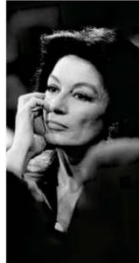
A atriz em programa de TV em 1984.

O presidente da Câmara, Arthur Lira (PP-AL), afirmou ontem que vai criar uma "comissão representativa" para analisar o PL Antiaborto por Estupro. A ideia é que o grupo atue no segundo semestre, "sem pressa e sem qualquer tipo de apadamento", segundo ele. A decisão ocorre após pressão contra o texto, que iguala a pena por aborto à de homicídio. Saúde B1