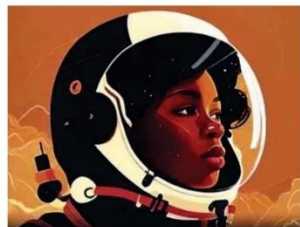
Ilustração da Agência Espacial Brasileira homenageia a primeira astronauta; pioneira era russa e branca.

Cotidiano B4 Ricardo Castilho, jornalista referência em gastronomia, morre aos 59 anos