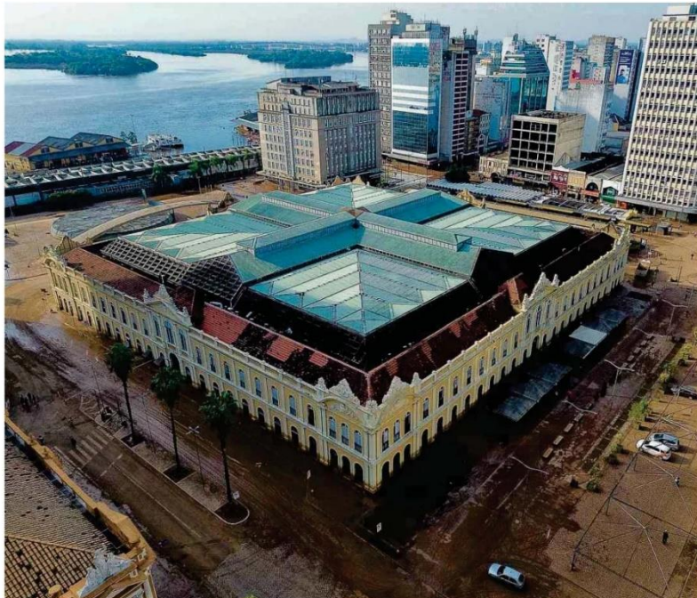
Centro histórico de Porto Alegre após as águas do lago Guaíba baixarem; equipes da prefeitura e comerciantes fazem a limpeza da região.

"A Terra é redonda o tempo todo", disse o ministro da Fazenda depois de ser chamado de negociacionista pelo deputado Abílio Brunini (PL-MT) em comissão na Câmara. Em sua fala inicial, Brunini havia contestado o panorama da economia apresentado aos deputados por Haddad. Depois, o parlamentar disse que não fez referência ao fato de o planeta ser plano ou redondo. Mercado p.1