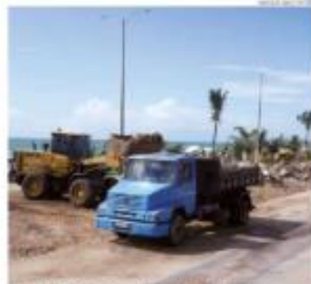
« NOVA OBRA » A Prefeitura de Natal deu início às obras de revitalização da orla, a partir da Praia do Forte, que segue do local foram demolidas para construção de novas estruturas. « PÁGINA 6 »