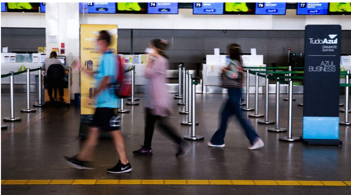
Ministro diz que Voa Brasil está em fase de ajuste final

Segundo Silvio Costa Filho, iniciativa está nos ajustes finais e foi adiada pelas enchentes no Rio Grande do Sul