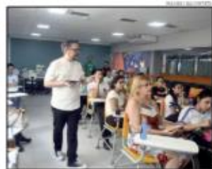
Fórum debate carreira, empregabilidade e educação corporativa

A programação completa do Fórum de Carreiras pode ser consultada no site www.rn.sescn.br .