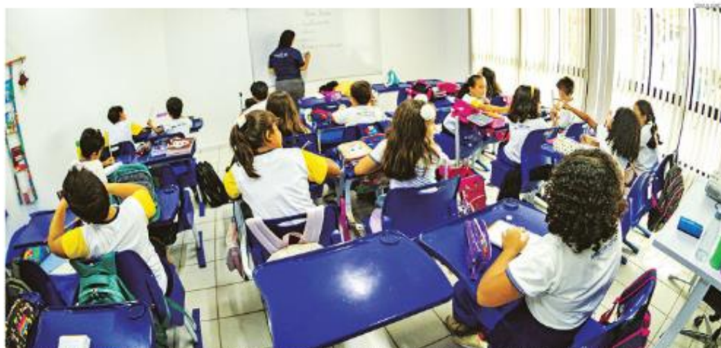
Escola, com programação diferenciada e diversificada, é uma oportunidade única para educadores explorarem práticas inovadoras e alinhadas com as demandas contemporâneas da educação no país.