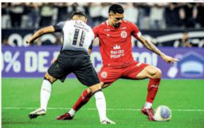
« COPA DO BRASIL » Só os extras individuais acabaram resultando na derrota do América por 2 a 1 para o Corinthians, ontem (20), na Neo Química Arena. Resultado oficial a Alvinegro, que fez um grande jogo. Time português se concentra agora na Série B. « PÁGINA 10 »

« DECISÃO » A Câmara dos Deputados aprovou, por 396 votos a 120, projeto que estabelece restrições e impedimentos para invasores de propriedades rurais e prédios públicos. Pela proposta, quem praticar esse tipo de crime fica proibido de participar do programa de reforma agrária, contratar com o poder público, receber benefícios ou incentivos fiscais e ser beneficiário do Minha Casa Minha Vida. « PÁGINA 4 »