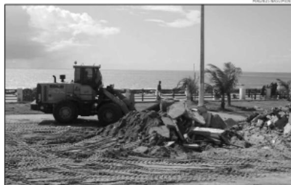
As obras na orla da zona Leste estão previstas para serem concluídas em dezembro de 2024