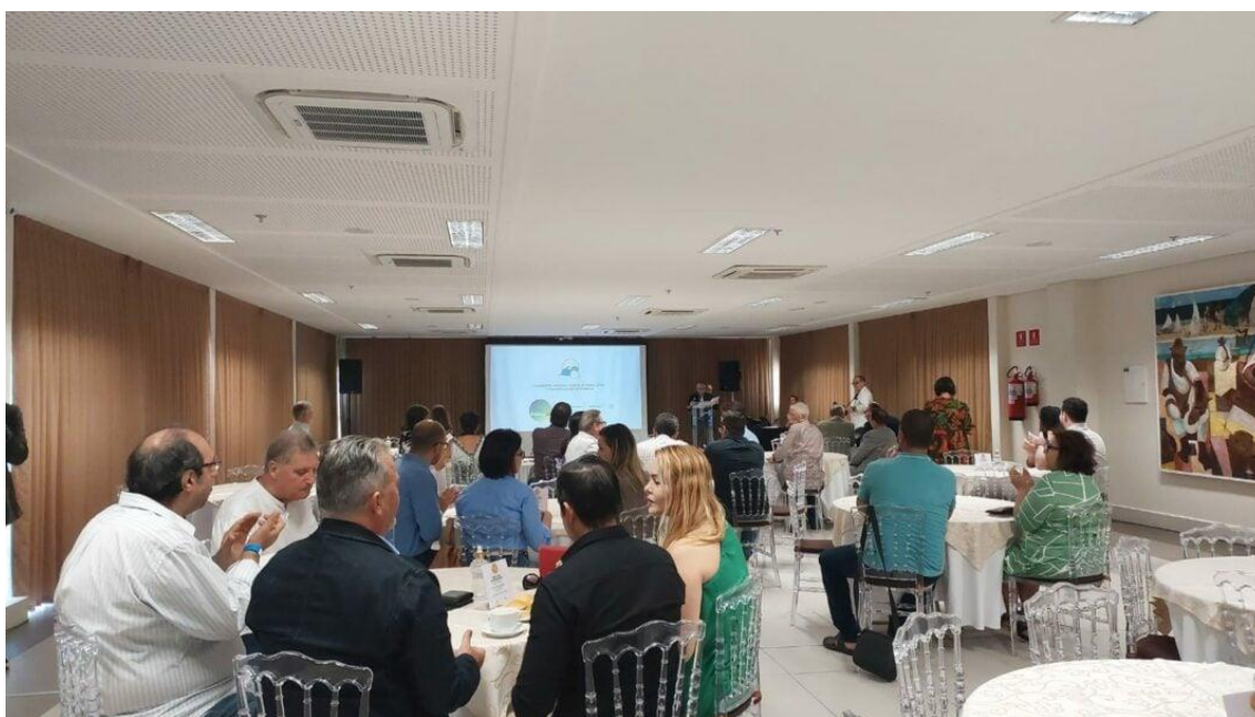
Evento de lançamento da Febtur, no Sesc da Rio Branco.

A colaboração entre turismo e jornalismo é essencial para fortalecer e desenvolver a economia e cultura do Estado. É neste sentido que o Rio Grande do Norte será sede do I Encontro Nacional da Federação Brasileira de Jornalistas e Comunicadores de Turismo (Febtur). Nesta manhã de terça-