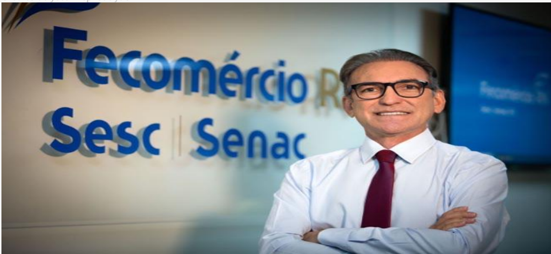
Marcelo Queiroz, presidente da Fecomércio do RN

A Federação do Comércio de Bens, Serviços e Turismo do Rio Grande do Norte (Fecomércio RN) será homenageada pelos 75 anos de fundação na Assembleia Legislativa, na sexta-feira (24), às 10h, no Plenário Deputado Clóvis Motta.