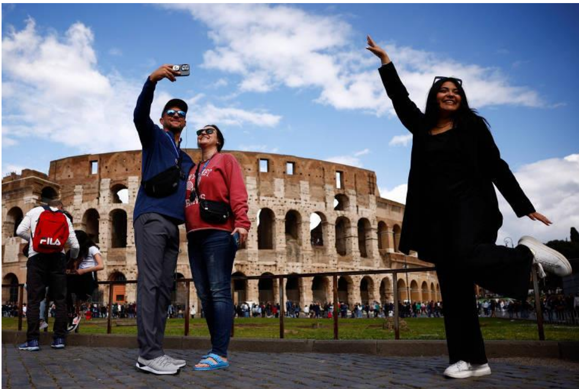
Turistas posam em frente ao Coliseu, em Roma, em abril de 2024

Economias de alta renda, em especial na Europa e na região do Pacífico, ainda mantêm as condições mais favoráveis para o desenvolvimento do turismo, mostram os dados. Não à toa, são 26 das 30 mais bem posicionadas da lista.