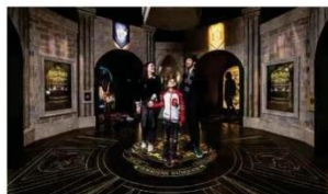
Ambiente da exposição, atualmente em Nova York.