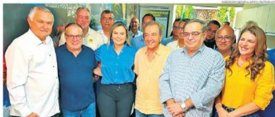
REDAÇÃO GERAL: SÉRGIO PORTUGAL/AGORA

Grupo teria executado a fêmea em segurança e um policial militar dentro de um supermercado de Ielmo Maranhão em janeiro.