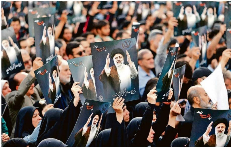
Iranianos lamentam morte de presidente no centro de Teerã; helicóptero com Ebrahim Raisi, seu chanceler e mais 7 ocupantes caiu domingo

Eleição em 28 de junho definirá quem presidirá país no lugar de Raisi; ele era um potencial substituto do líder supremo, Ali Khamenei