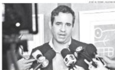
Secretário de Fazenda do RN, Carlos Eduardo Xavier, comenta arrecadação

Com a redução da alíquota de 20% para 18%, o Governo do Estado se prepara para enfrentar um ano desafiador, conforme o secretário. "É no primeiro trimestre, vimos o crescimento cair quase pela metade mesmo em um contexto de comparação do comportamento da arrecadação com a mesma alíquota estipulada em