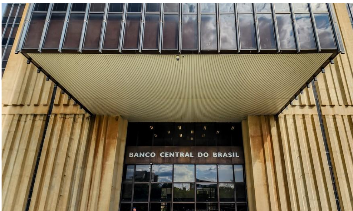
Sede do Banco Central