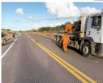
Rodovia federal foi liberada parcialmente no sistema para e siga