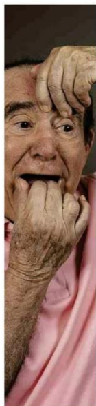
Renato Aragão, em entrevista: "A vida precisa de humor"