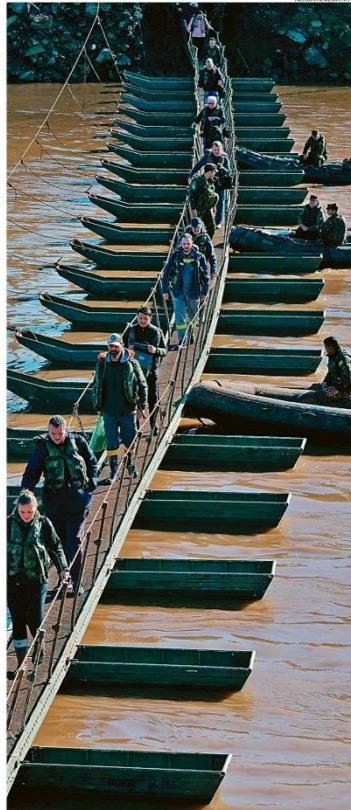
SOS Reconectados: O Exército liberou ontem a passarela flutuante que voltou a ligar os municípios de Lajeado e Arroio do Meio, no Vale do Taquari, após a destruição da ponte na RS-130

EDITORIAL MUDANÇA DE COMANDO TRAZ VOLTA AO PASSADO PÁGINA 2 MALU GASPAR Já vimos este filme na Petrobras, e não deu certo PÁGINA 3 PAULO CELSO PEREIRA Tragédia gaúcha revela diálogo de surdos no país PÁGINA 2 MÍRIAM LEITÃO Governo acerta no Auxílio, mas erra tom no Sul PÁGINA 16