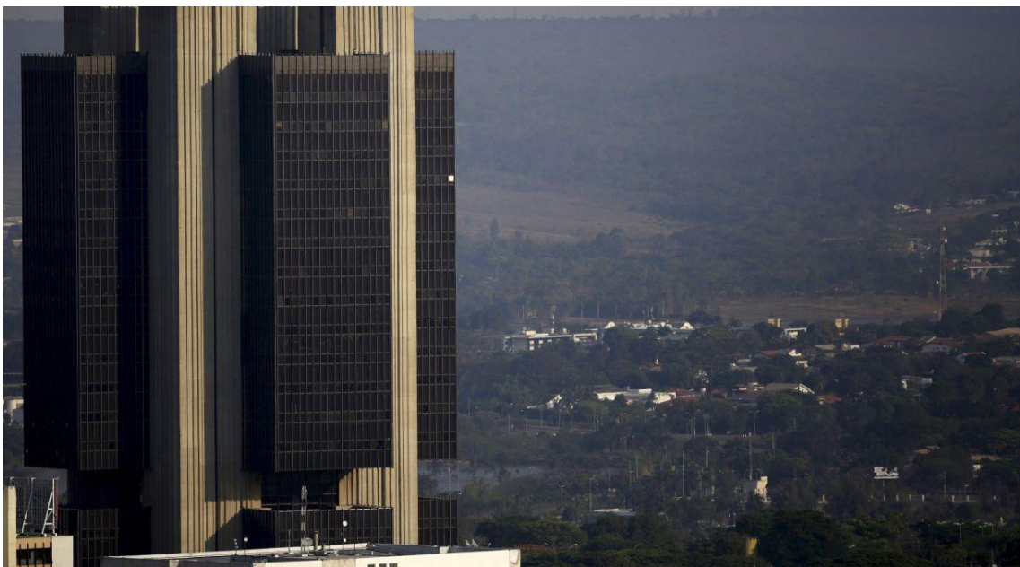
Sede do Banco Central em Brasília 23/09/2015

Resultado mensal foi pior do que a expectativa em pesquisa da Reuters de uma queda de 0,25% no mês