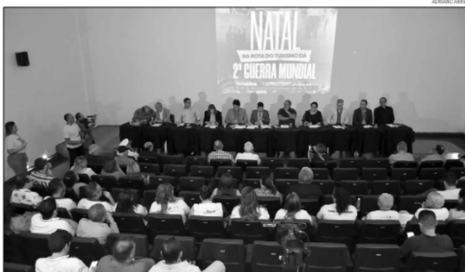
As discussões ocorreram no Complexo da Rampa, às margens do rio Potengi, símbolo da participação potiguar na guerra