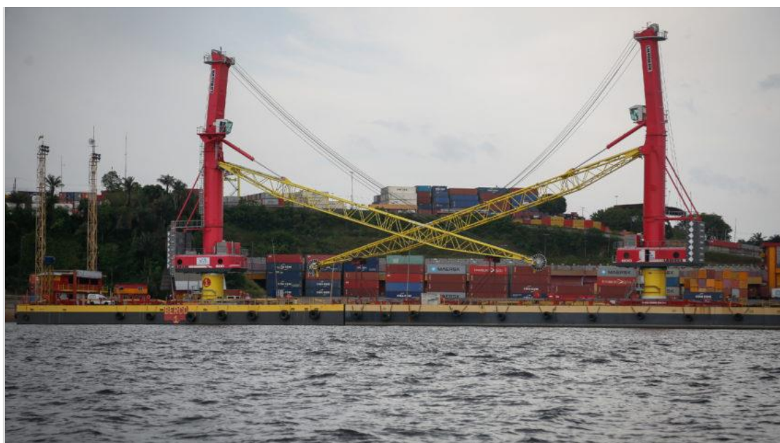
Na imagem, o Porto de Manaus

Alta registrada é em comparação com o 4º trimestre de 2023; em março, economia retraiu 0,34%