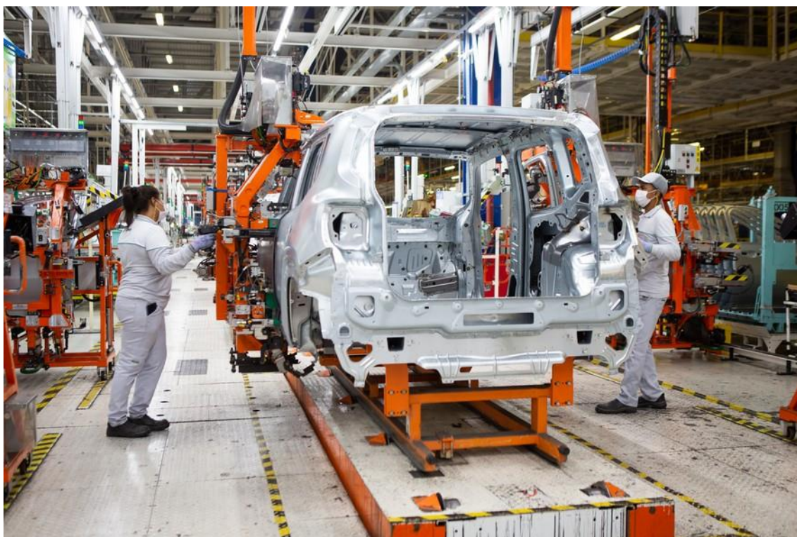
Indicadores Indústria. Linha de Montagem - Setor de Funilaria da Stellantis. fabrica de carro em Pernambuco

O Índice de Atividade Econômica do Banco Central (IBC-Br) caiu 0,34% em março, na comparação dessazonalizada com fevereiro, conforme divulgado nesta quarta-feira pela autoridade monetária. Em