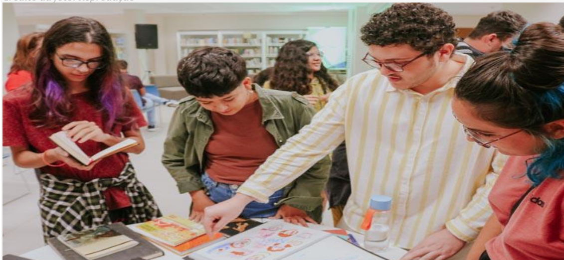
Evento voltado para a comunidade nerd e geek

Natal, Mossoró e Caicó se preparam para receber um evento voltado para a comunidade nerd e geek do estado. O Sesc RN apresenta a "Invasão Geek", parte do projeto Ação Sesc Literatura, que promete atividades relacionadas ao universo da cultura pop. Os participantes terão a oportunidade de se aventurar em um mundo recheado de videogames, cosplays, oficinas, jogos de tabuleiro e de RPG, apresentações de K-pop, debates sobre quadrinhos e mangás, e muito mais.