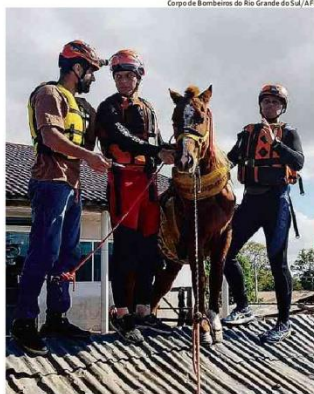
Em Canoas (RS), bombeiros e veterinários com cavalo ilhado (à esq.), que foi sedado antes de ser resgatado em um bote (centro e à dir.); animal foi levado a hospital veterinário

O governo ainda terá de apresentar medida compensatória para bancar a desoneração, exigência da Lei de Responsabilidade Fiscal e motivo de a gestão Lula ter recorrido ao Supremo anteriormente. O custo do benefício fiscal em 12 meses, de acordo com Haddad, será de R$ 10 bilhões. Mercado p.1