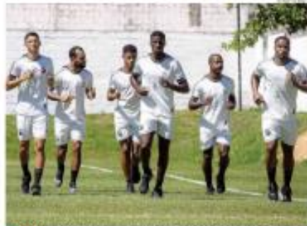
« ICBIC C » O ABC já registrou uma grande invencibilidade em casa. Time tenta revisar esses momentos, neste sábado (11), contra o Londrina/PE. « PÁGINA 12 »