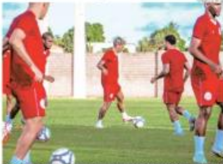
« ICBIC D » Na temporada, o América perdeu apenas dois jogos fora. Neste sábado (11), contra o Santa, no Barretão, time quer manter os bons números. « PÁGINA 12 »