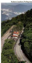
Parque Estadual Caminhos do Mar, em São Paulo, uma das sugestões de passeio