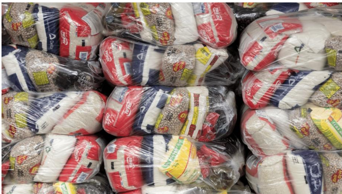
Cesta Básica

Representantes do Sistema Fecomércio RN, Governo do Estado, Corpo de Bombeiros e Correios acompanharão o embarque de 7.000 quilos de gêneros alimentícios nos caminhões, que seguirão para o Centro de Distribuição dos Correios, em Natal/RN, antes de partirem para o Sul do país .