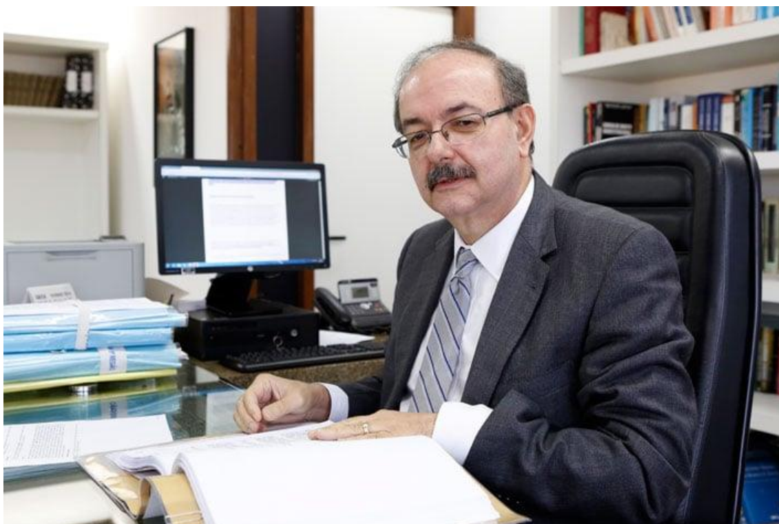
Des. Manoel Erhardt: cobrança gera insegurança jurídica por alterar sistemática já estabelecida