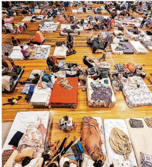
Desabrigados dormem em centro esportivo em Porto Alegre; entre eles, mães que reencontraram os filhos

Não é hora de achar culpado, diz o culpado