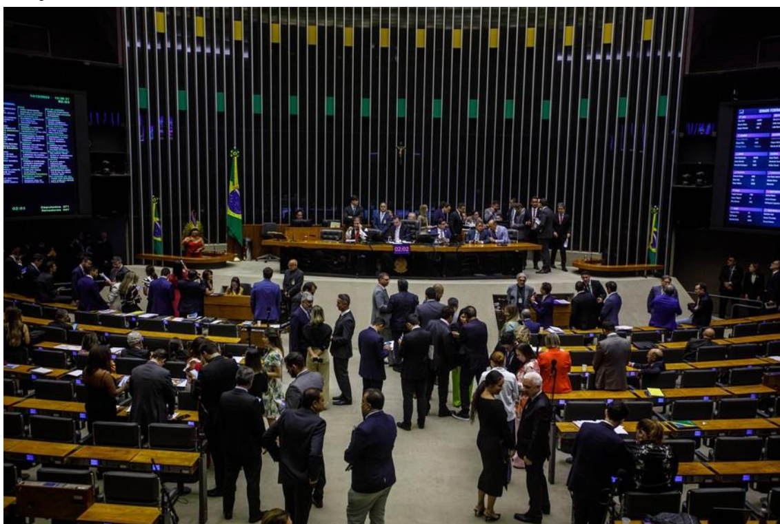
Plenário do Congresso Nacional vota vetos presidenciais

Governo chegou a recuar e publicar portaria no mesmo sentido, mas lei tem mais força jurídica