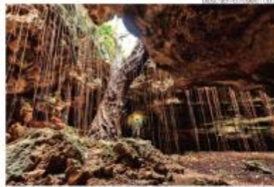
Município de Felipe Guerra concentra a maior quantidade de cavernas em terras potiguares