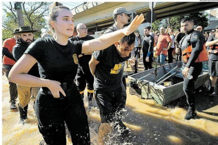
Policial conduz suspeito de ter furtado residência; há relatos de voluntários que tiveram barcos roubados por ladrões para praticar saques

Terça-feira 7 de MAIO de 2024 • R$ 7,00 • Ano 145 • Nº 4784 estado.com.br