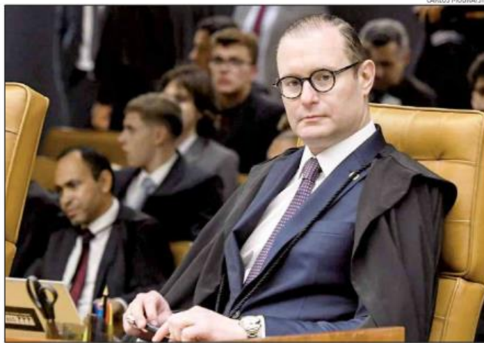
Liminar do ministro Cristiano Zanin suspendeu a desoneração da folha de 17 setores e dos municípios

Se a liminar dada pelo ministro Cristiano Zanin suspendendo a desoneração da folha de pagamentos de 17 setores da economia, continuar valendo