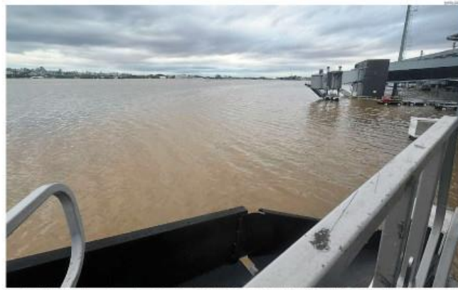
Inaceessível. Compietas submersas e água na altura do fogão, o Aeroporto Salgado Filho, na capital gaúcha, ficou fechado até o fim do mês. Área inferior também está alagada

Aeroporto da capital ficará fechado por até 25 dias, e há 42 estradas bloqueadas no estado, que tem 85 mortes confirmadas