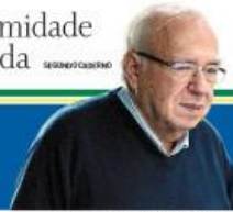
7 DE MARÇO DE 2024. ANO XXXI - Nº 3.346 - PREÇO DESTE EXEMPLAR R$ 85,00