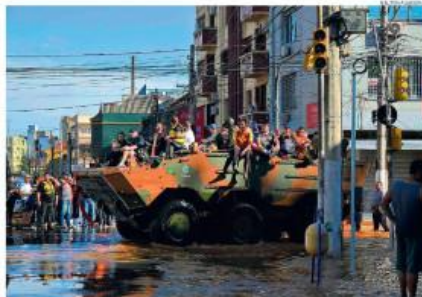
Força-tarefa. Auxílio online ajuda no resgate de vítimas da enchente em Porto Alegre. Há risco de novas chuvas fortes

A inundação de Porto Alegre avançou ontem, com mais dois bairros tomados pela enchente provocada pela elevação recorde do Rio Guaíba e pelo desligamento de 19 das 23 bombas de escoamento. Cerca de 85% da capital está com o fornecimento de água cortado, pois apenas uma das seis estações de tratamento funciona. O município decretou racionamento, e moradores permanecem horas em filas nas bicas públicas para encher vasilhames. Supermercados estão sem estoque, e quem tem pouco em casa está abastecendo portadoras vizinhas. Em algumas regiões do estado, mais de 25% dos moradores estão sem eletricidade. E o bloqueio de 42 estradas dificulta a chegada de suprimentos. As pistas do Aeroporto Salgado Filho viraram um rio, e o terminal está alagado. Há 85 mortos e 134 desaparecidos no estado. Uma frente fria se aproxima do território gaúcho, com risco de chuvas torrenciais e tornando mais lento o escoamento do Guaíba. A Câmara aprovou o leito de calandula pública no Rio Grande do Sul, para agilizar a liberação de verbas, que ficaram fora da meta fiscal. REPORTAGEM