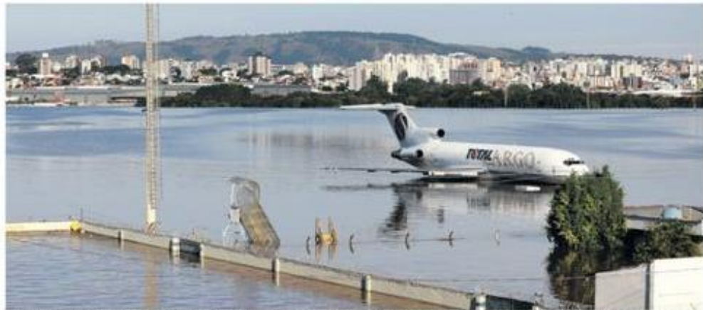
Avião na pista alagada do aeroporto Salgado Filho, em Porto Alegre, sem previsão para reabertura; companhias aéreas suspenderam operações até o dia 30 deste mês.

Agências dos Correios recebem doações para vítimas das cheias B1