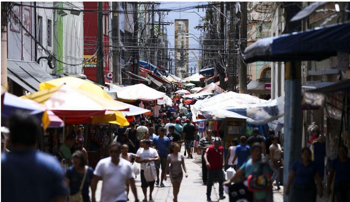
Brasileiros vão às compras

Realizada entre os dias 17 e 22 de abril, a sondagem ouviu 2 mil pessoas nas cinco regiões do país