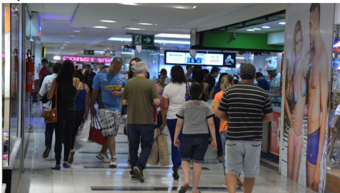
Pessoas caminham por shopping, em Brasília

Levantamento feito pela Febraban demonstra otimismo dos brasileiros até o fim do ano; 56% apostam em melhora em 2024