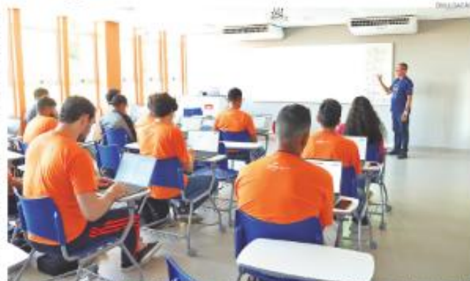
Processo psicopedagógico do Senac RN utiliza ferramentas da Microsoft visando redução de barreiras à aprendizagem