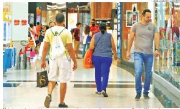
Mais da metade dos natalenses pretende ir aos shoppings para fazer compras para o Dia das Mães neste ano

Celebrado neste ano em 12 de maio, o Dia das Mães é a segunda data comemorativa mais aguardada pelo comércio varejista, atrás apenas dos festejos natalinos