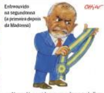
Entravado na segunda-feira (a promessa depois da Madonna). — Vamos lá, querida, vamos voltar a trabalhar... SEMANA 10

Ainda não há data para a reabertura do principal acesso entre Paracambi e Engenheiro Paulo de Frontin, fechado após chuvas. O impacto para os moradores é intenso. PÁGINA 28