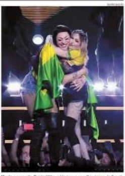
Vende e amarela. Pabllo Vittar e Madonna com Bandeiras do Brasil. SEMANA 10

Apresentação de Madonna que reuniu 1,6 milhão de fãs em Copacabana ecoou na mídia global, principalmente por atrações especiais presentes no Rio. Houve participação das cantoras Anitta e Pabllo Vittar, escola de samba infantil e adereços com as cores do Brasil. O prefeito carioca, Eduardo Paes, acenou com a possibilidade de mais megashows em maio, "mês de celebração a mais incrível de todas as cidades". SEMANA 10