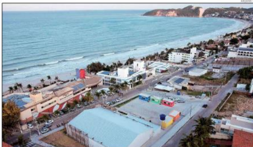
A temporada 2023/2024 teve um dos maiores movimentos do setor turístico. Foi uma boa alta estação para um segmento em recuperação

O diretor de Inovação e Competitividade da Federação do Comércio de Bens, Serviços e Turismo (Fecomércio RN) explica que o levantamento da última alta estação no Estado deve ser consolidado nas próximas