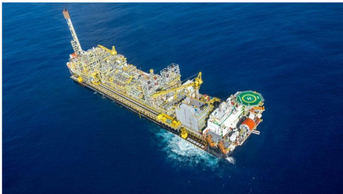
FPSO P-69, que produz petróleo e gás natural para a Petrobras no campo de Tupi, no pré-sal da Bacia de Santos

Maior parte do incremento na produção é reinjetada nos poços pela falta de infraestrutura de escoamento; prática cresceu 585% desde 2010