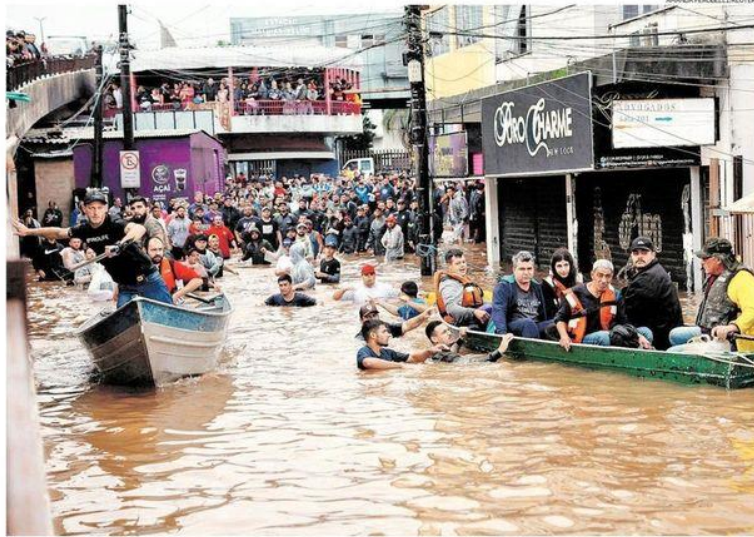
Moradores de Canoas, na região metropolitana de Porto Alegre, são resgatados em barcos; baixa do nível da enchente deve ser lenta

Segunda-feira 8 de MAIO de 2024 • R$ 7,00 • Ano 145 • Nº 47683 estado.com.br