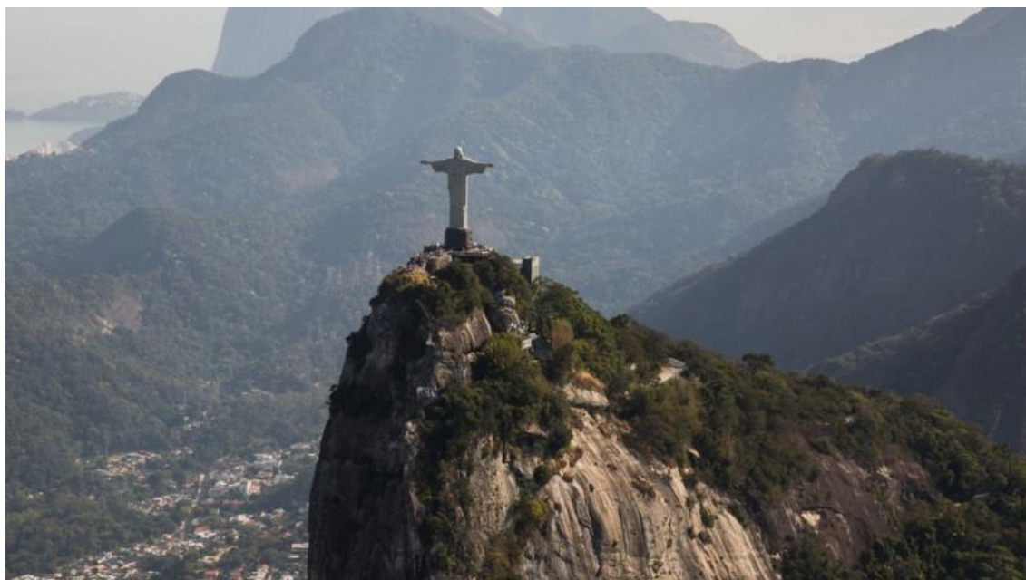
Rio de Janeiro, Cristo Redentor

Valor injetado no País por turistas chegou à marca de R$ 162,2 bilhões. Panorama do Turismo também revela alta de contratações — com setor de bares e restaurantes como maior empregador