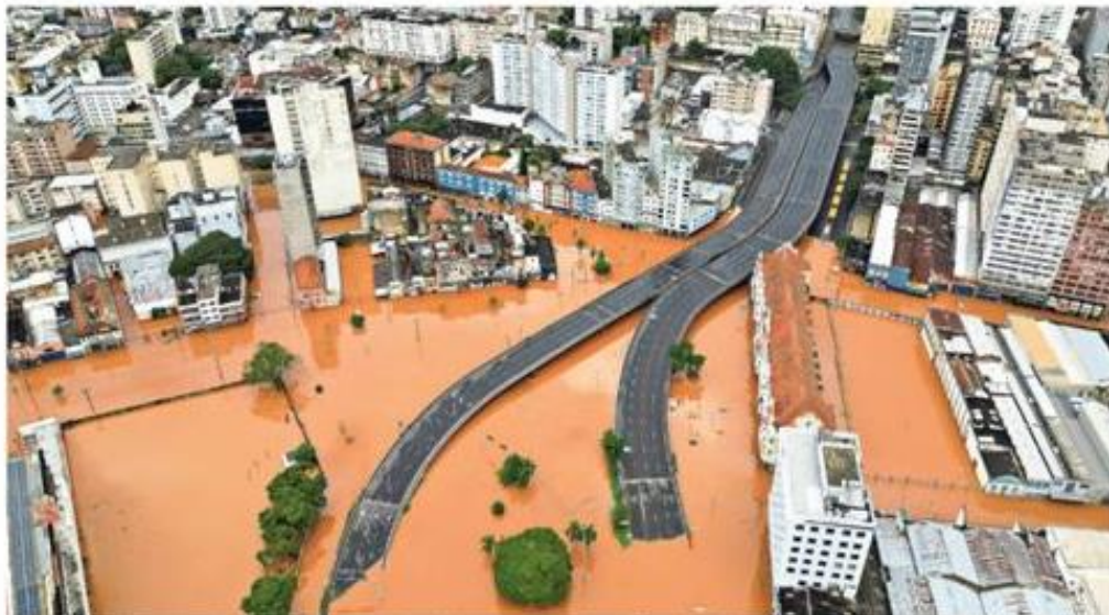
Foto feita por drone mostra centro de Porto Alegre alagado em decorrência das fortes chuvas que atingem a região, na pior tragédia climática já observada no Rio Grande do Sul.