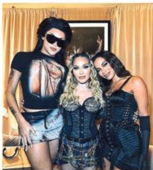
Madonna entre Pablo Vittar (esq.) e Anitta, com as quais dividiu palco em show para 1,6 milhão de pessoas no Rio no sábado (4); as três estiveram em festa de Luciano Huck.

Os resultados dos estudantes paulistas ao final do ensino fundamental, independentemente da carga horária, ficam abaixo do nível considerado adequado no Saesp. Os que estão em tempo integral, porém, chegam mais perto da pontuação mínima ideal. Carolina R.