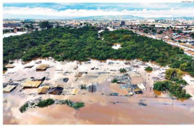
Submerso. A imagem aérea mostra parte do bairro de Navegantes, em Porto Alegre, completamente inundada pela água. O estado vive o caos com problemas de abastecimento.

Érika Marinho (1876-1925) — (1904-2005) Roberto Marinho