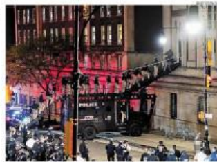
Apesar da repressão, a polícia reprimiu manifestantes da universidade em Nova York (foto), mas os protestos pró-Gaza recrudesceram na UCLA. FIGUEIRA 10