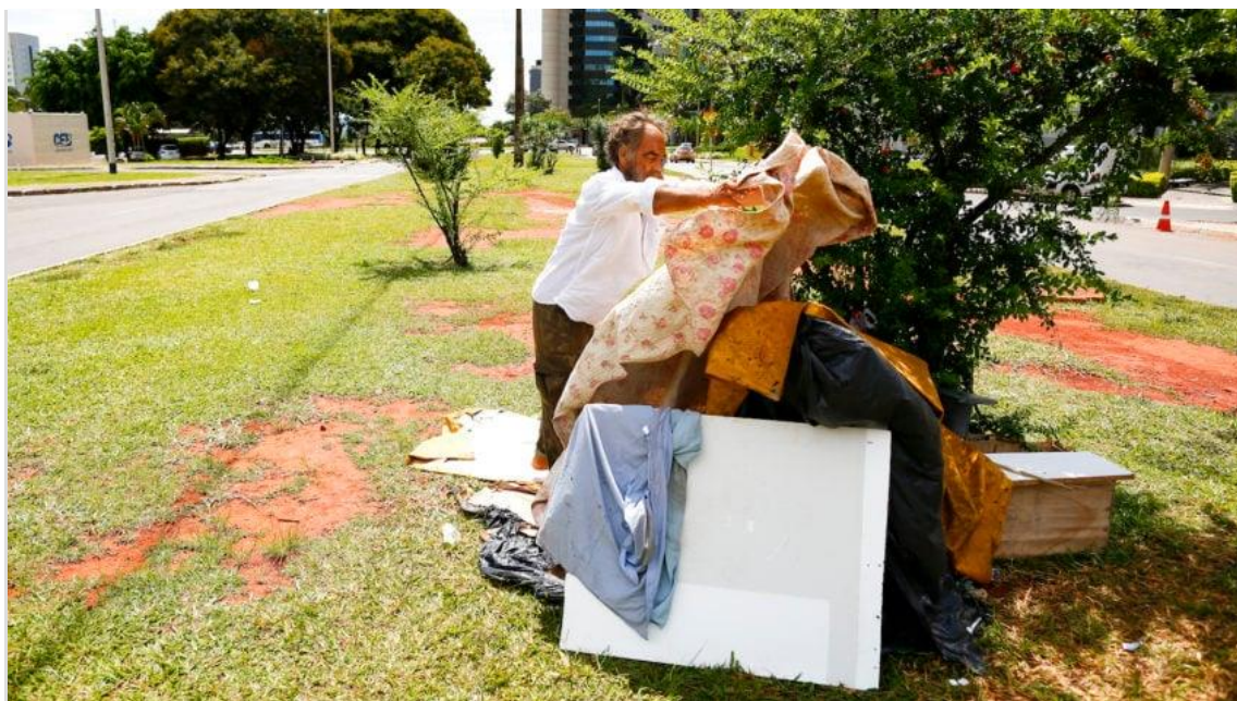
Na foto, pessoa em situação de rua arruma roupas e papelões no local onde dorme; em área central de Brasília

Registrou o menor patamar para o período desde 2014; Índice aumentou 0,5 ponto percentual em comparação com o 4º trimestre de 2023