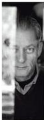
O escritor, em retrato de 2009. Truismos: The New York Times