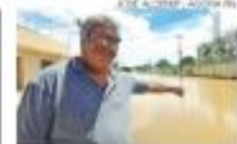
Chuvas ...PÁG. 7

no complexo penitenciário. Eles tinham histórico de bom comportamento. A fuga ocorreu por volta de 12h. Durante suas atividades dentro da penitenciária, os detentos aproveitaram a falta de vigilância dos agentes penitenciários e conseguiram escapar.