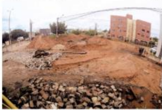
« TRANSPORTES » Motoristas e moradores reclamam de trecho esburacado na Avenida Ayrton Senna, em Nidópolis. Segundo a Secretaria de Infraestrutura, reparos vão levar mais 20 dias. «PÁGINA 6»