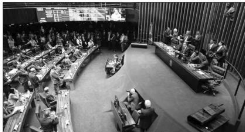
Caso a relatora tivesse incluído a correção, o PL teria que voltar à Câmara para análise dos deputados