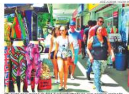
RN conta com massa de 504,7 mil trabalhadores com carteira assinada

O Mapa do Emprego mostra ainda que Natal teve o maior volume das vagas criadas. Foram 1.591 frentes de trabalho abertas. Em seguida, Mossoró, com 1.176 empregos criados, e Par-