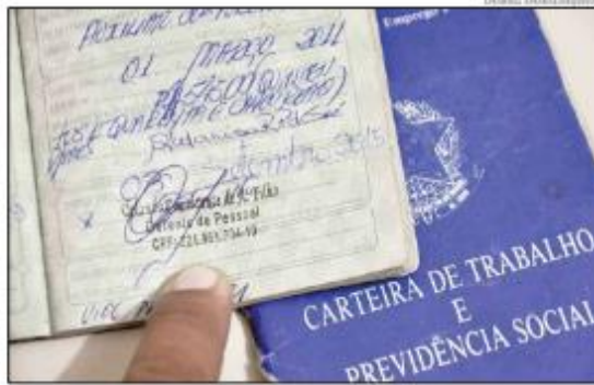
Número de ocupados ficou 782 mil (-0,8%) menor em comparação com último trimestre de 2023