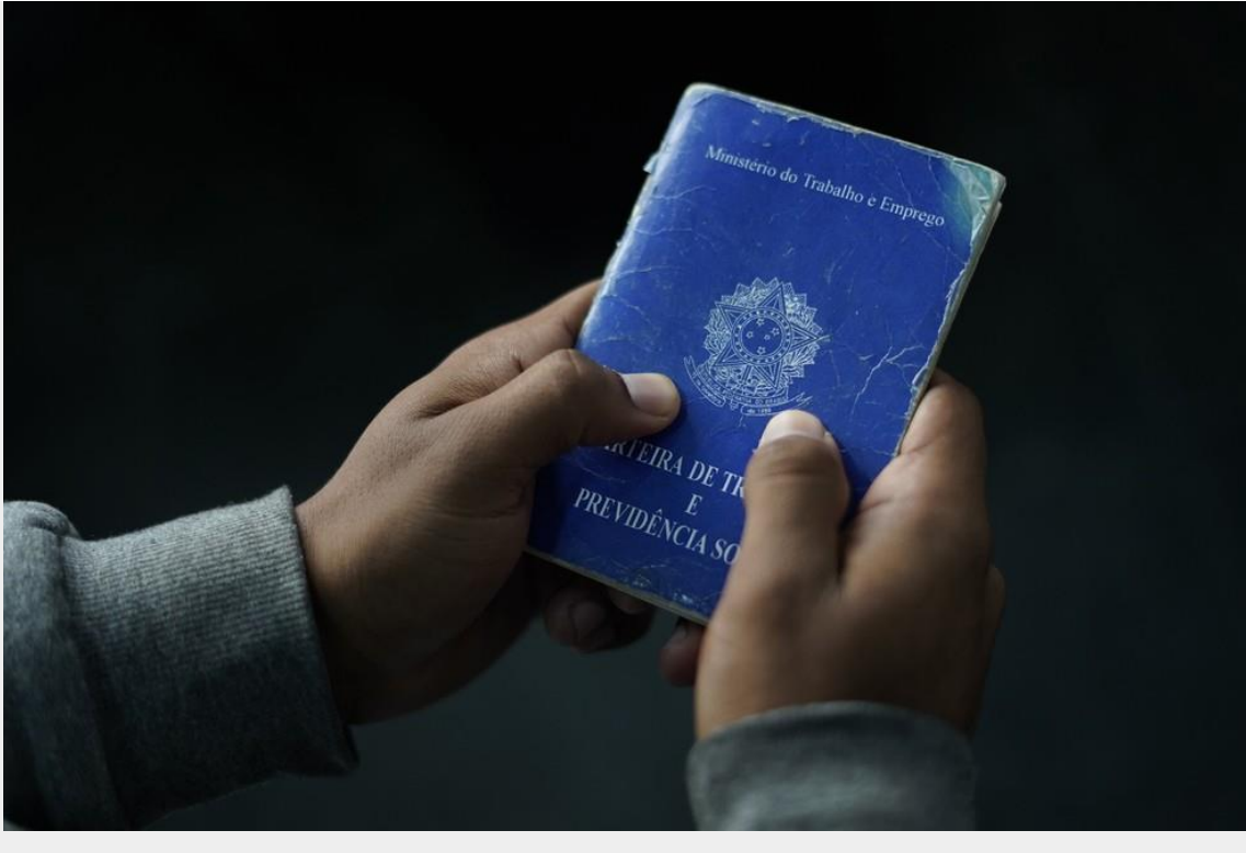
Carteira de trabalho