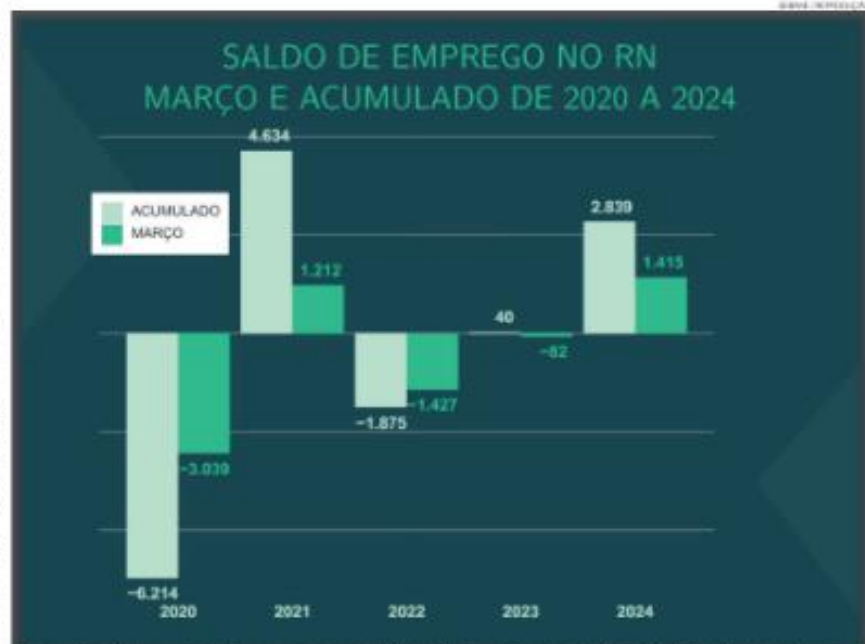
Gráfico mostra saldo de emprego no RN em março e no acumulado de ano até agora, fonte dos dados é o Caged do Ministério do Trabalho e Emprego

namirim, cujo saldo foi de 420 vagas. Já Baía Formosa registrou a maior perda, já que teve 1.091 trabalhadores demitidos sem constituição de custos para ocupar as respectivas vagas. O mesmo ocorreu em Arez, que em março teve um saldo de 708 vagas fechadas, e Apodi, com 303 empregos perdidos. ■