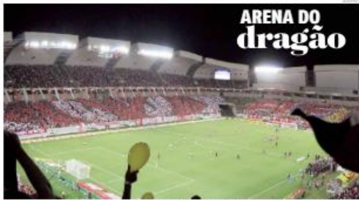
« COPA DO BRASIL » Todos os ingressos foram vendidos para América e Corinthians, hoje (6), às 20h, na Arena das Dunas. O Alvirrubro pretende transformar estádio num "caldário" para abrir vantagem contra o rival paulista, na briga para passar de fase. «PÁGINA 12»

« PESQUISA CONSULT » A desaprovação ao Governo Fátima Bezerra no Rio Grande do Norte é de 70,12%, enquanto 10,53% aprovam. O resultado é fruto de uma pesquisa realizada pelo Instituto Consult entre os dias 22 e 25 de abril, com 1,7 mil entrevistados espalhados nas 12 regiões do Estado. A margem de erro é de 2,3% e a confiabilidade de 95%. «PÁGINA 11»