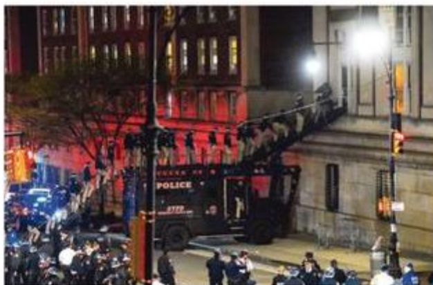
Policiais entram no Hamilton Hall, na universidade de Columbia, em NY, para encerrar ação pró-Palestina.