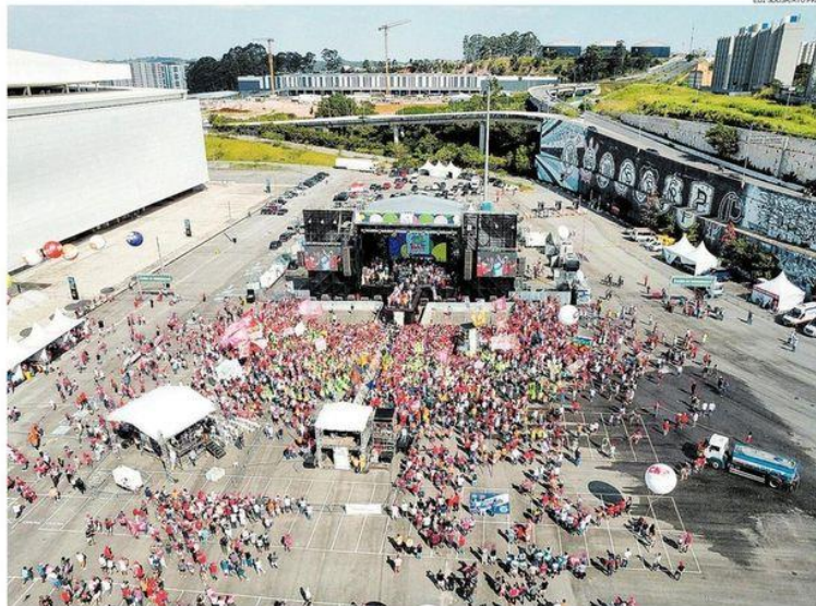
Público reduzido no estacionamento do estádio do Corinthians. Lula se incomodou com baixa presença e reclamou que ato foi 'mal convocado'

Quinta-feira 2 de maio de 2024 • R$ 7,00 • Ano 145 • Nº 47679 estado.com.br