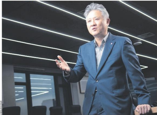
A LG Electronics investiu R$ 1,29 bilhão para começar a produzir itens da linha branca (refrigeradores, lavadoras e secadoras de roupas) em Foz de Iguaçu Grande, na Região Metropolitana de Curitiba. "Temos um plano de expandir fortemente nossa operação", diz o CEO na América Latina, Daniel Song. Pág. B5