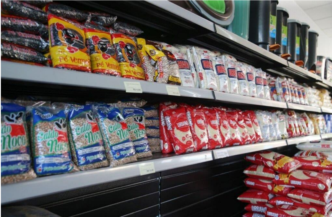
Sacos de arroz

Quinze alimentos in natura ou pouco industrializados vão compor a cesta básica nacional e pagar imposto zero, com a reforma tributária. O projeto de lei complementar que regulamenta o tema, enviado na noite desta quarta-feira (24) ao Congresso, trouxe ainda 14 produtos com alíquota reduzida em 60%.