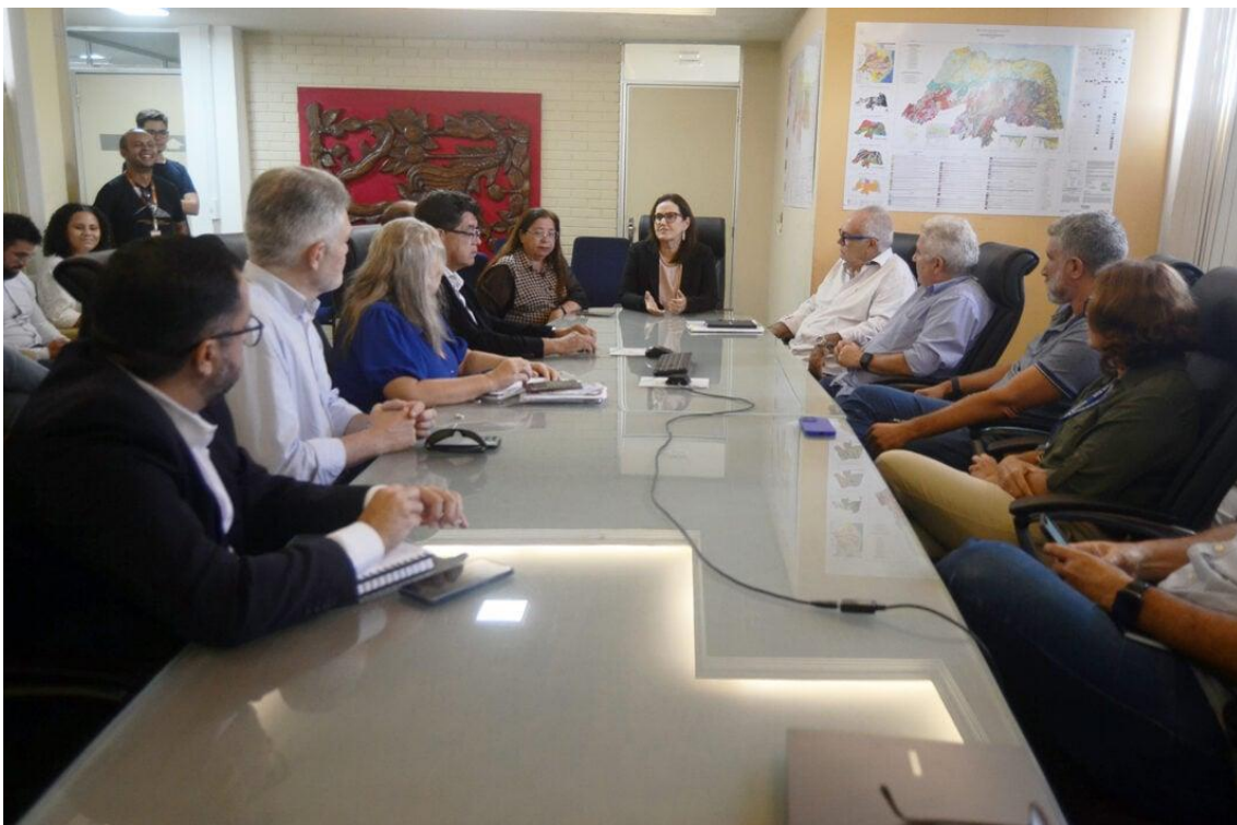
Conselho Gestor reúne membros do Governo e da iniciativa privada