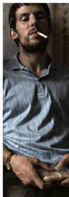
O ator britânico em cena do filme 'La Chimera'

Veto dos EUA ao TikTok afronta livre expressão Acerra de lei que determina a venda da plataforma. Susp em prática Sobre o atraso do sistema de segurança pública.