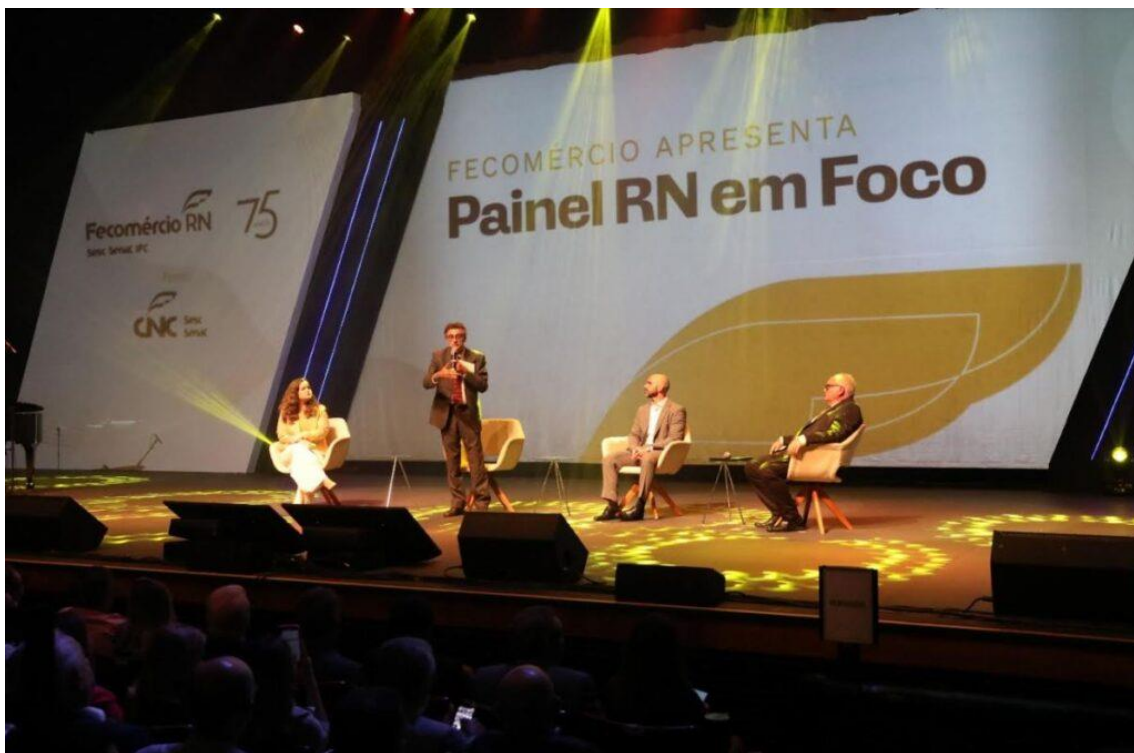
Painel sobre PPPs foi ponto alto do evento da Fecomércio RN nesta quarta-feira (24)