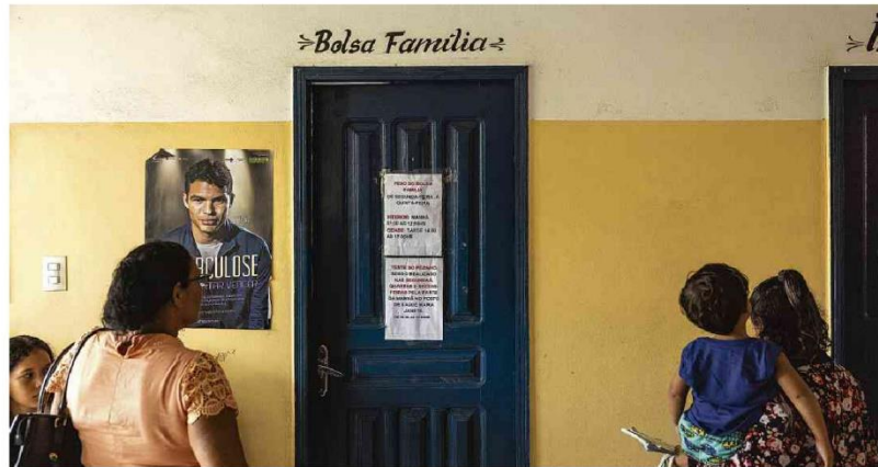
Famílias aguardam a pesagem de crianças beneficiárias do Bolsa Família na Unidade Básica de Saúde de Melgaço, na Ilha do Marajó.

O estudo sobre a situação da exploração mineral é feito desde o ano passado. As análises envolvem os ministérios da Fazenda e de Minas e Energia e apontam que grande parte das unidades entra rapidamente em estado de paralisação. Mercado p.1