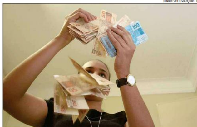
Dieese apontou que salário mínimo ideal para uma família de quatro pessoas seria de R$ 6.832,20

De acordo com pesquisa mensal do Departamento Inter-sindical de Estatística e Estudos Socioeconômicos (DIEESE), baseado na cesta mais cara, que, em março, foi a de São Paulo (R$ 813,26), o salário mínimo ne-