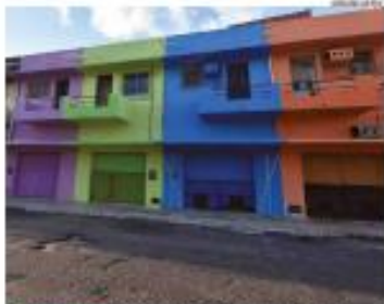
► NOVAS COISAS ► A Prefeitura de Natal segue com as obras de revitalização na Ribeira. Prédios históricos do bairro têm ganhado uma nova pintura e encantado frequentadores. ► PÁGINA 4