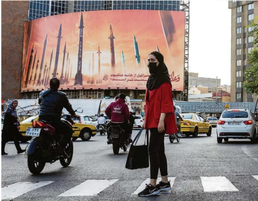
Na Praça Valiasr, em Teerã, outdoor exalta lançamento de foguetes; externamente, governo iraniano apelou para que não haja resposta

Terça-feira 16 de ABRIL de 2024 • R$ 7,00 • Ano 145 • Nº 47863 estado.com.br