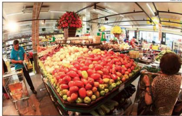
Assurn aponta hortifrúti, como cebola, tomate, batata, cenoura e folhagens como mais afetados

Ele disse, no entanto, que esse aumento não deve refletir em grandes impactos para o consumidor final. "Esses reflexos vão variar de acordo com cada pos-