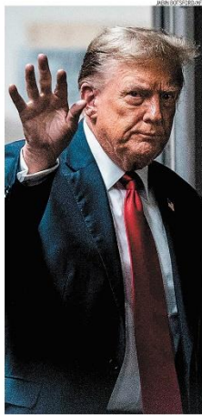
Acusado, Trump ao chegar a tribunal de Nova York

Política de juros americana, afrouxamento da meta fiscal no Brasil e tensão mundial levaram a moeda a fechar o dia em R$ 5,18, a maior cotação em um ano. PÁGINA 13