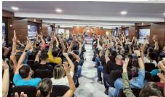
► DEBATE ► Policiais civis decidiram suspender as diárias operacionais e cogiram deflagrar um movimento grevista caso as reivindicações da categoria não sejam atendidas pelo Governo. ► PÁGINA 6