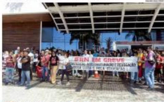
► GREVE ► Professores e servidores do IFRN receberam o ministro da Educação, Camilo Santana, com um protesto em Natal. Categoria cobra reajuste salarial de 22% a ser pago parcelado. ► PÁGINA 8