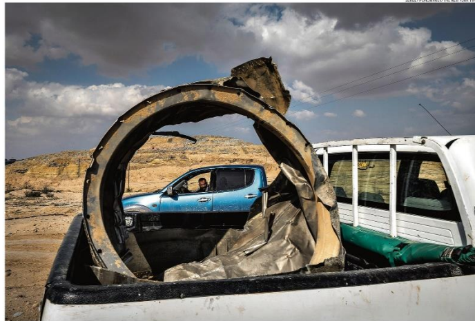
Rescaldo. Pedaco de míssil lançado pelo Irã é recolhido em Israel. Sistema de defesa barrou os ataques, e houve só 12 feridos por estilhaços. Irã alega que não buscou alvos civis

'PREOCUPAÇÃO NÃO É CONDENAÇÃO' Embaixador israelense critica posição do Itamaraty PÁGINA 25