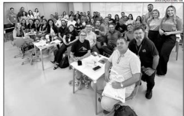
Programa foi apresentado à turma na última segunda-feira (8). Aulas começam nesta semana