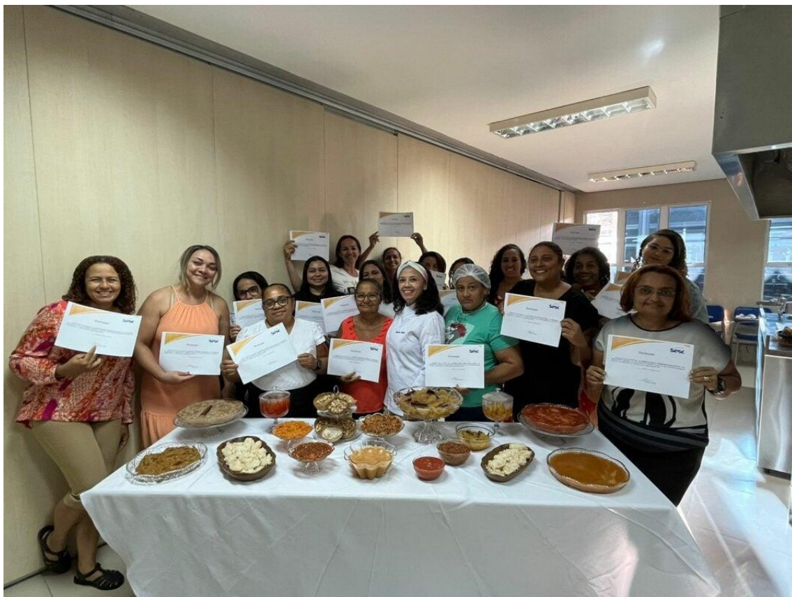
Turma 2023 de Doces Caseiros com os certificados