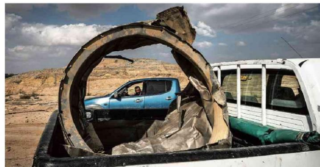
Pedaços de um míssil iraniano recolhidos em um caminhão na região de Arad, em Israel

São Paulo hoje 28° 21° 0h 06h 12h 18h 24h