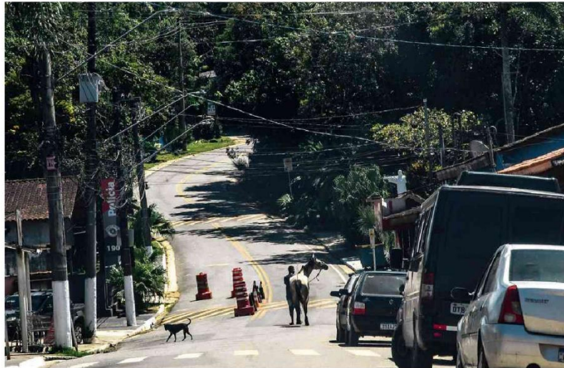
Quase um século depois de fundado, o bairro de Marsilac, no extremo-sul da capital paulista, sofre com precariedade de transporte e na saúde

Equador sem limites A respeito de invasão da embaixada do México.