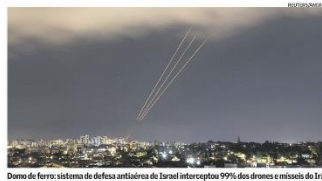
Domo de ferro: sistema de defesa anti-aérea de Israel interceptou 99% dos drones e mísseis do Irã

O Irã lançou os mísseis como retaliação ao ataque, que atribuiu a Israel. O Irã lançou dois mísseis iranianos. O Irã considerou a operação contra Israel concluída, mas ameaçou "ação ainda mais resoluta" caso haja reação. Foi a primeira vez que o Irã lançou um ataque militar direto contra Israel desde a Revolução Islâmica de 1979. Na visão de especialistas, o conflito pode ter impacto limitado sobre os preços do petróleo. O Brasil manifestou "grave preocupação" com a escalada das tensões no Oriente Médio e recomendou aos cidadãos que não viajem à região (Com Agência Internacional). Páginas A13, B10 e C2