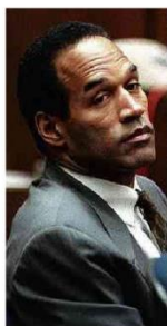
O ex-jogador em júri, em 1994, pelo assassinato da ex-mulher e de amigo dela.

O governo Lula (PT) pretende autorizar a estatal Emgea (Empresa Gestora de Ativos) a comprar parte da carteira de crédito imobiliário de bancos, liberando dinheiro novo para alavancar financiamentos. A iniciativa deve integrar medida provisória a ser lançada na semana que vem. O petista vê na ampliação de empréstimos um motor para crescimento do PIB. Mercado P.1