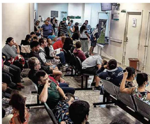
Pacientes com sintomas de dengue e gripe na sala de espera da UPA Tito Lopes, em São Miguel Paulista, onde também há uma tenda para os casos da arbovirose.

Novo longa de Karim Ainouz vai disputar a Palma de Ouro em Cannes