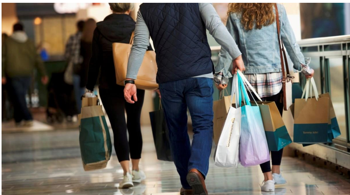
Movimentação de clientes em shopping center

Em fevereiro as vendas apresentaram crescimento de 1,0% sobre o mês anterior, contrariando a expectativa de uma queda de 1,0%