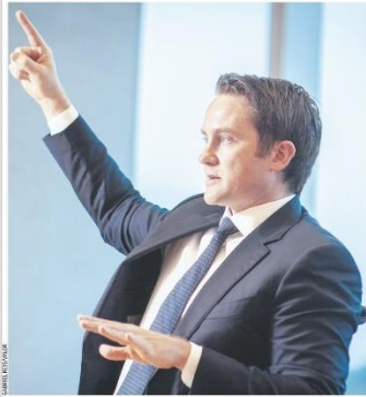
A gestora canadense Brookfield investiu US$ 22 bilhões em dois fundos para investimentos em transição energética, e busca projetos no Brasil, diz o CEO, Connor Teskey. Página B1

O importante equilíbrio entre cautela e disposição para assumir riscos Flávia Camanho B2