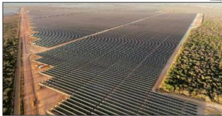
Projeto abrange área equivalente a 1,2 mil campos de futebol. Construção começou em 2022 a 6 km da subestação de energia Assu 3

O country manager da Scatec no Brasil, Aleksander Skarre, considera que o Brasil não apenas se posiciona bem enquanto produtor, mas, ainda, pela qualificação de sua mão de obra especializada