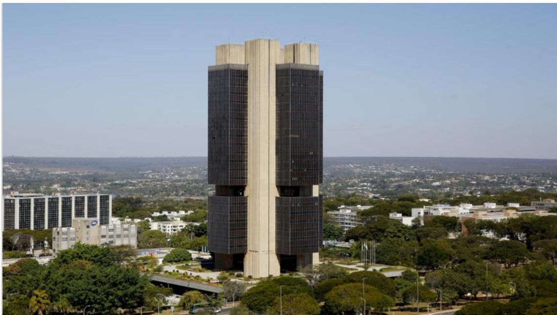
Sede do Banco Central do Brasil, em Brasília

Boletim Focus divulgado nesta 3ª feira (9.abr) pelo Banco Central também estima aumento no crescimento do PIB