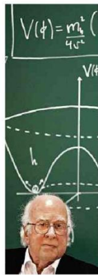
Higgs, em encontro com estudantes em 2013, aos 84 anos. Miguel Rippa - 14.mil.13/APP