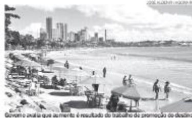
Goveto avalia que aumento é resultado do trabalho de promoção do destino

Dados do Siro e da Anac revelam impacto econômico recorde impulsionado pela popularidade crescente do estado como destino turístico