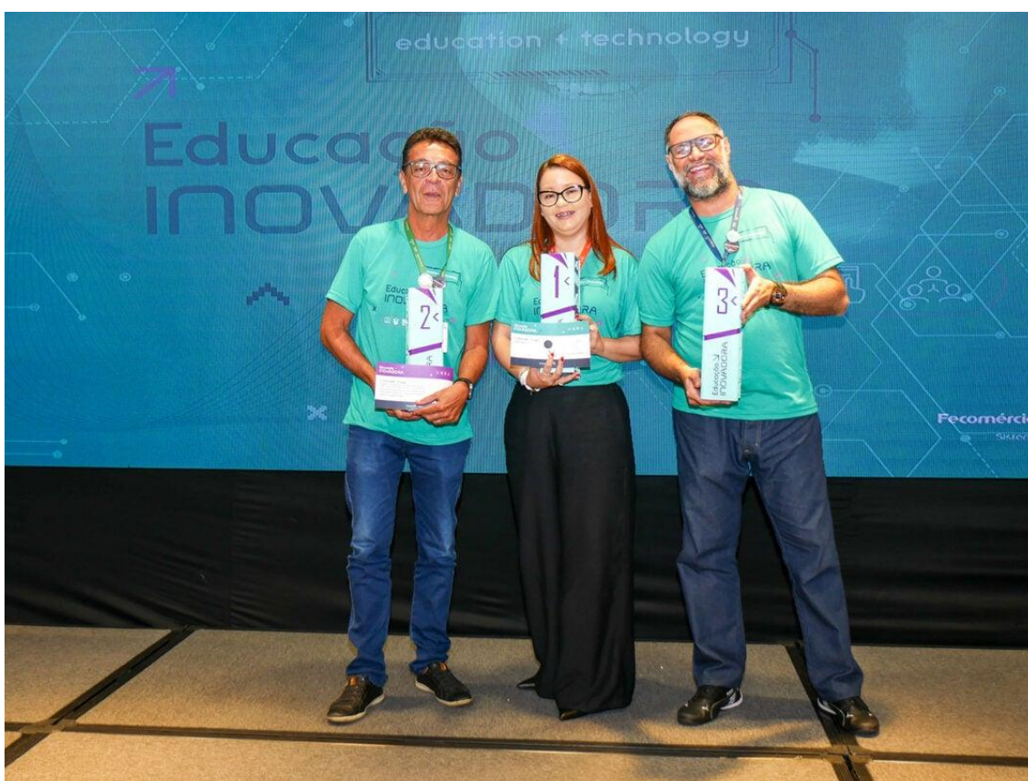
Programa Educação Inovadora engaja instrutores e equipes