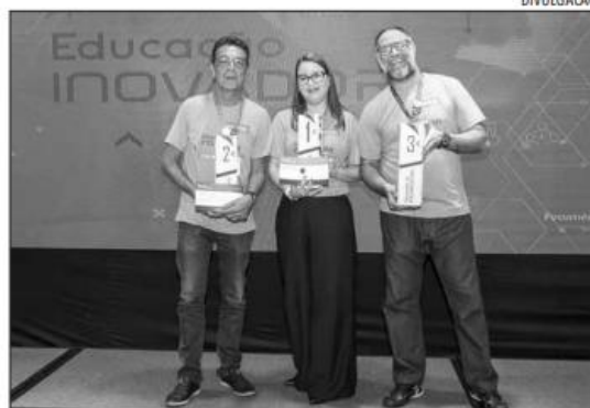
Programa Educação Inovadora engaja instrutores e equipes