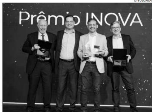
Práticas pedagógicas mais inovadoras do país são premiadas