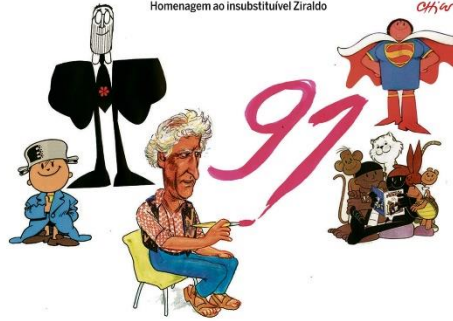
Homenagem ao insubstituível Ziraldo

o amigo "foi um grande amor", e o jornalista Zuenir Ventura disse que Ziraldo pode ser "o único artista brasileiro de sua geração a continuar sendo lido no ano 3000". SEGUNDO CADENERO