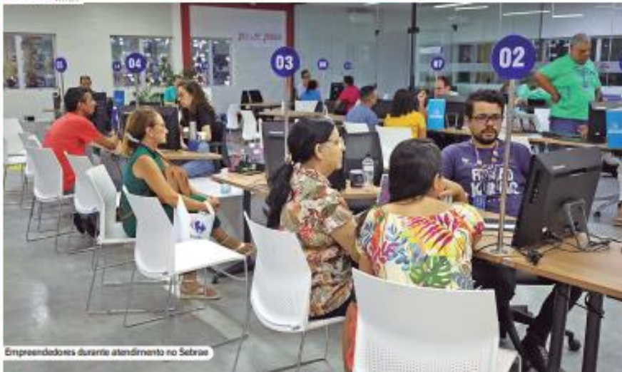
Empreendedores durante atendimento no Sebrae