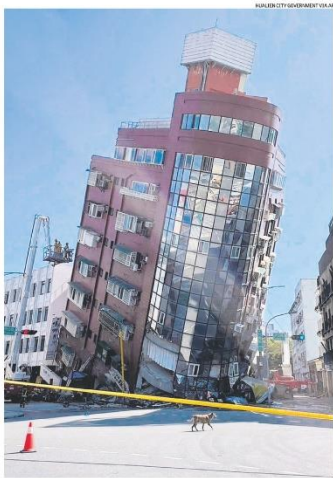
Muitos edifícios se inclinarão, mas resistiram ao terremoto, o que reduziu o número de vítimas

portância para a economia global. Sua principal empresa, a Taiwan Semiconductor Manufacturing — maior fabricante terceirizada de chips do mundo — informou que não houve danos a equipamentos críticos e que pretende retomar a produção ainda na noite de ontem nas instalações afetadas pelo tremor. Avanços tecnológicos na construção das fábricas de chips ajudaram a reduzir o risco de interrupções e danos causados por terremotos. Taiwan situa-se na região conhecida como "Anel de Fogo" do Pacífico, onde ocorrem 90% dos terremotos no mundo. Página A15