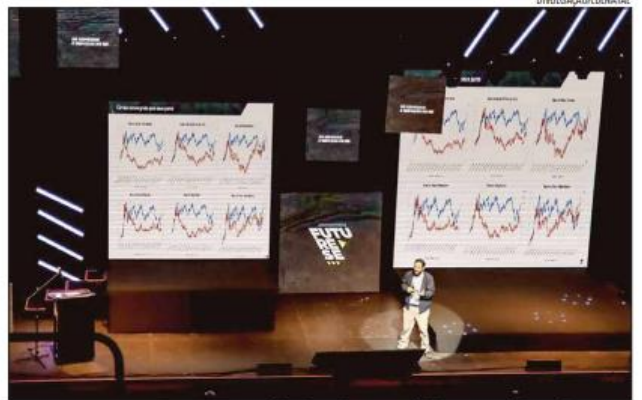
Future-se acontece no Centro de Convenções de Natal com capacidade para mais de 3 mil pessoas

A Feira será aberta ao público, com entrada gratuita e nela está montado o palco Arena Fecomércio Made in RN, uma oportunidade para que mais pes-