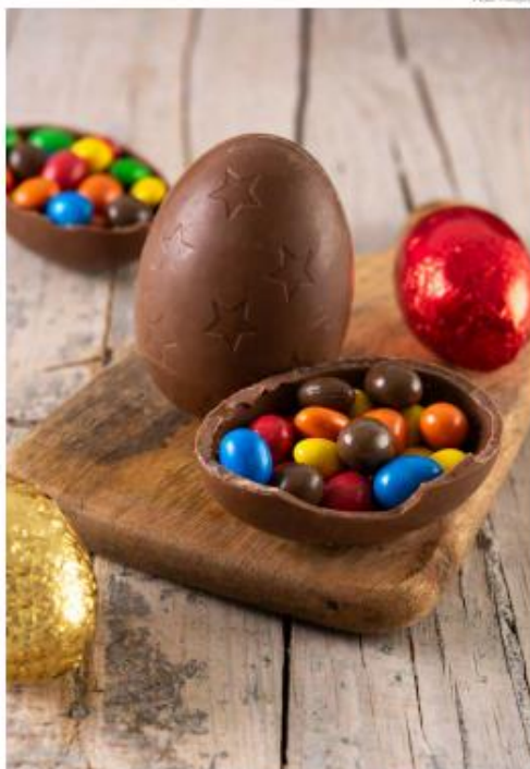
Variedade dos ovos vai desde os tradicionais dos supermercados e os recheados das docerias