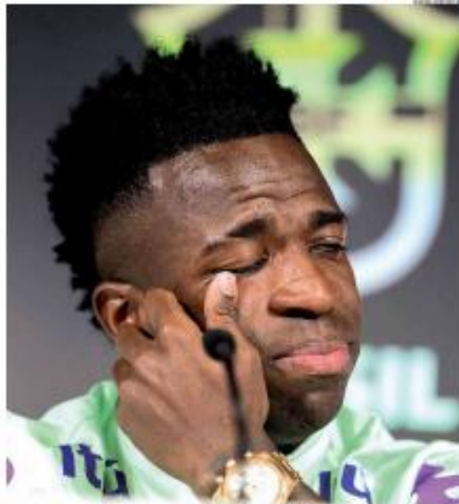
« SELEÇÃO » Vini Jr. chegou ao fim do castigo no futebol. Ele estará em campo hoje pelo Real Madrid para enfrentar a Espanha, na Uféria, em amizade no estádio do Real, onde o atacante atua. « PÁGINA 14 »