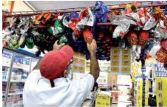
« VENDIDAS » O comércio de vendas de ovos de páscoa e chocolates para a Semana Santa ainda está abaixo do esperado, mas com expectativas de melhorias com a proximidade do feriado. « PÁGINA 7 »