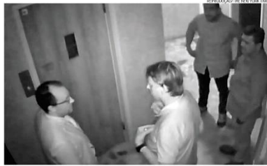
REPOSIÇÃO DE MANEIRO TOSTI

publicou vídeos de Bolsonaro no prédio. A defesa do ex-presidente declarou que ele foi debater a situação política dos dois países. A PF quer esclarecer se o episódio configura tentativa de fuga ou disposição de descumprir eventuais medidas judiciais, e Moraes ordenou que Bolsonaro explique o caso em até 48 horas. PÁGINA 4