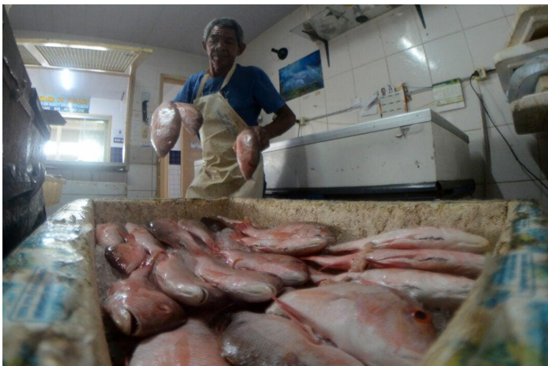
Trabalhadores do Mercado do Peixe veem uma tendência de queda nos últimos anos