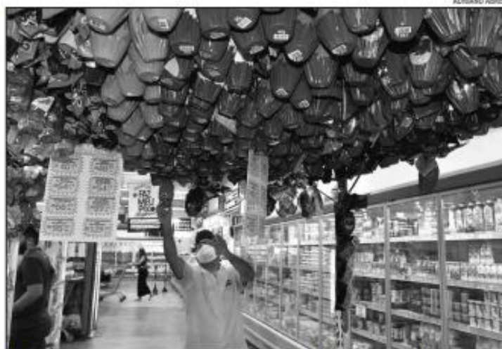
A cinco dias para a Páscoa, sessões estão recheadas de opções e sabores de ovos, mas sem tantos clientes

"A expectativa é muito boa, não só para ovos de Páscoa e chocolates de maneira geral e todos os produtos que envolvem a sazonalidade da páscoa, como vinhos, peixes e azeites. Houve uma preparação na aquisição de produtos para se fazer muitas ofertas para os consumidores. É uma Páscoa plena, já totalmente distante das questões da pandemia. Estamos com as lojas muito abastecidas, produtos expostos e vamos começar as