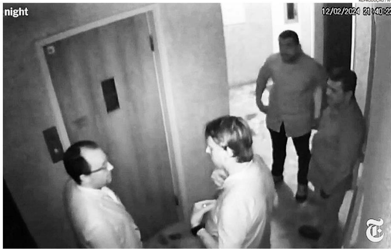
Câmera de segurança da Embaixada da Hungria mostra o embaixador Miklós Halmai conversando com Jair Bolsonaro em 12 de fevereiro

Ex-presidente chegou ao local uma hora após convocar ato na Av. Paulista e dormiu lá 2 noites; Moraes dá 48h para explicações