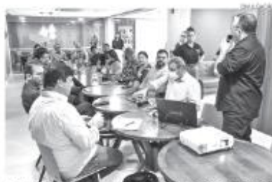
Objetivo final é elevar o patamar do setor de alimentos e bebidas do Estado

Uma característica distintiva e motivadora do programa é o sis-