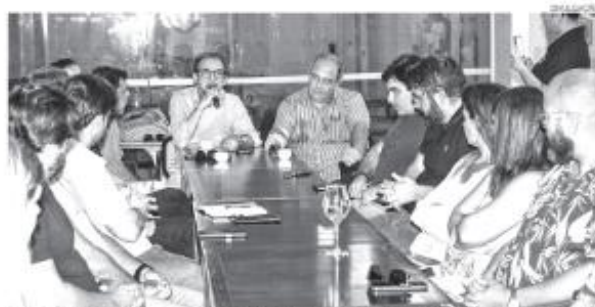
Objetivo: “Para estabelecimentos se destacarem, é fundamental investir na capacitação dos empreendedores e suas equipes”