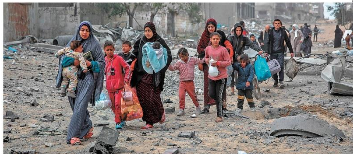
Tragédia humanitária. A população palestina em Gaza tem sofrido com a fome e os ataques do Exército israelense. Segundo autoridades locais, já houve mais de 32 mil mortes

Com abstenção dos EUA, proposta passa pela primeira vez no Conselho de Segurança. Governo Netanyahu diz não ter 'direito moral' de parar operação