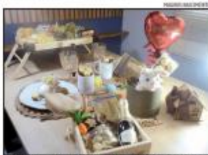
Produtos que fogem do trivial são diferenciais de mercado

Em relação às viagens pela Paraíba, os gastos das natalenses ficarão no total de R$ R$ 194,09. Segundo a pesquisa, 16,6% dos moradores da capital vão viajar na Semana Santa. Para escapar a interferência econômica para a Páscoa de 2024, a Instituto Fecomércio RN (IFC) entrevistou, ao longo do mês de março, um total de 600 pessoas em Natal e 500 pessoas em Mossoró. Ambos os levantamentos possuem margem de erro de 3 pontos percentuais e nível de confiança de 95%.