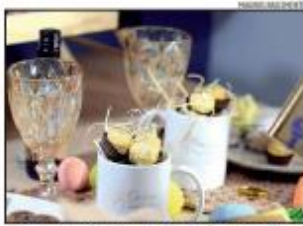
Mesas, como as casacas personalizadas, são bem atrativas