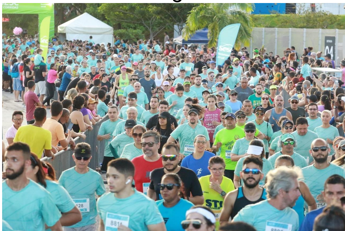
Corrida acontece em maio.

Os atletas que estão em preparação para a etapa Natal do Circuito Sesc de Corridas poderão treinar, gratuitamente, com orientação dos profissionais do Serviço Social do Comércio do Rio Grande do Norte (Sesc RN). Os treinos acontecerão pelas ruas de Natal, a partir deste sábado (23) e seguem até o dia 27 de abril.