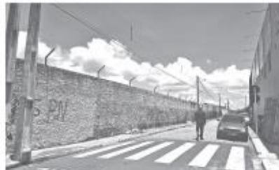
Area afetada abrange quarteirões entre Nevaldo Rocha e Antônio Basílio