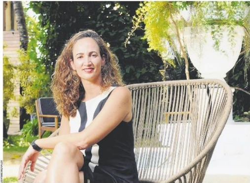
Hotéis de luxo ampliam os serviços aos hóspedes com a oferta de experiências exclusivas. O carioca Santa Teresa McAlamy, por exemplo, oferece visita guiada no bairro, um dos mais antigos da cidade, e aulas de "arteterapia". Sophia Barbara , Página B30