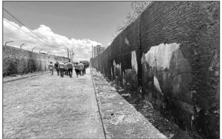
Região conhecida como cracolândia de Natal fica localizada na avenida Jaguarari