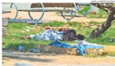
Presença de usuários de drogas causam medo e transtorno em Lagoa Nova

O fenômeno da “cracolândia” é comum em capitais. “Vamos reportar especificamente a que existe em São Paulo. Esse fenômeno é produto de uma correlação de diversas peculiaridades, além do vício. Essa população está na rua por questões como o rompimento de vínculos familiares, perda da habitação, problemas de saúde mental, perda de trabalho. Então, são mazelas que são produtos de uma desigualdade que existe no Brasil. E isso vai repercutir em um cenário de re-