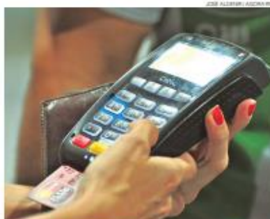
Cartão de crédito é um dos principais endividamentos, diz economista

Entre 10 potiguares, ao menos quatro estão com dívidas inadimplentes, segundo o Mapa da Inadimplência e Negociação de Dívidas da Serasa. Em janeiro deste ano, o levantamento mensal da empresa que avalia as condições de crédito de milhares de brasileiros aponta que aumentou o número de inadimplentes no Rio Grande do Norte. Foi o suficiente para que o RN subisse para a terceira posição entre os mais endividados em toda a região Nordeste.