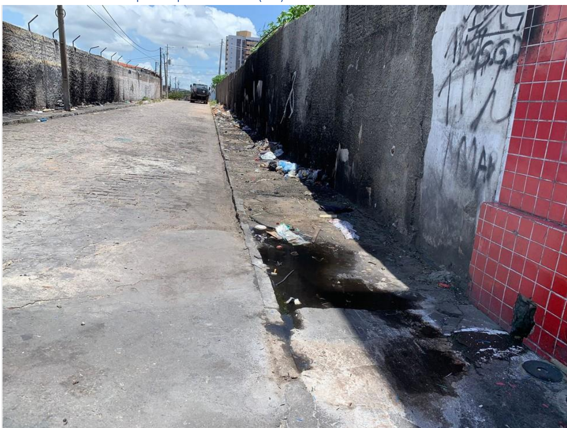
Trecho visitado pelas autoridades em Lagoa Nova, em Natal (RN)

Ponto na Avenida Jaguarari, na Zona Sul da capital potiguar, tem sido alvo de relatos constantes, de moradores e comerciantes, de crimes. Autoridades marcaram reunião para quinta-feira (21).