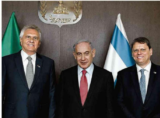
TRCÍCIO E CAIADO SE ENCONTRAM COM NETANYAHU EM ISRAEL. Os governadores de São Paulo (à dir.) e de Goiás (à esq.) com o premiê israelense; Tarcísio disse que visita mostra solidariedade com povo de Israel e Caiado fez referência a declarações de Lula, que comparou ação em Gaza ao Holocausto. Mundo A11

O esquema envolveu a Secretaria de Saúde de Duque de Caxias (RJ), que inseria as informações no sistema do Ministério da Saúde. Políticos e funcionários locais estão entre os indicados. A defesa de Bolsonaro afirmou que o indiciamento é precipitado e que só soube pela imprensa. "Vazamentos continuam aos montes", disse Fábio Wajngarten, O ex-presidente e Cid não se pronunciaram. Política A4 a A6