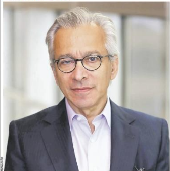
"Estamos otimistas com o Brasil. A economia dá sinais de recuperação, com as contas externas muito bem, a probabilidade de crescimento mais sólido no médio prazo aumenta", diz Amer Bisat, diretor de venda fixa de mercados emergentes da BlackRock. Página C2