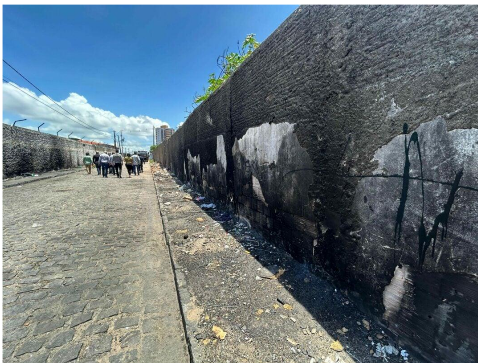
Região conhecida como cracolândia de Natal fica localizada na avenida Jaguarari