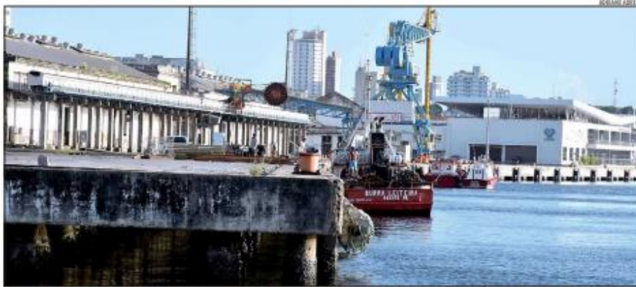
Baixa movimentação do Porto de Natal é atribuída principalmente à falta de infraestrutura. Codern afirma que tem feito busca permanente por novos negócios