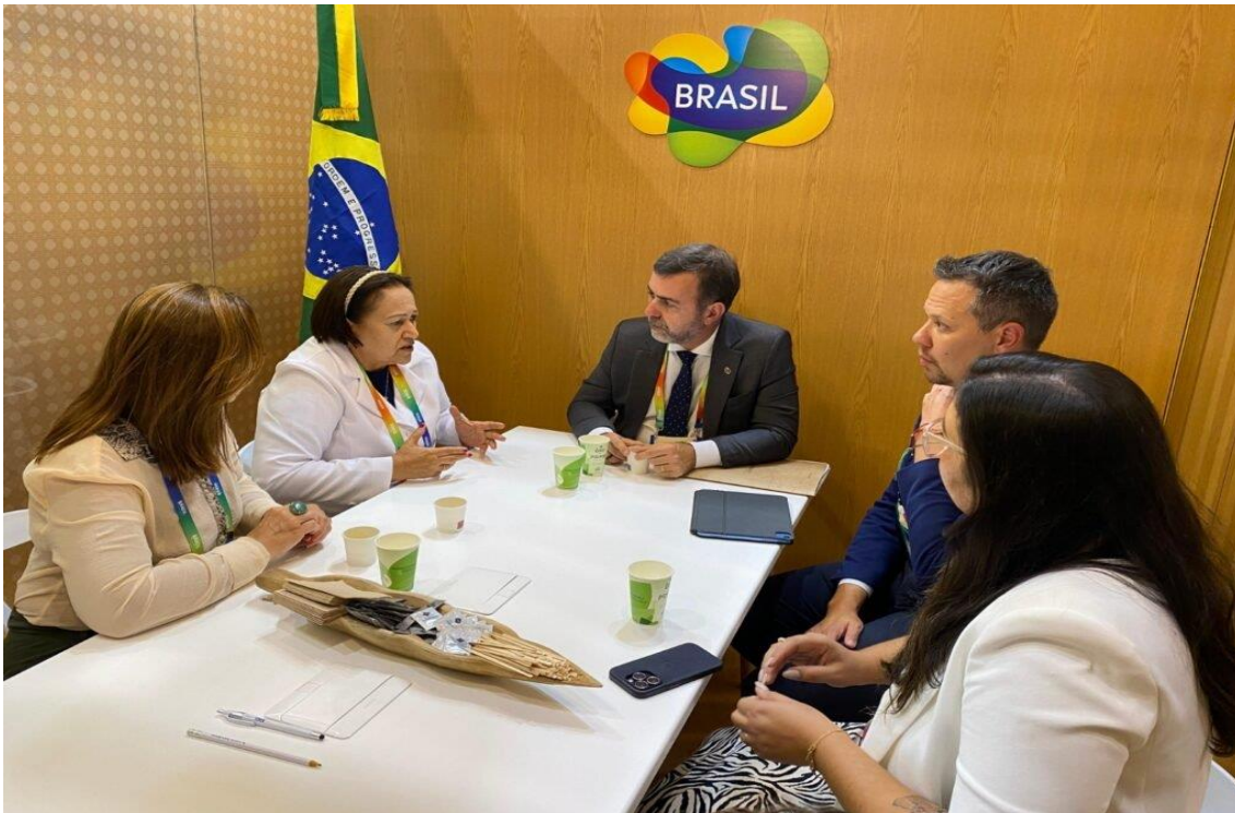
A BTL é um dos mais importantes eventos de promoção ao turismo da Europa

O crescimento da atividade turística, com destaque para o fortalecimento de destinos no interior do Estado; manutenção da frequência diárias de voos Lisboa-Natal e a realização de um fórum de geoparques de países de língua portuguesa no Rio Grande do Norte. Foram esses os resultados da participação da delegação do RN na Bolsa de Turismo de Lisboa (BTL), encerrada neste domingo (3). O RN está inserido nos planos do governo federal de elevar a participação do turismo no Produto Interno Bruto, contando, para isso com a recuperação da economia, que cresceu 3% no ano passado. Portugal é o país de origem de 27,6% dos turistas internacionais que desembarcam no Rio Grande do Norte.