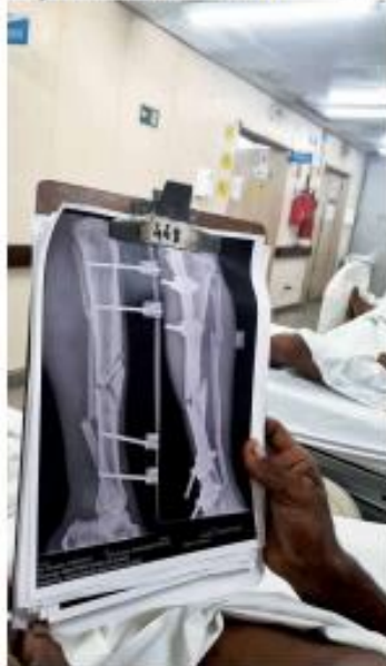
▶ DEFICIÊNCIAS ▶ Após fiscalização no Hospital Walfredo Gurgel, a Comissão de Saúde da CMH denunciou equipamentos quebrados, como tomógrafo e raio-x. Smap nega problemas. ▶ PÁGINA 10 ▶