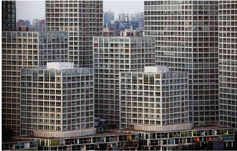
Projeto Jian Wai Soho, em Pequim, de Riken Yamamoto; arquiteto possui sólida carreira de cinco décadas.

Farsa venezuelana A respeito de eleições e desmandos na ditadura.