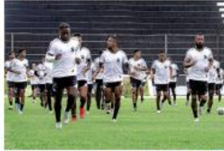
▶ ABC ▶ O ABC tem poucas alternativas para entrar o elenco e faz jogo determinante no torneio regional, contra o CRB, no Franquês, a partir das 20h00. ▶ PÁGINA 12 ▶