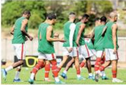
▶ AMÉRICA ▶ O Almirante vai utilizar sua 1ª formação diferente em 16 jogos no ano. O time enfrenta a Jacupissu, no Interior Baiano, pela Copa RN. ▶ PÁGINA 12 ▶