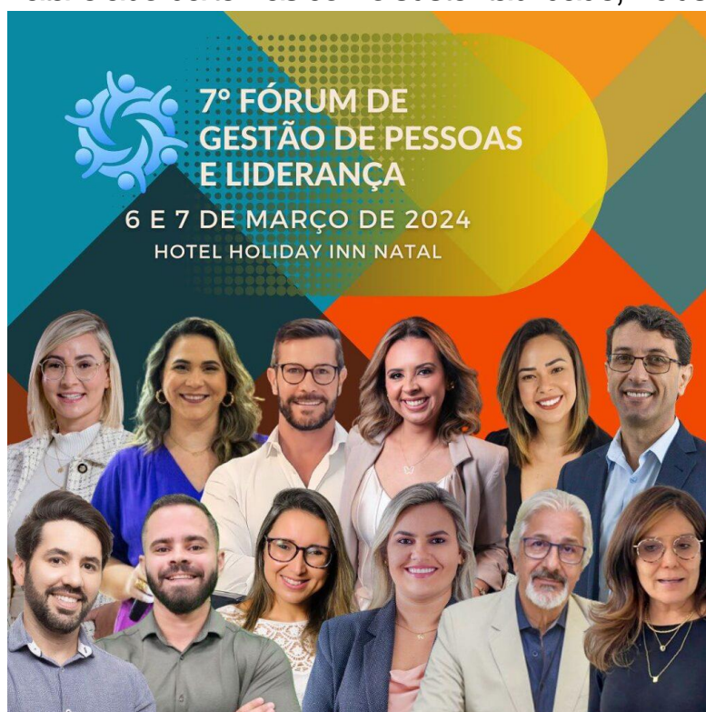
Evento acontece no Holiday Inn Natal, nos dias 6 e 7 de março, das 14h às 20h.

Nesta quarta-feira (06) tem início o 7º Fórum de Gestão de Pessoas e Liderança e segue até a quinta-feira (07), no hotel Holiday Inn Natal, das 14h às 20h. No tema central, “Sustentabilidade, Inclusão e Novas Tecnologias”.