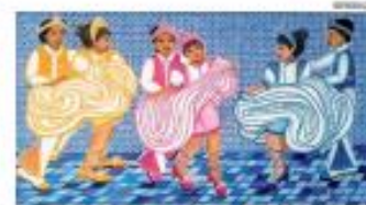
▶ PARTELA ▶ As paradas do Barulho, no Cidade Alta, irão receber a exposição "Geração Mulheres", em uma homenagem à Semana Internacional da Mulher. ▶ PÁGINA 10 ▶