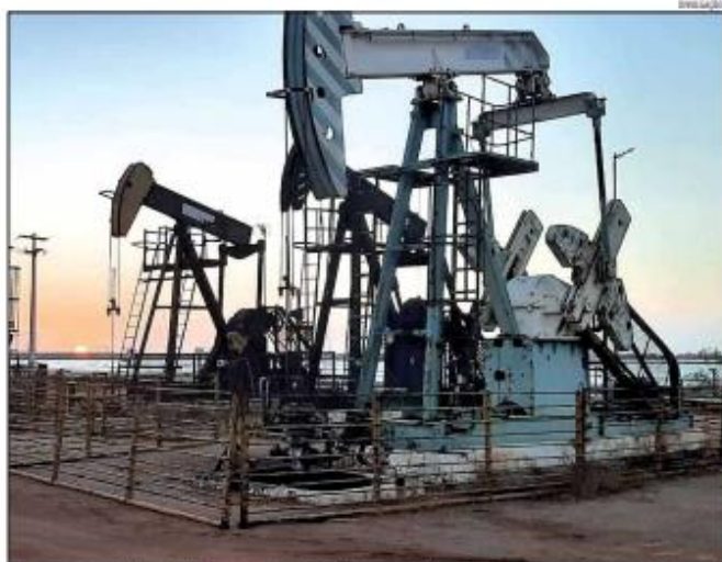
Para o Estado e municípios do RN foram repassados pela União R$ 590,3 milhões, no ano passado, ante R$ 705,3 milhões de 2022