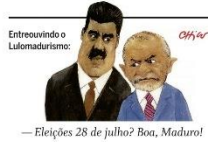
— Eleições 28 de julho? Boa, Maduro!

O INSS prepara um pacote para economizar até R$ 10 bilhões, entre medidas como o leilão da sua folha de pagamentos e um pente-fino contra fraudes em benefícios como o BPC e o auxílio-doença. PÁGINA 17