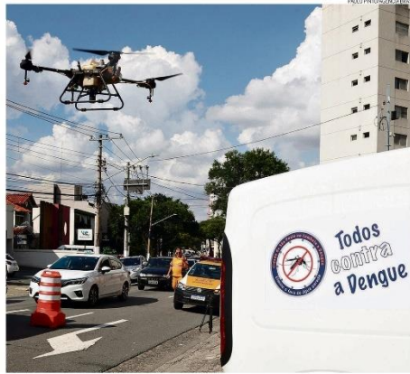
Pelo ar. A cidade de São Paulo passou a contar com drones no combate ao mosquito. Os equipamentos vão sobrevoar pontos onde há focos do transmissor e despejar larvicida para impedir a proliferação da doença

de até 14 anos. O planejamento inicial anunciado previa, por ora, apenas a faixa etária de 11 e 12, mas, como mostrou O GLOBO, estados reivindicavam a ampliação e alguns já a vinham fazendo por conta própria. O país soma quase 1,3 milhão de casos de dengue. PÁGINA 25