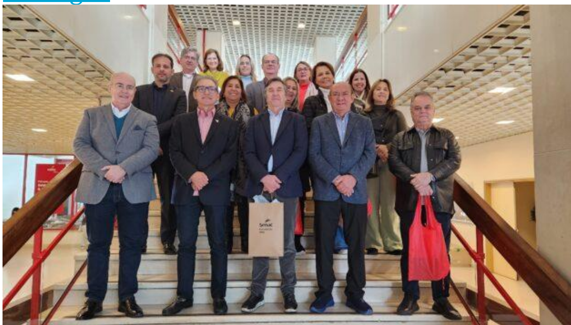
Visita a escola técnica de Estoril.

Comitiva visitou a Escola Superior de Hotelaria e Turismo de Estoril (ESHTE) para prospectar novas parcerias