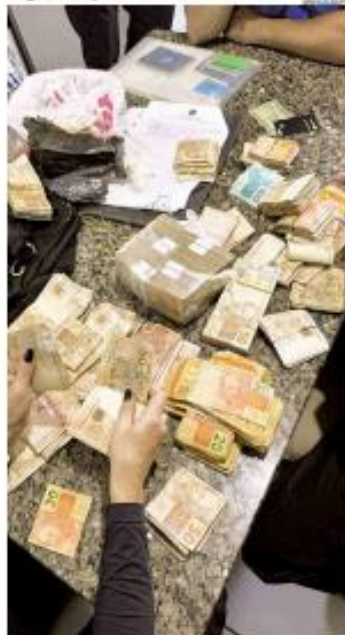
► TRÁFICO ► Operação policial realizada em Natal apreendeu cerca de R$ 500 mil. Ação segue organizada criminalmente que dominava parte da distribuição de drogas na zona Norte. ► PÁGINA 10 ►