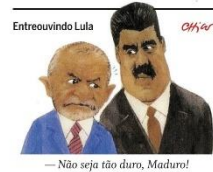
— Não seja tão duro, Maduro!

País já teve mais de um milhão de casos de dengue este ano, uma alta de 369% em relação ao início de 2023. PÁGINA 24