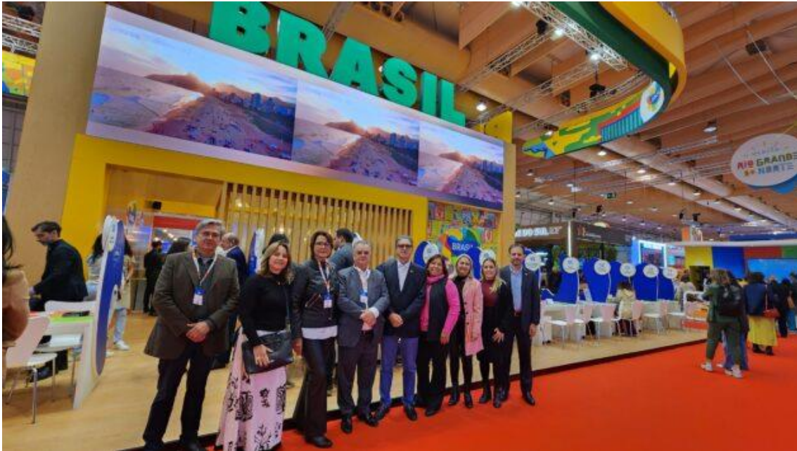
Comitiva do Sistema Comércio na Bolsa de Turismo de Lisboa.

A BTL, um dos principais eventos de turismo do mundo, teve início nesta quarta-feira, 28, e segue até 3 de março