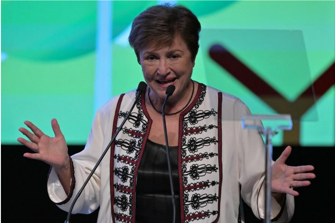
Kristalina Georgieva durante evento do G20 em São Paulo

Em sua primeira visita ao Brasil , a diretora-gerente do Fundo Monetário Internacional (FMI), Kristalina Georgieva, diz que o país “tem sido uma boa notícia para a economia mundial”, por ter superado as projeções de crescimento dos últimos anos, inclusive as do Fundo. Para ela, o Brasil está bem posicionado no front fiscal, com um pacote “muito determinado” de reformas, citando entre elas a mudança do sistema tributário, que deve elevar o crescimento potencial ao longo do tempo e a iniciativa que busca ampliar a oferta de proteção cambial para projetos ambientalmente sustentáveis, lançada na segunda-feira. Georgieva também vê com bons olhos o novo arcabouço fiscal.