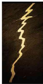
Rio amazônico em foto de George Love MAM SP/Divulgação