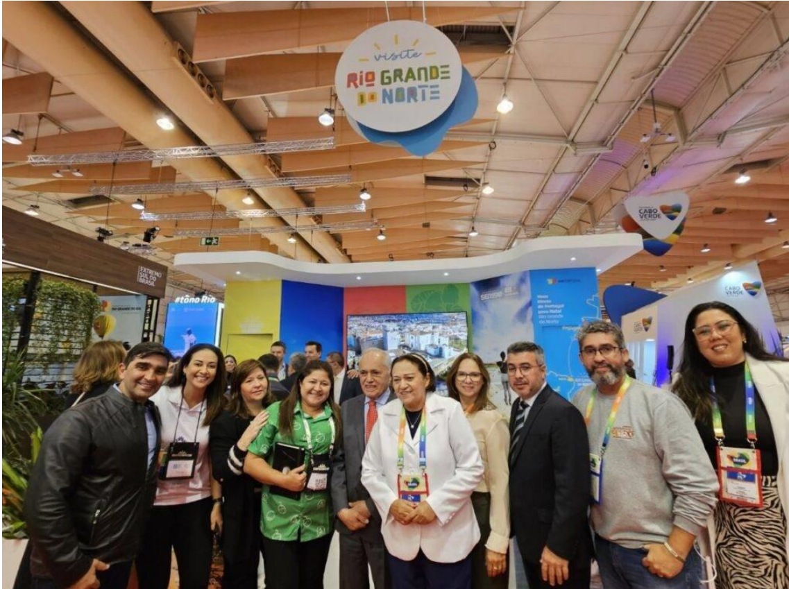
Delegação do RN na BTL é chefiada pela governadora Fátima Bezerra (PT)