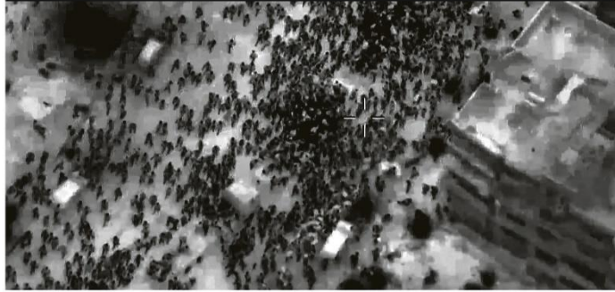
De cima. Imagens aéreas divulgadas pelo Exército de Israel mostraram parte das cenas da madrugada em Gaza: civis desesperados por comida cercaram os caminhos de ajuda

RIO DE JANEIRO, SEXTA-FEIRA, 1 DE MARÇO DE 2024 ANO XCIX - Nº 33.079 • PREÇO DESTE EXEMPLAR NO RJ - R$ 6,00