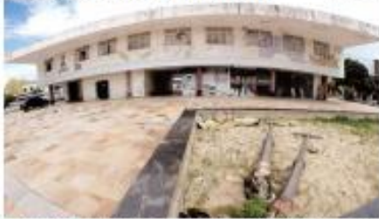
► ABANDONO ► Tradicional Praça Augusto Severo espera por reformas há três anos. Licitação para a obra depende, agora, da liberação da Upan. ► PÁGINA 6 ►