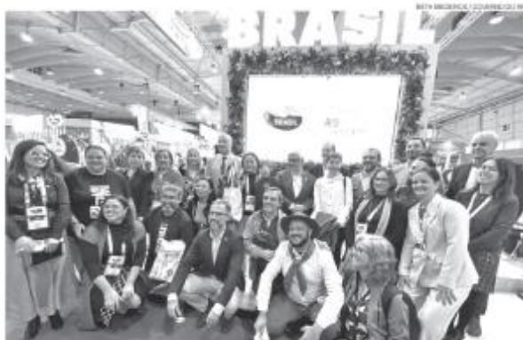
Delegação do RN na Bolsa de Turismo de Lisboa, a maior feira do segmento em Portugal, principal emissor de turistas para o RN