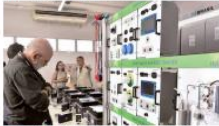
► OPORTUNIDADE ► Estado passa a contar com o 12 Centro de Excelência em Formação Profissional para Hidroelétrico Verde do Brasil, no Senac. ► ECONOMIA 1 ►