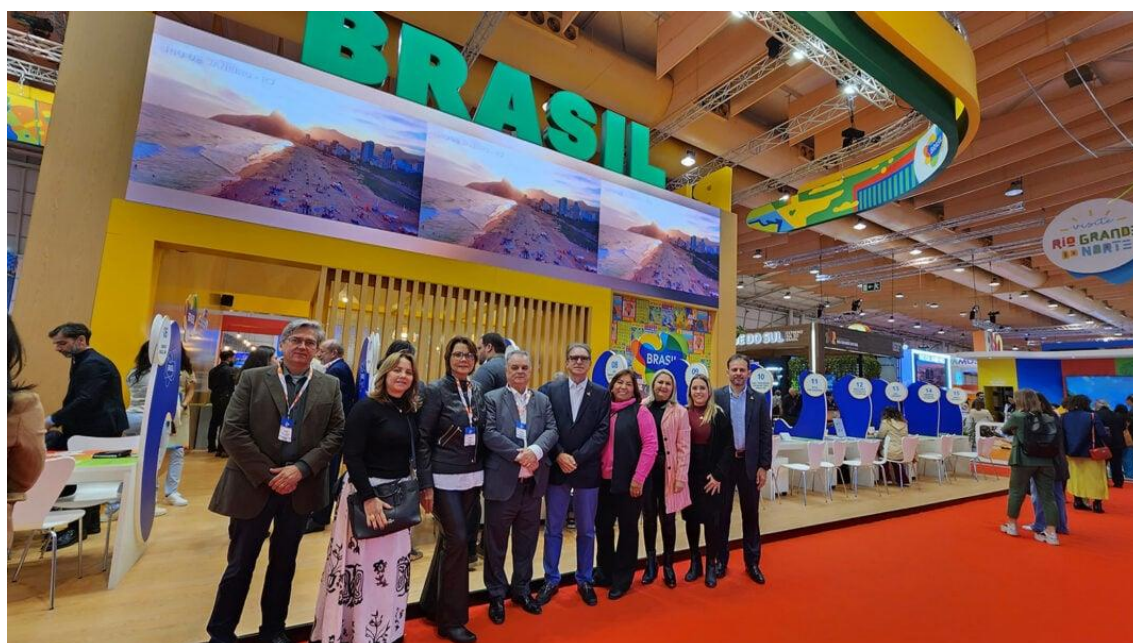
Comitiva da Fecomércio RN na BTL, que segue até 3 de março