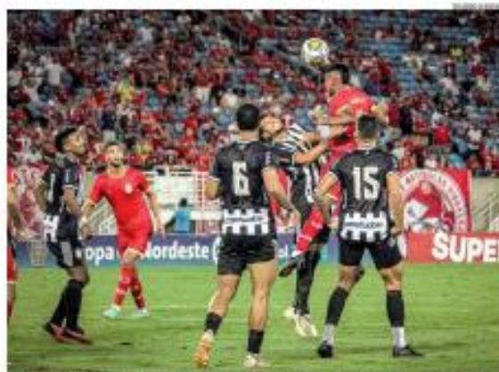
» COPA DO NORDESTE O América não fez um bom jogo contra o Treze/PE, nesta quarta-feira (20), na Arena das Dunas e ficou no empate em 2 a 2. Alvinegro segue em último no Grupo A. » PÁGINA 10

A invasão do MLE ao antigo terreno onde funcionava o Distrito de Natal completa um mês hoje. Movimento agita solicitação ao Governo do Estado que um novo local seja construído. » PÁGINA 8