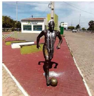
ESTÁTUA DE DANIEL ALVES É ATACADA Tinta em peça que representa o ex-jogador condenado por estupro, em Juazeiro (BA), sua cidade natal. Esporte B7