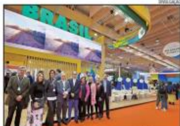
Comitiva da Fecomércio RN na BTL, que segue até 3 de março