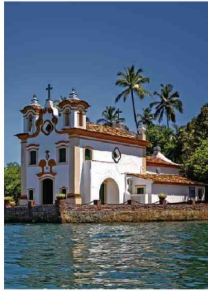
Capela Nossa Senhora do Loreto, construída em 1645, em uma das 15 praias da ilha, algumas desertas.

Ney Matogrosso, Alcione e Luis Miguel fazem shows na cidade em março