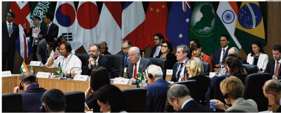
Abertura. Na reunião entre os chanceleres de países do G20, o chefe do Itamaraty, Mauro Vieira, cobrou reforma da ONU e criticou o que vê como "paralisa" do Conselho de Segurança em relação a conflitos como os de Gaza e Ucrânia

RIO DE JANEIRO, QUINTA-FEIRA, 22 DE FEVEREIRO DE 2024 ANO XXIX - Nº 33.071 - PREÇO DESTA EXEMPLAR NO RJ - R$ 6,00