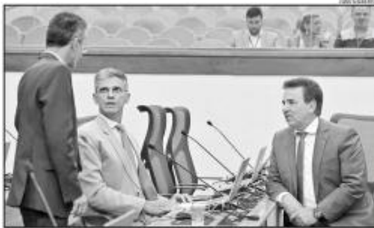
Deputado Francisco do PT conversa com Governador Aécio Neves (PSB) sendo observado por Laiz Eduardo (SD)

« REPERCUSSÃO » Despreparo, desserviço e página virada foram reações de deputados sobre contenda sobre ICMS pós-redução de alíquota no RN