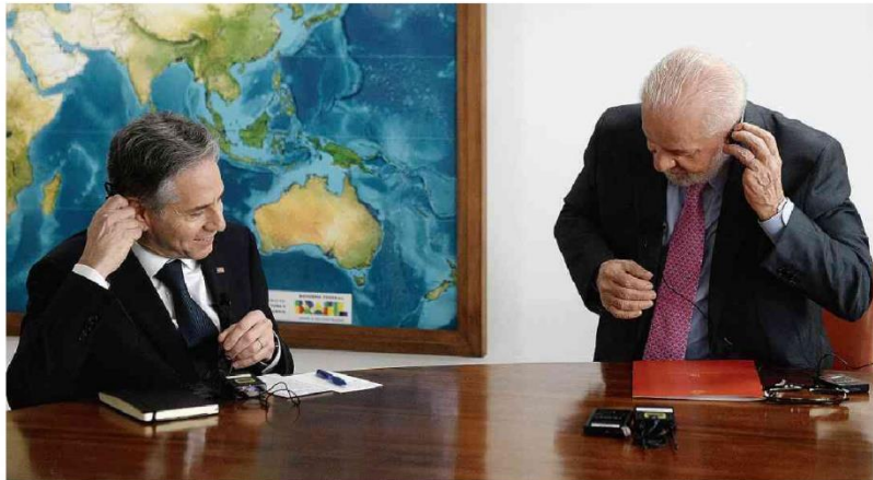
O chefe da diplomacia dos EUA, Antony Blinken, em reunião com o presidente Lula (PT) no Palácio do Planalto.

As palavras de Lula sobre a ação israelense em Gaza e sua repercussão provam que é preciso ter habilidade até para fazer barulho. Ele usa o tabuleiro global para denunciar violações do governo Netanyahu, mas não avançou uma única casa com a referência impropria a Hitler. Opinião A2