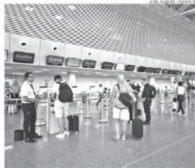
Aeroporto de São Gonçalo do Amarante agora está sob gestão da Zurich Airport

Empresa prevê um aumento geral de 21% nas chegadas de turistas internacionais ao Brasil nos primeiros três meses deste ano