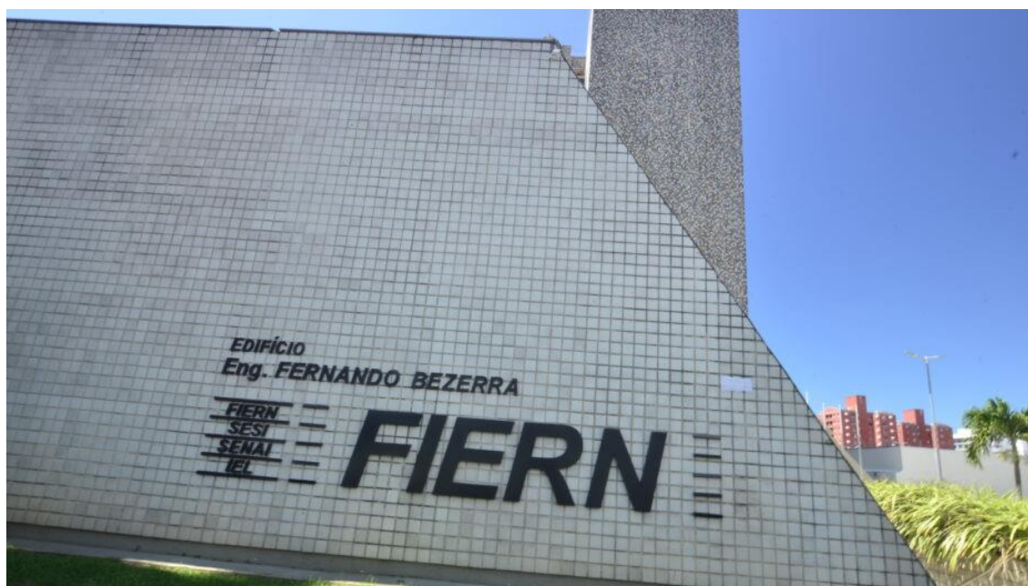
Fiern