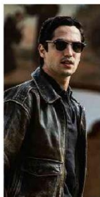
Gabriel Leone como piloto espanhol em 'Ferrari'.

Ilustrada C1 "Ferrari", de Michael Mann, explora obsessões do magnata italiano