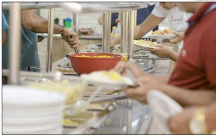
Inflação do custo dos alimentos está quase 3% acima do que o setor tem conseguido repassar para os cardápios (na casa dos 7%)

A mais recente pesquisa da Abrasel sobre o cenário atual de bares e restaurantes do RN, divulgada no início deste mês,