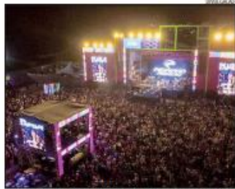
Em dois dias, evento atraiu 75 mil pessoas, um público recorde

Alado a isso, 95% das pessoas que curtiram o Verão da Gente pretendem voltar na próxima edição. A pesquisa apontou que o Verão da Gente recebeu nota média geral de 9,26 de avaliação dos participantes. Atracões musicais, organização do evento, divulgação, espaço físico/estrutura, locais de alimentação, segurança, limpeza urbana, dentre outros, foram avaliados como de bom e ótimo pelos participantes.