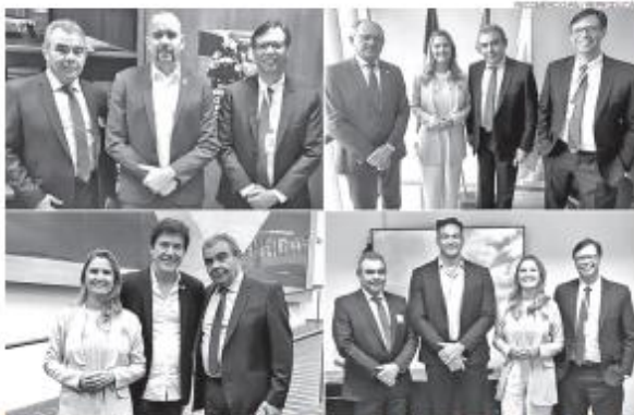
Diração da Fecomércio se reuniu com deputados e senadores em Brasília para discutir manutenção do Perse