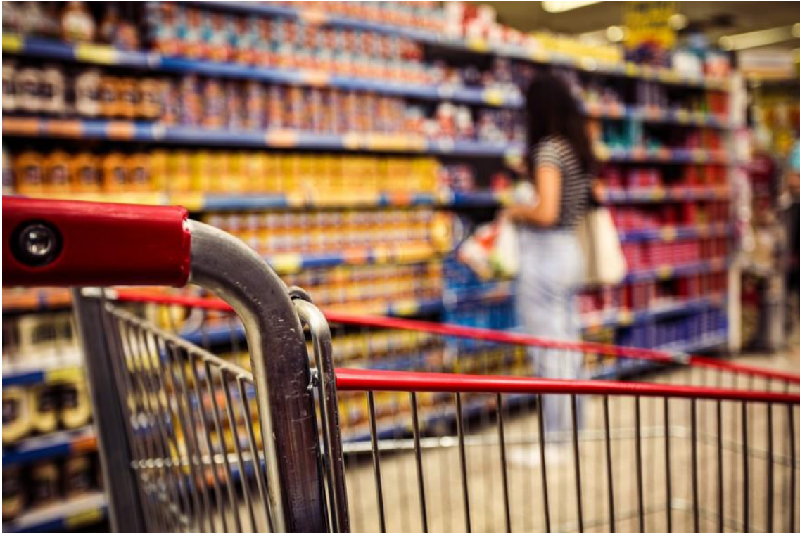
Supermercados investem em marcas próprias para diminuir custo do cliente

Puxada por alimentos, a inflação avançou 0,42% em janeiro, segundo o Índice de Preços ao Consumidor Amplo (IPCA) divulgado nesta quinta-feira. A queda da gasolina foi o que ajudou a segurar o índice no mês, segundo o IBGE . Ainda assim, o resultado superou as previsões dos analistas, que esperavam alta em torno de 0,36%.