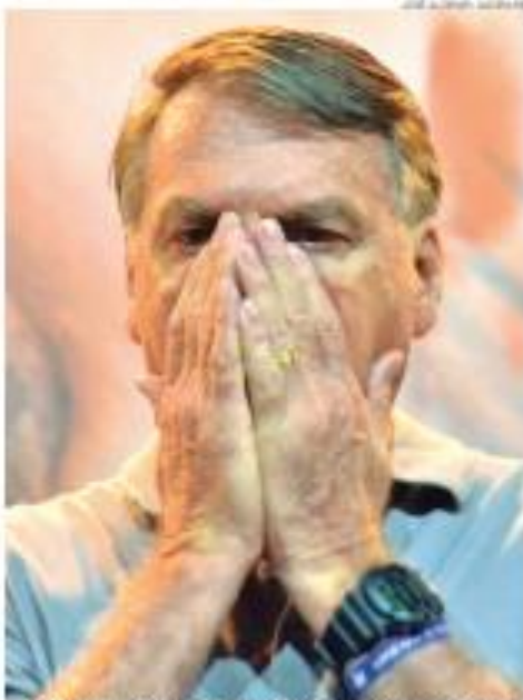
Ex-presidente Jair Bolsonaro (PL) foi alvo de buscas nesta quinta-feira em casa

No meio da operação dessa quinta-feira, o presidente nacional do PL, Voldemar Costa Neto, também foi alvo de buscas e apreensão. Ele, porém, acabou preso em flagrante por porte ilegal de arma e por estar com uma pistola de seus amigos do ganguê ilegal, segundo a PF. A arma estava com a documentação vendida e registrada no nome do filho do político.