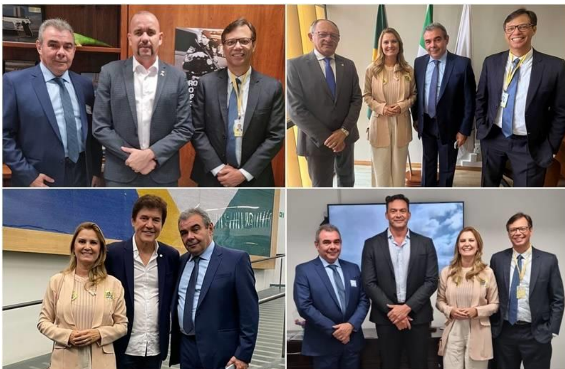
Diretoria da Fecomércio reunida com os deputados Sargento Gonçalves, Benes Leocádio e Robinson Faria, além do senador Styvenson Valentim

A Fecomércio RN participou, nesta quarta-feira (7), de uma ação em Brasília que cobrou a manutenção do Programa Emergencial de Retomada do Setor de Eventos (Perse), cuja extinção está prevista na Medida Provisória 1.202/2023, de iniciativa do governo.