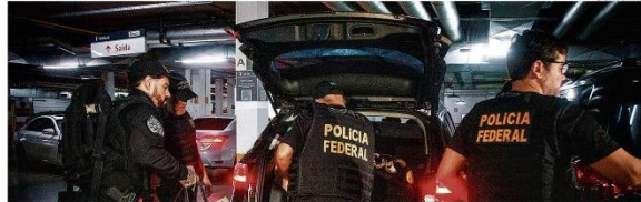
Buscas. Agentes da PF deixam sede do PL em Brasília, onde foi achado documento com argumentos para embasar a decretação de estado de sítio

FLÁVIA OLIVEIRA Operação expôs envolvimento da cúpula fardada do governo PÁGINA 3