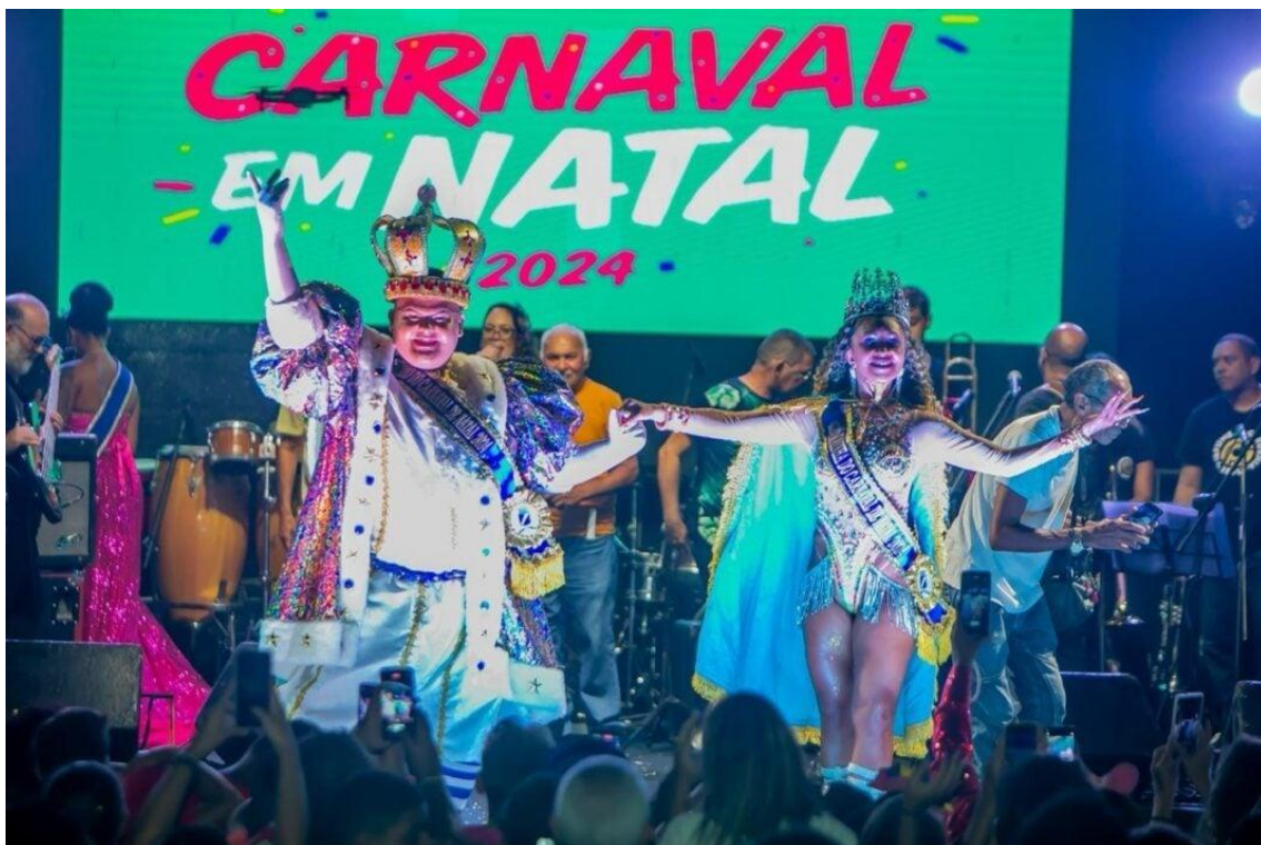
Rei e Rainha do Carnaval recebem hoje Chave da Cidade para o Carnaval 2024.