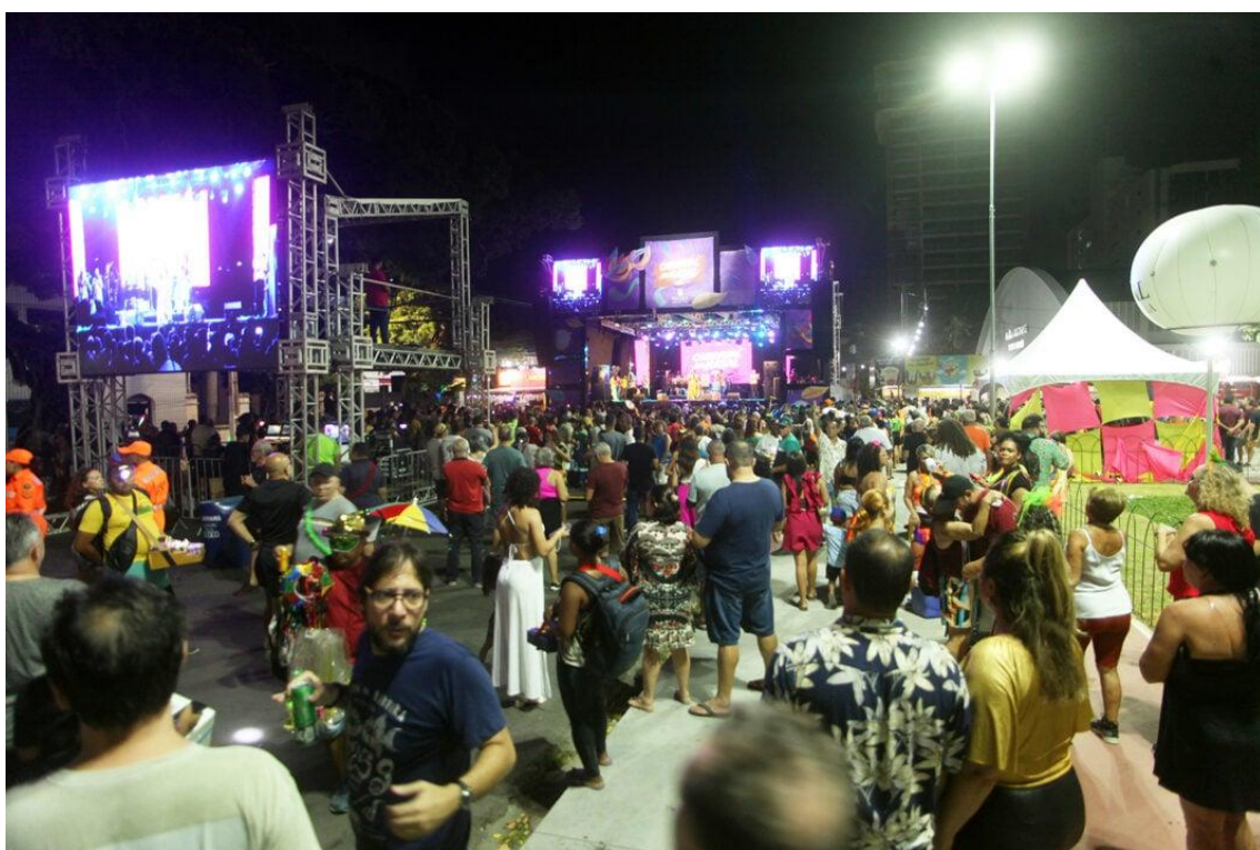
Público compareceu à abertura oficial do carnaval