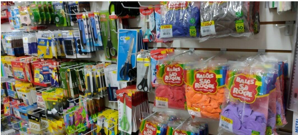
Procon Natal identifica aumento de 18% no preço do material escolar