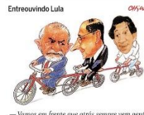
—Vamos em frente que atrás sempre vem gente!

Sigla de André Fufuca, o PP lidera lista de prefeituras com convênios com a pasta na reta final de 2023. Cidade do pai de Lira receberá R$ 4 milhões. PÁGINA 4