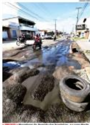
■ CIRCULO ■ Manobras da Avenida das Nações, na zona Norte, sofrem com buracos. São vários outros de população. ■ PÁGINA 10 ■