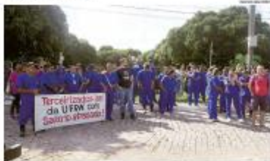
■ CIRCULO ■ O protesto da UFRN em 2019 com um número de 30 a 40 mil pessoas. Pagamentos de salários, bem como de terceirizados estão em atraso, mas não há relação com o déficit. ■ PÁGINA 14 ■

■ PÁGINA 14 ■ O goleiro de vôlei tem sido comum. É a volta de uma volta no RN. ■ PÁGINA 14 ■