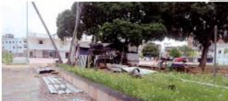
▶ ABASTECIMENTO Enquanto a falta de água em pleno verão tem sido alvo de reclamação de consumidores potiguaros desde o início de ano, a Prefeitura de Natal, em Natal, não tem previsão de retomada para uma rede de distribuição de água em situação de risco, que está sendo tapada e a própria obra para ser feita. ▶ PÁGINA 11