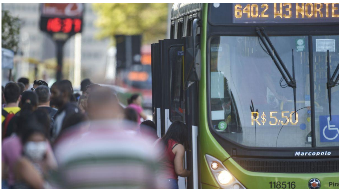
Transportes tiveram o maior impacto na inflação do ano em 2023

Em dezembro, inflação do país foi de 0,56%, sexto mês seguido em alta; meta para este ano era de inflação de 3,25%, com margem de tolerância que poderia ir de 1,5% até 4,75%