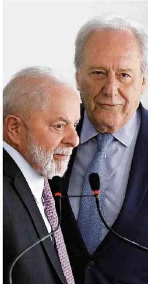
Lula e Lewandowski no anúncio do novo titular do Ministério da Justiça; magistrado aposentado do STF vai fazer a transição com Flávio Dino até o dia 30.