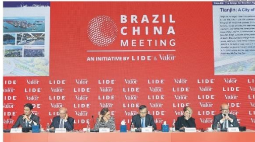
Participantes do painel sobre agricultura do Brasil-China Meeting, iniciativa do Valor e Lide, com apoio institucional de "O Globo" e CBN

que assume em fevereiro a vaga que era de Rosa Weber no Supremo. O cargo é estratégico num momento em que o país enfrenta desafios na área de segurança pública, que fica sob o guarda-chuva da pasta. Após a indicação, Lewandowski disse ao jornal "O Globo" que esse tema será sua prioridade. O novo ministro, que tomará posse na Justiça apenas no mês que vem, foi indicado por Lula ao STF em 2006. Páginas A11 e A12