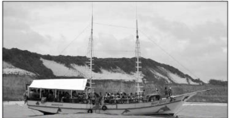
Taxa sobre passeios foram instituídas por lei municipal e abrange todas as praias de Tibau do Sul

A tarifa cobrada em Tibau do Sul é diferente da ilha de Fernando de Noronha, por exemplo, onde é cobrada uma Taxa de Preservação Ambiental de R$ 92,89 por dia. As leis que estabeleceram as cobranças foram publicadas em Diário Oficial entre novembro de 2021 e dezembro de 2022. “A Prefeitura de Tibau do Sul informa que as ta-