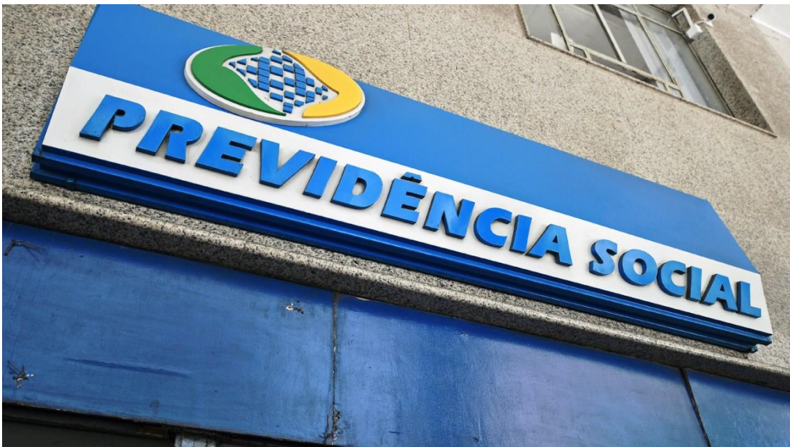
Fachada de posto da Previdência Social localizado no Rio de Janeiro (RJ) - 19/02/2019

Benefícios acima do salário mínimo têm a correção pelo INPC, já os de quem ganha o piso cresceram 6,97%, índice de reajuste do salário mínimo