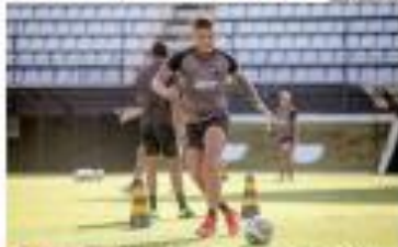
▶ COPA BRASILEIRA Esperando por Portugal, a ABC encara o jogo neste sábado, em Natal. Se passar terá R$ 1,3 milhões. ▶ PÁGINA 11